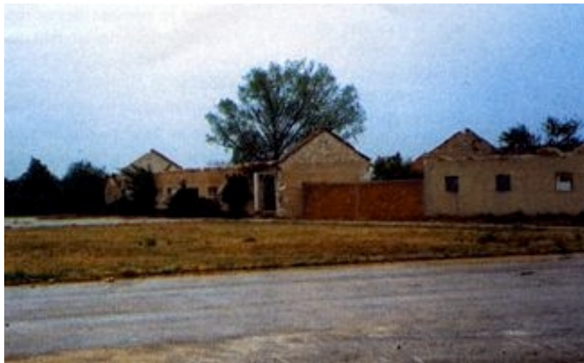
Na mjestu razorenih kuća gradit će se crkva

pokrenuo je i mali privatni biznis no to teško ide jer je roba namijenjena upravo najsiromašnijima koje najviše pogađa nestašica novca. U prodaji ima iskustva jer je i prije u staroj državi sa štandovima obišao cijelu obalu od Poreča do Bojane. Zadovoljan je novim smještajem i stoga što starcima klima izuzetno odgovara.