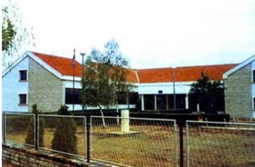
Nova škola u Kistanju

Zbog teške socijalne situacije, više od 150 stanovnika je na socijalnoj skrbi, teško je uvesti red u naplatu odvoza smeća i vode, iako se računi za struju počinju redovito podmirivati. Problemi su s vodoopskrbom u velikim gubicima u sustavu te u mnoštvu divljih priključaka (posebno po selima) i oštećenih cijevi. USAID je zainteresiran za obnovu vodoopskrbnog sustava, posebno za rekonstrukciju cjevovoda Zečevo-Đevrske i crpne stanice Zečevo. No uvjet je da program