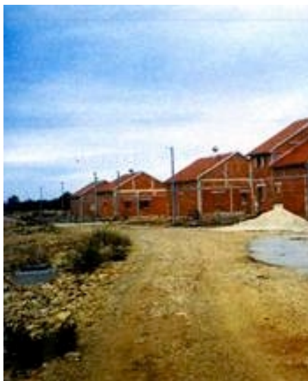
Dio naselja uz prilaznu cestu