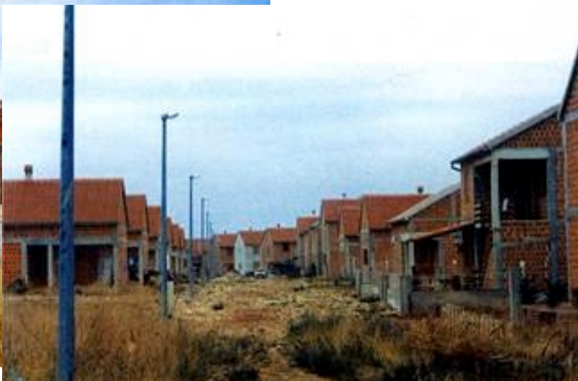
Jedna ulica u naselju u gradnji

iz Slavanskog Broda, Gra-med iz Imotskog i Cod-građenje iz Zagreba, a tvrtka Stridon iz Zagreba uglavnom je radila na uvođenju kanalizacije. Kako se radi o vodozaštitnom području sliva rijeke Krke uveden je zatvoreni kanalizacijski sustav s Kirchoff taložnicama u kojima se fekalije i otpadne vode same razgrađuju, tako da zapravo prave kanalizacije i nema, a to je rješenje stajalo 1,9 milijuna kuna.