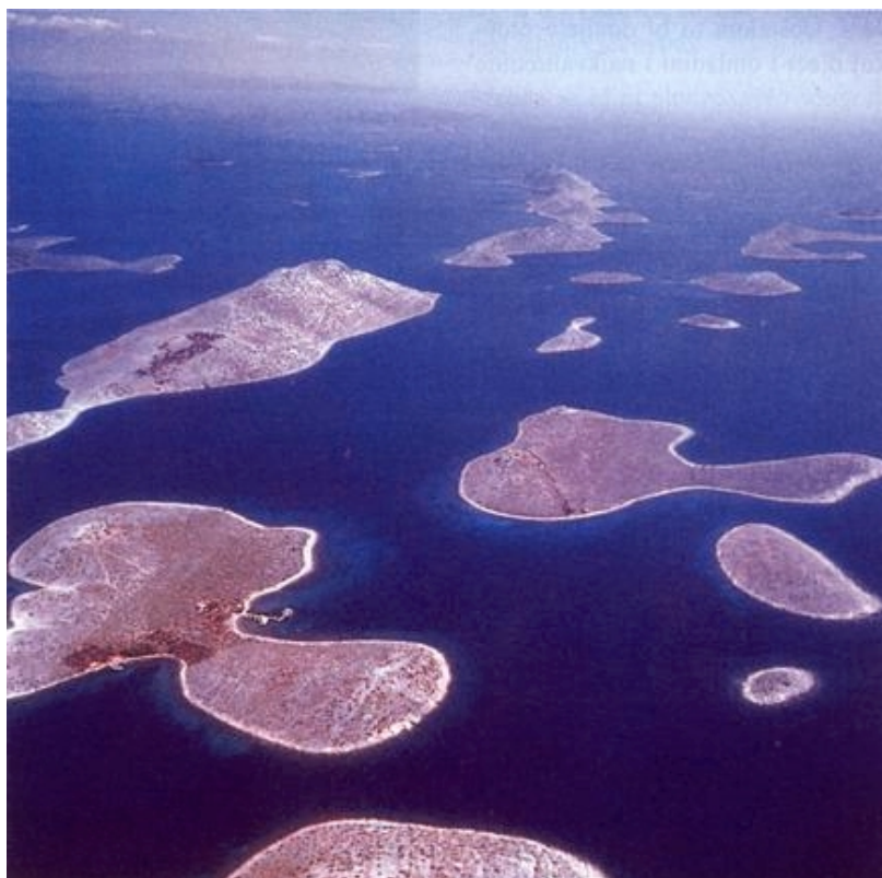
Pogled na Kornate

Valja dodati kako se često spominju i ističu obalni gradići, a zanemaruju naselja u otočkoj unutrašnjosti koja također imaju mnoštvo skrivene ljepote i sklada. Uostalom to su i najtipičnija hrvatska naselja jer su utvrđene gradove najčešće utemeljili Bizanti i Venecijanci. Slavensko je stanovništvo, a to smo isticali u našim napisima, bježalo u unutrašnjost iz sigurnosnih razloga, ali i u potrazi za plodnim poljima jer je uglavnom bilo mnogo više okrenuto iskorištavanju plodova zemlje negoli plodova mora. To, međutim, ipak nije mnoge otočane sprječavalo da u prošlosti i danas budu slavni brodograditelji, pomorci i uspješni ribari. Valja dodati da je na otocima posebno uočljivo kako je naša politika zaštite prirodnih i kulturnih vrijednosti često ograničavajući a ne poticajni čimbenik za otočko stanovništvo. To posebno vrijedi