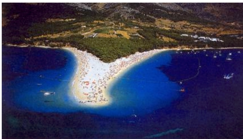
Zlatni rat u Bolu na Braču

Život je na otocima izvan ljetnih mjeseci vrlo težak, nezanimljiv i dosadan. Oni koji na njega nisu naviknuti vrlo ga teško podnose. Pokazao je to primjer s naseljavanjem prognanih Vukovaraca u napuštene vojne stanove na Visu. Danas, nakon desetak godina, gotovo ni jedan Vukovarac nije ostao na otoku. Na otocima stoga valja pokušati poticati zabavne sadržaje, ali i graditi što više sportskih dvorana i terena, po mogućnosti i zatvorenih bazena. Za takav bi se program morali pronaći izvori financiranja. Mladima koji su na otoku ostali treba pokušati pružiti što više zabave kako se ne bi u apatiji okretali drogi koja je danas sve veći i sve rašireniji problem. Sve bi kulturne ustanove, uključujući i one amaterske, koje se sve ionako financiraju iz proračuna, trebalo poticati i financijski stimulirati da što više i što češće gostuju po