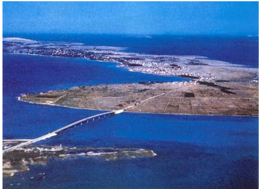
Most između kopna i otoka Vira

je došlo do nevjerojatne brojke od 2513 stanovnika Krapnja, kojemu su pribrojani stanovnici još nepriznatog naselja Brodarice na kopnu. Istini za volju valja reći da se u Nacionalnom programu razvitka otoka na jednom mjestu (na drugom je također naveden "točan" podatak) spominje brojka od 527 stanovnika, iako se nigdje ne navodi na koji je način utvrđena. Vjerojatno se ipak nekome toliko velik broj učinio nevjerojatnim pa ga je smanjio za gotovo dvije tisuće. No i na taj je način također dobivena najgušća otočka naseljenost od 1464 stanovnika po četvornom kilometru. Kada se zna da je tek trećina tog malog otoka naseljena (preostalo su polja i šume) i ta bi koncentracija stanovništva bila impozantna. No kako Krapanj stvarno ima jedva dvjestotinjak stanovnika, vjerojatno će se utvrditi da je Trogir naš najgušće naseljeni otok, jer Nin, Tribunj i Kaštel Gomilicu ionako nitko ne računa u otoke. No svi koji budu utvrđivali buduću naseljenost naših otoka trebali bi imati na umu u posljednje vrijeme vrlo raširenu pojavu da se na otocima prijavljuju i oni stalno prebivalište kojih je izvan otoka, najčešće u obližnjim gradovima. Na to ih vjero-