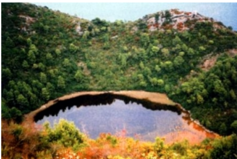
Slatina kod Prožure na otoku Mljetu

otocima, posebno tijekom dugih zimskih mjeseci. Slično bi se, ali poreznim olakšicama, moglo učiniti i s raznim muzičkim sastavima ili pjevačima. Takve stvari ne stoje mnogo, ali su njihovi učinci veliki i mnogostruki. Otočanima mogu pružiti osjećaj da nisu sasvim ostavljeni i napušteni, a za one koji dolaze ti bi posjeti mogli biti i zgodna turistička promidžba i poticaj da pojedini otok posjete i tijekom ljeta.