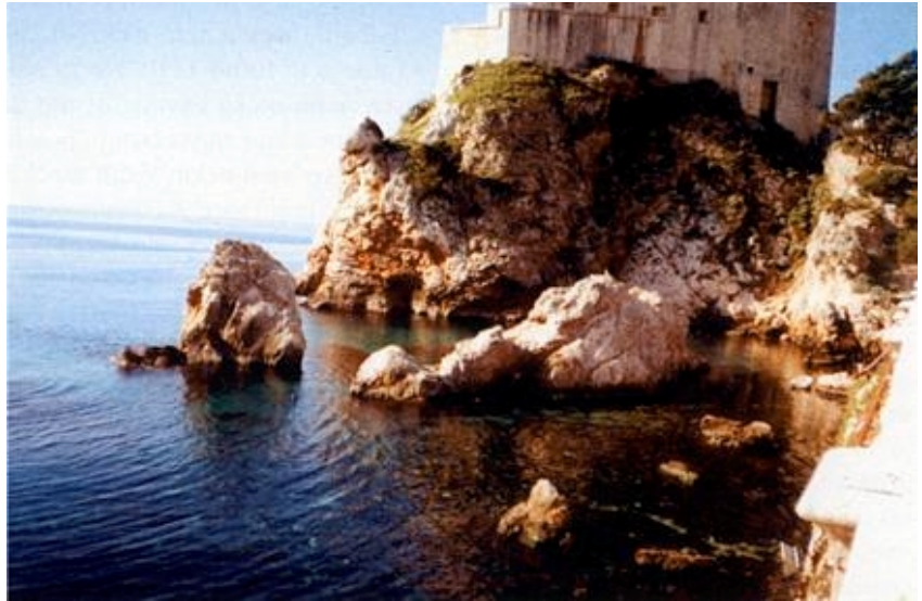
Stijene u moru ispred tvrđave Sv. Lovrijenca u Dubrovniku

Valja raščistiti terminološku zbrku o našim otocima. Da je otok kopno sa svih strana okruženo vodom (jer postoje otoci u rijekama i jezerima) to zaista uopće nije sporno. Takvih, uvjetno rečeno pravih otoka, kako tvrdi Nacionalni program razvitka otoka , ima točno 718, iako ih je u detaljnom popisu, koji je na kraju priložen, petnaestak više, a podatak navode (zapravo međusobno prepisuju) i sva ostala leksikografska izdanja. Nekada su se, što više nije slučaj, razlikovali otoci i otočići (školji), pri čemu je granica među njima bio opseg od 10 km. Postoje nadalje i hridi (ponegdje se nazivaju i kamici), a to su otoci sa znatno manjim opsegom (po nekim izvorima ispod 1,5 km), zapravo otoci koji nemaju vegetacije, osim halofitne koja je u stanju podnijeti jaku koncentraciju soli (navodi se da takvih ima 389, iako ih je u popisu približno pedesetak manje). Postoje još i grebeni (koje zovu i sike, ploče ili kameni zubovi) za koje se tvrdi da ih ima 78 (nabrojili smo ih 79, ali ih je vjerojatno više jer se ponegdje umjesto broja spominje riječ nekoliko, a mi smo uzimali samo dva). Kao definicija hridi navodi se da su to manji otoci vrhovi kojih su iznad razine mora, za razliku od definicije grebena kojih su vrhovi (zaista tako piše) ispod razine mora. Kako se ne navodi do koje dubine, kada bi se takva definicija doslovno