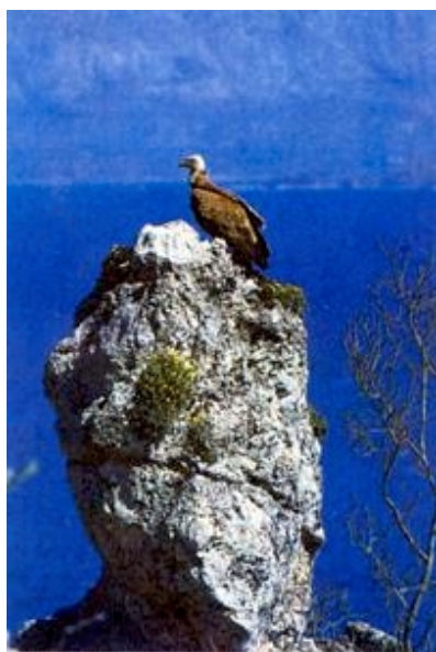
Bjeloglavi sup s otoka Cres

Zdravstvena infrastruktura na otocima redovito je zadovoljavajuća, osim na onim najmanjim gdje su povremeni dolasci liječnika za pretežno staračko stanovništvo uvijek nedovoljni. Treba odati priznanje Ministarstvu zdravstva koje je u posljednjih nekoliko godina sustavno obnavljalo ne održavane i zapuštene ambulante gotovo na svim otocima. Boljoj zdravstvenoj zaštiti pridonosi i raširena izgradnja heliodroma te hitno odvođenje pacijenata u bolnice na kopnu. Za otoke šibenskog arhipelaga dobrom se idejom, usprkos povremenom nezadovoljstvu, pokazalo uvođenje posebnoga bolničkog broda, a to bi možda bilo primjenjivo i za neke druge skupine manjih otoka. Za slično se rješenje, ali za školovanje otočke djece, zalaže i agilni doc. dr. sc. Vladimir Skračić s Filozofskog fakulteta u Zadru. Ta zanimljiva ideja vjerojatno je vrlo primjenjiva za osnovno školstvo za skupinu zadarskih otoka, a i za neke druge skupine manjih otoka. No ona bi možda bila primjenjiva i za neke druge otoke, ali za srednje škole između onih otoka koji nemaju dovoljno učenika za samostalne škole. Poznato je naime da se rijetki otočani koji školovanje nastavljaju na kopnu vraćaju na rod-