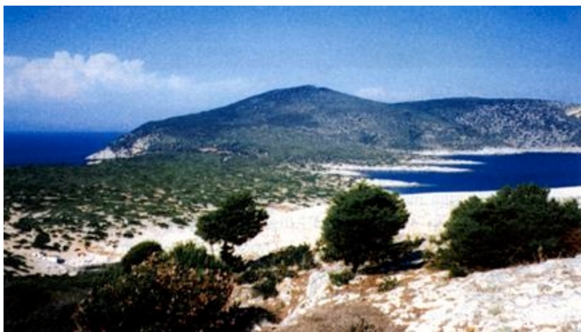
Sušac - nenaseljeni ali svjetioničarima nastanjeni otok

Tako je moguće da mi još sada uopće ne znamo koliko ukupno imamo otoka, koji je najveći naš otok, ne zna se koji je otok najgušće naseljen, ne zna se koliko točno ima naseljenih otoka, za mnoge otoke nemamo ut-