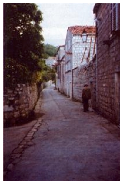
Ulica u Sudurdu na otoku Šipanu

Najteža je situacija s odlaganjem otpada. To je potpuno i zadovoljavajuće riješeno na Kvarnerskim otocima, gdje postoje i dobro uređena odlagališta. Riješeno je to i na otoku Viru, zahvaljujući mostu i odvozu otpada na zadarsko odlagalište. S manjih zadarskih, šibenskih i dubrovačkih otoka otpad se više ili manje redovito odvozi na odlagališta na kopnu. No na ostalim većim otocima otpad se uglavnom odlaže na neuređena, a često i "divlja" odlagališta. Taj bi problem valjalo početi sustavno rješavati odabirom i izgradnjom te opremanjem većih sanitarnih odlagališta s razvrstavanjem otpada koje može uključivati i kompostiranje, a ne treba isključivati ni paljenje.