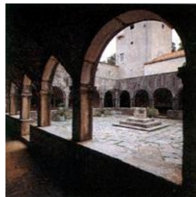
Predvorje samostana na Košljunu blizu otoka Krka

Vjerojatno bi se konačno razriješilo i koliko je otoka stvarno naseljeno i nastanjeno. Neko je vrijeme bilo uobičajeno, a miješalo se, na žalost, i u našim napisima, da su naseljenost i nastanjenost istoznačnice, a više se upotrebljavala riječ nastanjenost jer se činila ponešto hrvatskijom. To međutim zaista nije isto jer se naseljenost utvrđuje po postojanju posebnog naselja, a utvrđuje ih Zavod za statistiku uoči svakog popisa stanovništva. Tako imamo otoka s naseljima ali