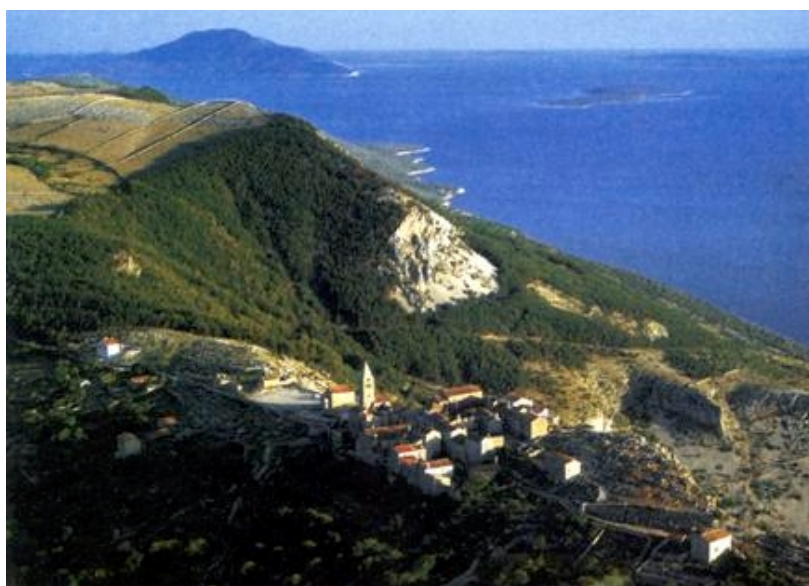
Naselje Lubenice na otoku Cresu

Zaista je vrijeme da se konačno vjerodostojno ustanovi koji je hrvatski otok najveći što, primjerice, uopće nije beznačajno s promidžbenog stajališta. Oduvijek se govori da je Krk najveći, ali je proračunima iz 1992. i 1993. utvrđeno poklapanje njegove površine s površinom Cresa (405,78 km 2 , čak do pete decimale). No valja reći da je površina Cresa izračunana