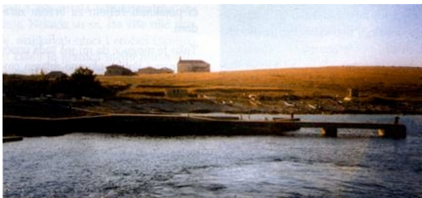
Vele Srakane pokraj Lošinja

Na samom smo kraju velike serije u kojoj smo obradili sve naseljene i poneki nenaseljeni hrvatski otok. Serija je napisa započela u broju 7. iz 1997., a završava evo u ovom 1. broju iz 2001. godine. Trajala je pune tri i pol godine, praktički je bila tiskana u svakom broju našeg časopisa, osim u pet posebnih koji su bili u cijelosti posvećeni nekim događajima, pojavama ili projektima. To je bez ovog broja 37 priloga s prosječno više od 7 punih stranica, što točno iznosi 296 stranica s gotovo 700 novinarskih kartica i točno 496 tiskanih fotografija i crteža. Po trajanju i po broju objavljenih stranica to je najopsežnija kontinuirana serija koju je časopis Građevinar poduzeo u svojoj 53 godine dugoj povijesti. Da bi se u cijelosti predstavili svi naši naseljeni otoci trebalo je proputovati