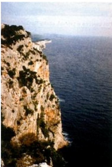
Klifovi na pučinskoj strani Dugog otoka

Vjerojatno bi konačno valjalo utvrditi i koji je naš otok najgušće naseljen. U jednom smo našem napisu ( Građevinar 6/1999.) pojasnili kako