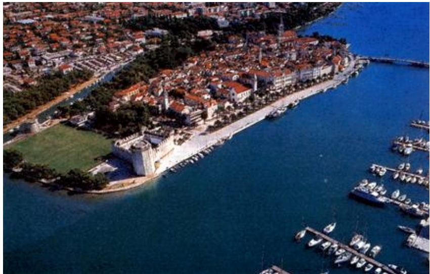
Pogled na Trogir

primijenila broj naših otoka bi se zaista neočekivano umnožio. Tada bi se u otoke svrstale sve moguće ribarske pošte i brakovi koji su uglavnom morska uzvišenja, svojevrsna morska brda. No unatoč nepreciznosti može se zaključiti da se pritom mislilo na one otočiće (hridi) vrhovi kojih su pod utjecajem plime i oseke povremeno iznad ili ispod mora. U ovoj maloj terminološkoj zbruci oko pojma otočića, hridi i grebena nije nigdje navedeno koja je najmanja veličine potrebna da se neka stijena koja strši iz mora, kakvih uz svaku otočku i kopnenu obalu ima zaista