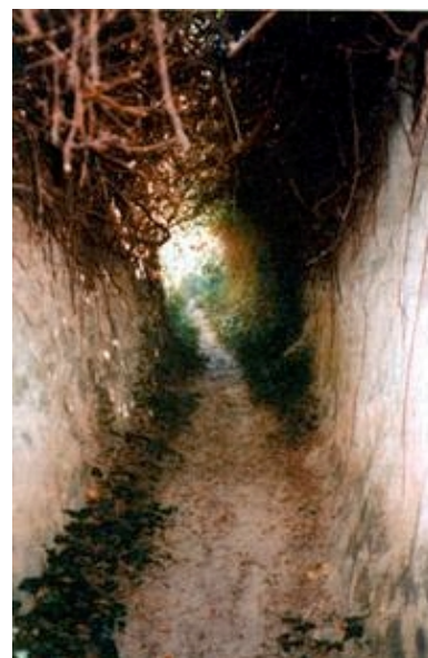
Put usječen u pijesak otoka Suska

trenutku nije naročito izgledna. Taj most nije toliko značajan za razvoj Pašmana i Ugljana (koji su međusobno povezani mostom), ali bi izuzetno mnogo značio za otoke srednjega i vanjskog niza zadarskog arhipelaga, posebno za Iž, Ravu i Dugi otok koji bi se trajektima, umjesto sa Zadrom, tada povezivali s nekom lukom na zapadnoj strani Ugljana ili Pašmana, a ujedno bi to bio i najbrži prilaz za posjetitelje Kornatskog otočja. Treći bi predviđeni most, izgradnja kojega je ujedno i najneizvjesnija, povezo kopno s Čiovom i onemogućio da povijesni gradić Trogir (uvršten u spisak svjetske graditeljske baštine) bude tranzit za sav automo-