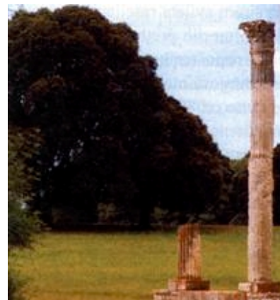
Ostaci rimskog hrama na Brijunima

Najavili smo već da ćemo nešto reći i o Zakonu o otocima, objavljenom u Narodnom novinama 9. travnja 1999. Taj je Zakon (kojemu bi vjerojatno bolje pristajao naziv: Zakon o naseljenim i nastanjenim otocima) značajno poboljšanje u odnosu državnih organa i uprave prema naseljenim, nastanjenim i povremeno nastanjenim otocima, iako kao i mnogi naši zakoni pati od poznatog "normativnog optimizma", tj. uvjerenja da će se problemi rješavati kada se zakonski evidentiraju i normiraju. Zakon predviđa, ali i priželjkuje, izradu programa održivog razvoja, bolje prometno povezivanje, upravljanje otočkim lukama, regulaciju odnosa u lovu i ribolovu, propisuje državne poticajne mjere za gospodarski razvitak, a najavljuje i posebne državne programe razvoja. Uz još neke mjere Zakon predviđa i precizne rokove, pa je tako predviđeno da u roku od četiri godine, dakle 2003., svaki otok mora imati "najmanje tri povratne veze dnevno, od kojih barem dvije brzo-brodске". Zaista je nezamislivo da će te godine s tri povratne veze biti povezani i neki otoci koji su po de-