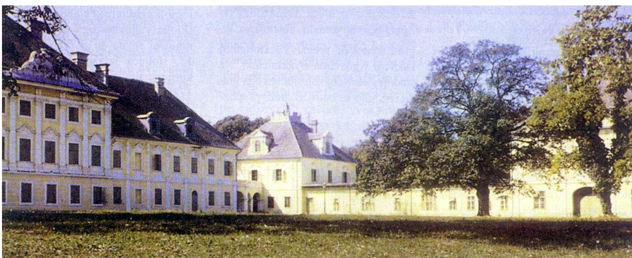
Pogled na dvorac i gospodarske zgrade sa sjeveroistoka, prije 1990. godine

Posjed grofova Eltz u Vukovaru bio je povjerenički (majoratski ili fideikomisni) posjed koji se nije smio