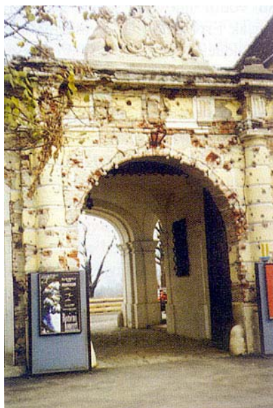
Sadašnji ulaz u dvorac

manju i stavljanju u primjereniju funkciju.