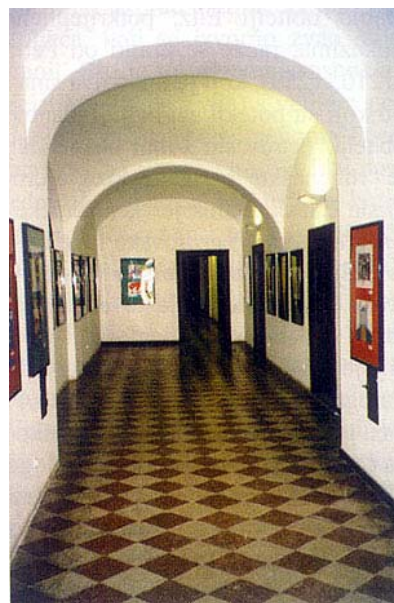
Uređeni izložbeni prostor u dvorcu

prostora smješteni su uredi i depoi. U galeriji se vrlo često priređuju raznovrsne izložbe i druge priredbe, tako da se može reći da je dvorac Eltz, zapravo Muzej grada Vukovara, iako s vanjske strane ne izgleda baš osobito privlačno, značajan čimbenik u kulturnom životu Vukovara.