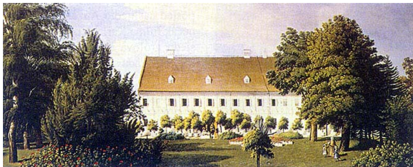
Pogled iz perivoja na sjeverno pročelje (ulje na platnu 1845. godine)

pašnjaka, 11.354 jutara šuma, 69 jutara vinograda, 71 jutara vrtova. Močvarnoga i neplodnoga tla bilo je oko 1400 jutara. Agrarnom reformom između dvaju svjetskih ratova vukovarskom je vlastelinstvu oduzeto