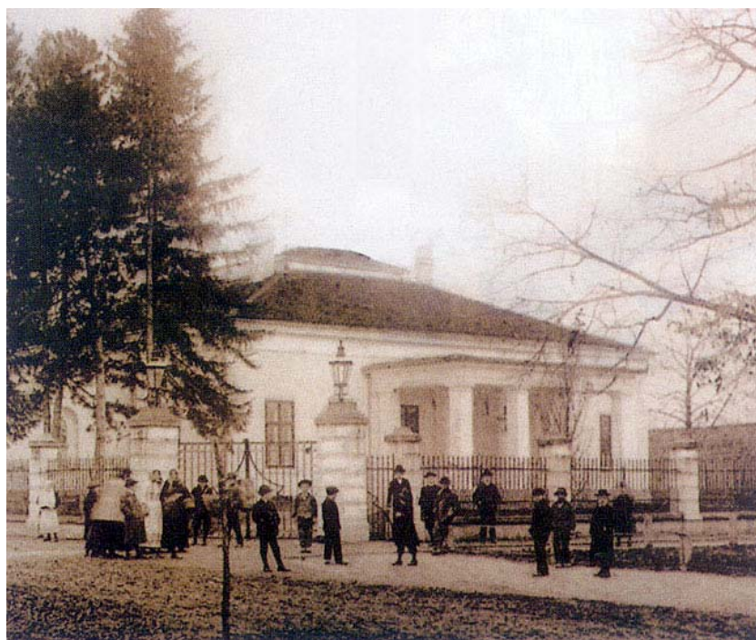
Mali dvorac Eltz (Vila Knoll) približno 1905. godine

Na zaravanku između dvorca i Dunava, na površini od oko 1,6 hektara, nalazi se perivoj. Nakon odlaska grofova Eltz iz Vukovara, ostao je bez skrbi, sedamdesetih godina 20.