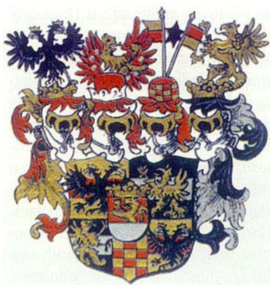
Grb grofova Eltz

Dvorac je tada bio malen, a nije još bilo ni svih onih, već opisanih, gospo-