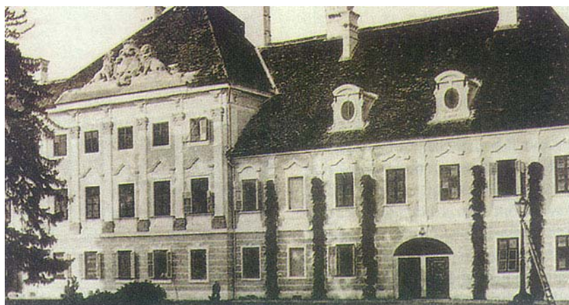
Sjeverno (perivojno) pročelje na razglednici prije 1918. godine

Smjestivši se na razmeđi Slavonije i Srijema, na krajnjim zapadnim obroncima Fruške gore, Vukovar posjeduje istaknut položaj u krajoliku. Oduvijek mu je taj položaj na brežuljku, povrh ušća rijeke Vuke u Dunav, omogućivao prirodnu obranu, a šumovito i plodno zaleđe mogućnost preživljavanja s poljodjelstvom, lovom i ribolovom. Upravo je rijeka Vuka, koja je podijelila grad na Stari i Novi grad, dala, Vukovaru ime. Tijekom stoljeća mijenjao se pisani oblik