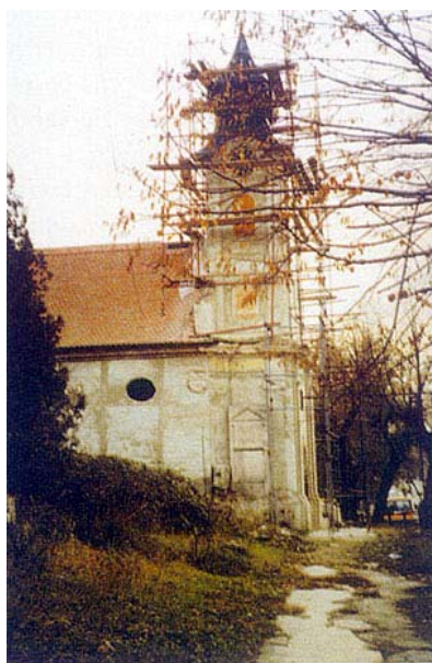
Radovi na obnovi kapelice

Inače u dvorištu je očišćena temeljito donatorskim radovima uništena i devastirana oranžerija, a od čvrste je građevine sačuvano djelomično samo prizemlje, dok je krovšte i prvi kat gotovo u cijelosti uništeno, a te dijelove dvorca dodatno oštećuju kiša i snijeg. Velike su raskošne dvorane uništene i devastirane, barokna nije obnovljena ali ipak nije srušena, dok je mramorna preuređena u izložbeni prostor, a u dijelu uređenog