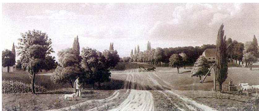
Detalj s imanja Eltz (ulje na platnu)

grad, naseljen prema višestoljetnoj tradiciji trgovcima i obrtnicima. Na srednjovjekovnoj ustrojbi staroga grada izgradio se barokni grad, prepoz-