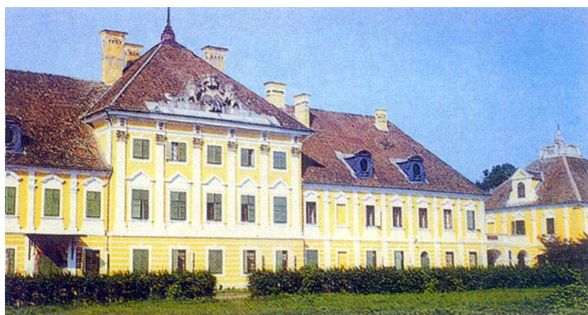
Sjeverno pročelje dvorca 1997. godine

imena grada. Hrvatsko ime Vukovo nalazimo u starim spisima do 14. stoljeća; od 14. do kraja 17. stoljeća susreću se istodobno ime Vukovo i mađarski naziv Vukovar, da bi se od