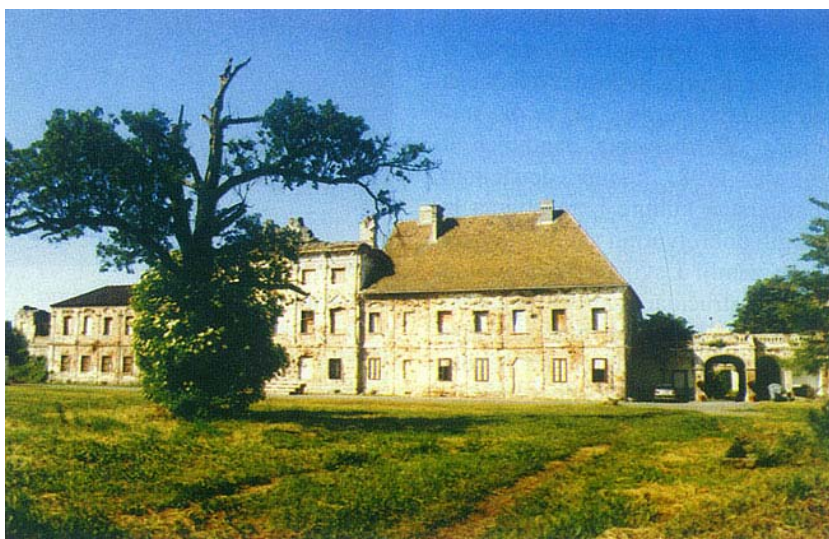
Dvorišno pročelje dvorca snimljeno nedavno

ge značajan prilog očuvanju naše baštine i dokaz pripadnosti europskom kulturnom krugu, budući da južnije od Hrvatske dvoraca i perivoja više nema. Također vjerujemo, sudeći barem po zanimanju naših čitatelja, da ovakve knjige i predstavljanja pojedinih dvoraca i perivoja pomažu njihovom uređenju i opre-