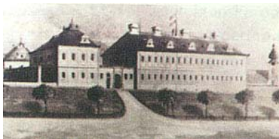
Ulično pročelje prije obnove 1895. godine

vlasti Vukovar je doživio istočnjačku preobrazbu. Kada je austrijski general Ferdinand Gobert grof Aspremont ušao 1687. godine bez otpora u Vukovar, našao je oštećeni stari grad,