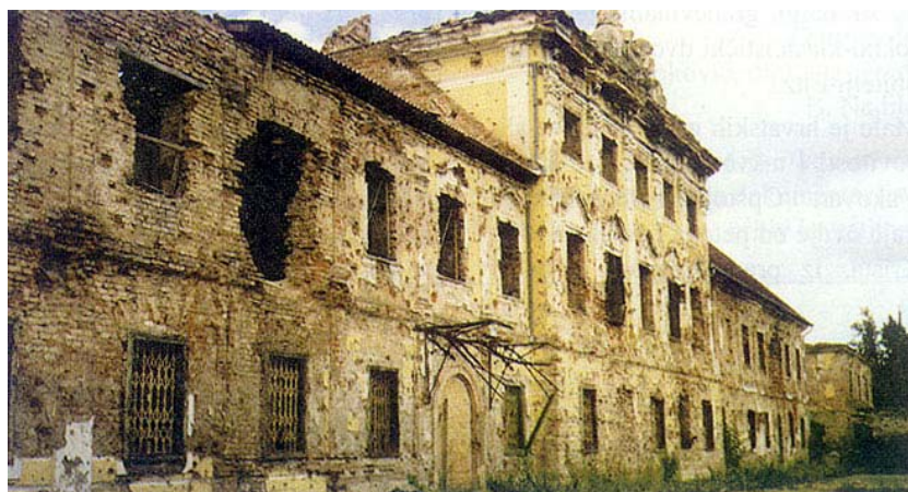
Sjeverno pročelje dvorca uoči 1990. godine