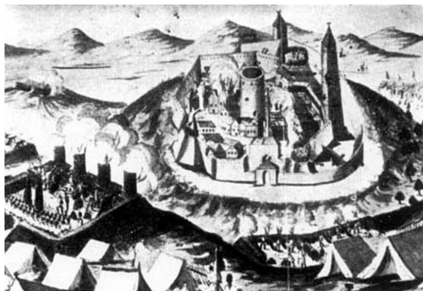
Opsada Cetina 1790.