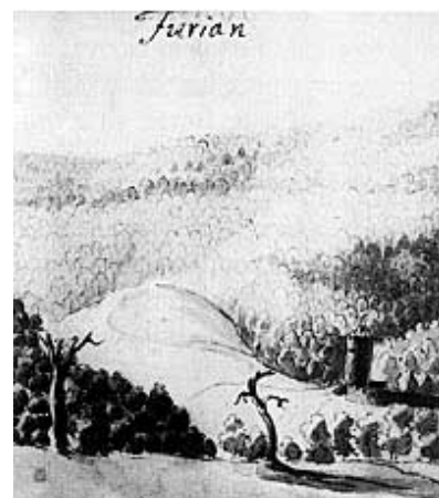
Stari crtež utvrde Furjan

kordon, a francuska riječ cordon upravo i znači lanac pograničnih utvrda. Odatle i naziv povijesno-zemljopisne pokrajine Kordun koja leži uz rijeku Koranu, između Male i Velike Kapele na zapadu i Petrove gore na istoku. To je pretežno 250 m visok krški ravnjak, građen od vapnenaca i dolomita, a prošaran izoliranim brdima. Šume su sječom znatno smanjene, pripada najslabije razvijenim hrvatskim predjelima, a stanovnici se uglavnom bave zemljoradnjom i stočarstvom. Inače gotovo je cijeli Kordun bio za Domovinskog rata okupiran i u sastavu srpske paradržave, a oslobođen je u kolovozu 1995.