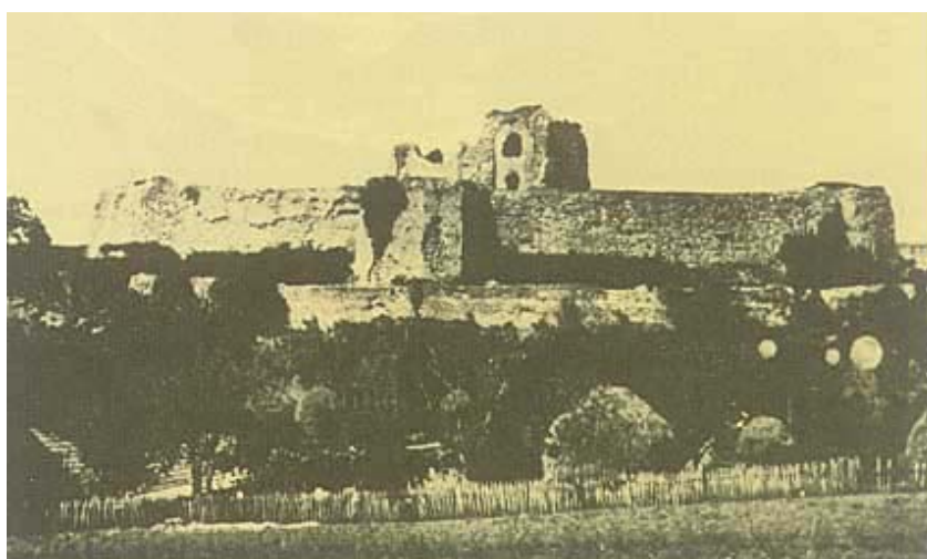
Stara fotografija cetinske utvrde nakon rušenja

Godine 1536. nakratko su Cetin zauzeli Turci, potom je temeljito obnovljen, a kralj ga Rudolf preuzima 1578., da bi 1584. kao ruševina bio napušten. Frankopani su bili ugovorili s bosanskim pašom da će cetinska utvrda ostati pusta. Iako dogovor nije u cijelosti poštovan, ipak je od 1596.