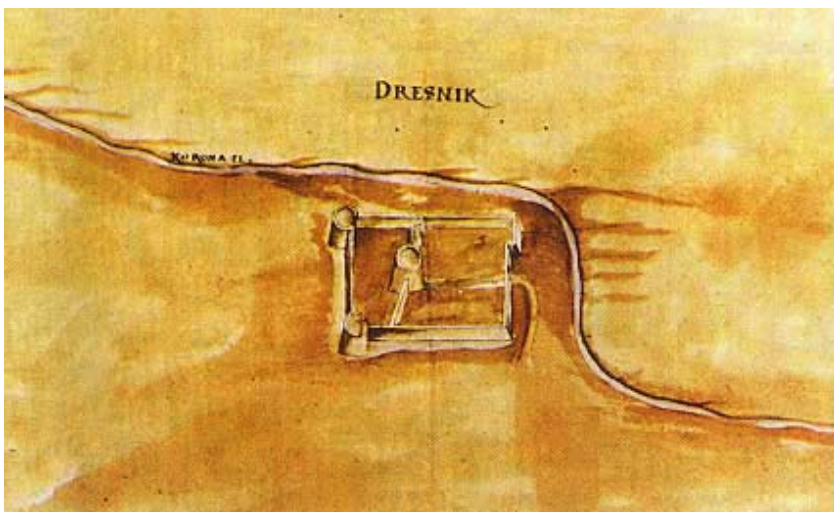
Drežnik na crtežu M. Stiera 1660.

Utvrda Drežnik-grad sada je potpuno u ruševinama, a smještena je nad kanjonom na lijevoj obali Korane. Inače neposredno pred Drežnikom Korana naglo skreće prema istoku, da bi gotovo dvadesetak kilometara bila i granična rijeka s Bosnom i