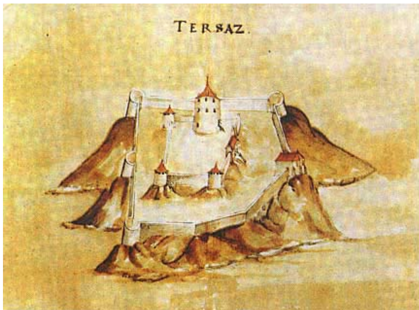
Prikaz utvrde Tržac na crtežu M. Stiera

Hercegovinom. Tu na desnoj obali, dakle u susjednoj državi, pokraj istoimenog sela stoji poznata utvrda Tržac koja je nekad bila u sastavu drežničke župe. Kod diobe frankopanskih imanja 1449. pripao je Tržac, zajedno s Brinjem, Jalovikom, Sokolom i Bihaćem, Bartolu Frankopan pa se već njegov sin Nikola naziva Frankopan Tržački. Toj je frankopanskoj lozi pripadao i posljednji izdanak slavne plemićke obitelji - Fran Krsto Frankopan, pogubljen 1671. u Bečkom Novom Mjestu.