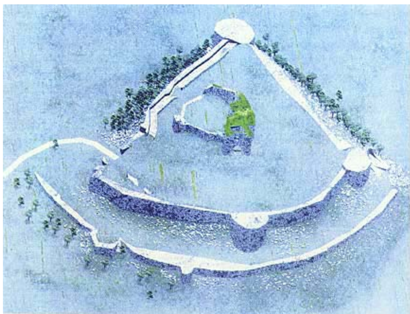
Kompjutorski prikaz tlocrta ostataka cetinske utvrde

Cetin je tradicionalno ime utvrde i naselja, a riječ je slavenskog podrijetla i označava mjesto pokriveno tamnom gustom šumom. Zna se da utvrda postoji još od 14. stoljeća. Naselje je mijenjalo ime u nekoliko navrata. Novo i veće hrvatsko naselje formirano je u obližnjem Kekić