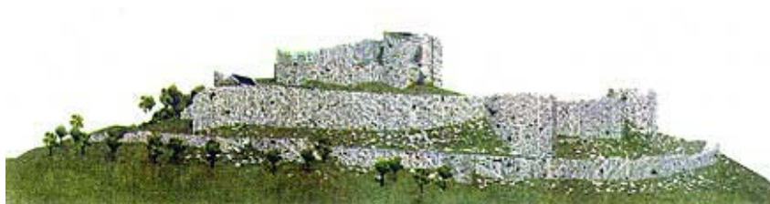
Kompjutorski prikaz ostataka utvrde Cetin

kulu izgradio je Ali-paša Bosanski 1739., a glavnu kulu Drenđulu 1756. (ili 1757.) Mehmed-paša. Iz vremena oslobođenja, a i poslije, sačuvalo se ipak dosta crteža. Još 1849. podignuta je u sastavu utvrde velika vojarna. Kako je u utvrdi do 1860. stanovao vojni zapovjednik Korduna, a ona je malo potom po nalogu krajiške uprave prodana i razorena. Sačuvala se čak i fotografija iz tih posljednjih dana.