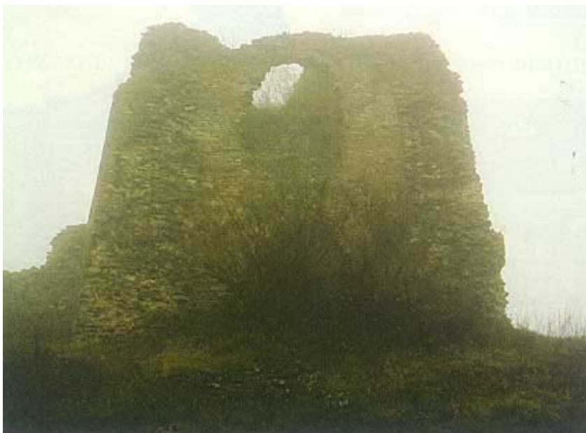
Ostaci usamljene kule

Pomalo je neobična sudbina utvrde Cetin. Osim prvobitne izgradnje, o kojoj uostalom nema nikakvih pisanih tragova, činjenica da su tu veliku i značajnu utvrdu Turci gradili i popravljali, a s naše su je strane sustavno i temeljito uništavali. To je bilo potpuno u skladu s raširenom strategijom da se napuštene utvrde razruše kako ne bi poslužile neprijatelju. I kada je cetinska utvrda konačno oslobođena, radikalnim je pretvaranjem u vojarnu opet devastirana. A odluka da se na dražbi proda i razruši te iskoristi kao građevni materijal bila je također u skladu s raširenom praksom vojnih vlasti. Slično je učinjeno i u Ugarskoj nakon 1848. kada su praktički srušene sve utvrde kako ne bi, u slučaju nemira, mogle poslužiti kao skrovište pobunjenicima. Zna se da je seljak koji je utvrdu kupio najviše zaradio na zatečenoj drvenoj građi, a da je kameni materijal tek djelomično iskorišten, no i on je u međuvremenu raznesen. Ono što ovu utvrdu čini pomalo mit-skom u hrvatskoj povijesti, i ono po čemu je svima poznata, jest činjenica da je u njoj, ili u njezinoj blizini, 1. siječnja 1527. za hrvatskog kralja izabran nadvojvoda Ferdinand iz dinastije Habsburgovaca, koja je potom