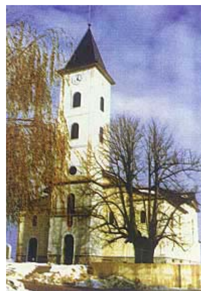
Župna crkva u Cetingradu nakon obnove

Naselje Cetingrad bilo je gotovo potpuno razrušeno tijekom okupacije. Danas je obnova završena i ne mogu se otkriti nikakvi tragovi minulog rata. U središtu su mjesta izgrađene i zgrade s ambulantom, općinom i ostalim javnim službama. Obnovljena je i crkva Uznesenja Blažene Djevice Marije, najveća sakralna građevina u Slunjskom dekanatu koja je bila spaljena, a potom minirana i svedena na veliku hrpu građevinskog otpada. Crkva je bila izgrađena 1891.