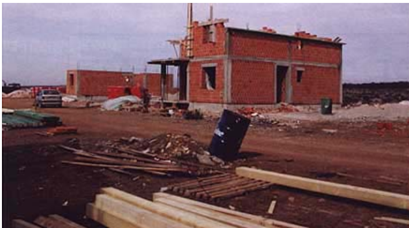
Gradnja novog naselja u Benkovačkim selima

de se planovi i za veliko novo naselje u Golubiću koje bi imalo više od 120 obiteljskih kuća. Valja reći da