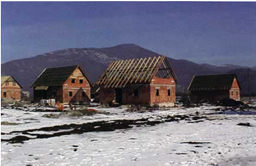
Gradnja naselja u Gračacu tijekom zime

sasvim je druga situacija i Ličko-senjskoj županiji (37) gdje su se gradile uglavnom nove kuće, i to u općini Plitvička jezera (32), a tek se jedna obiteljska kuća obnavljala u Lovincu.