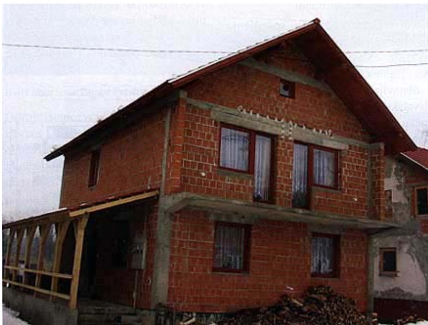
Jedna izgrađena obiteljska kuća u Voćinu

Model takve obnove sličan je modelu koji se primjenjuje pri obnovi obiteljskih kuća čije je vlasništvo neupitno. U obnovu su uključene dvije uprave Ministarstva javnih radova, obnove i graditeljstva – Uprava za prognane i izbjegle i Uprava za obnovu. Nakon izdanih suglasnosti izrađuju se upute za izvođenje sa specifikacijama potrebnoga materijala, a izrađuju ih posebne konzalting tvrtke koje potom i nadziru izvođenje. U obnovu su, iako s nešto manjim udjelom, uključeni i donatori. Materijal na gradilište dostavljaju posebno izabrani dobavljači. Među