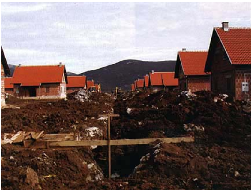
Izvedba infrastrukture u novom naselju u Gračacu

privatnom (43). Od toga je daleko najviše kuća u takvom tipu obnove i u cijeloj Hrvatskoj bilo na području grada Petrinje (157), od čega najviše obnova oštećenih kuća, a značajan je broj takvih kuća i u Gvozdu (42), Sunji (39), Novskoj (36), Donjim Kukuruzarima (29) i Glini (27). U ostalim je općinama i gradovima taj broj značajno manji. To su: Dvor, Hrvatska Kostajnica, Jasenovac, Majur i Topusko.