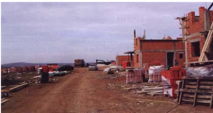
Konture novog naselja Kukulaj već se naziru

koja je u ovo područje već uložila, a spremna je i dalje ulagati, znatna financijska sredstva.