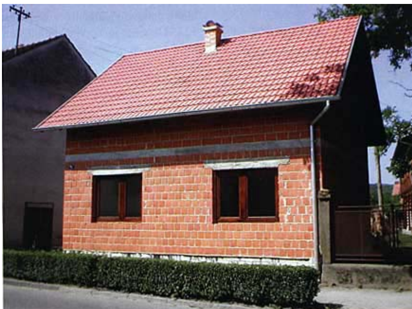
Dvije obiteljske kuće u Petrinji

Gornji Bogičevci (35), Okučani (75) i Stara Gradiška (3). I tu se najviše obnavljalo privatnih obiteljskih kuća i kuća kupljenih od Agencija za promet nekretninama (ukupno 86), ali je bilo i razmjerno mnogo novih obiteljskih kuća građenih na državnom zemljištu, posebno u Okučanima (29).