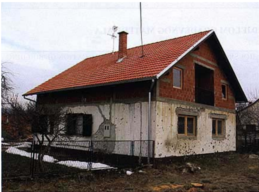
Dograđeno potkrovlje na oštećenoj obiteljskoj kući u Medarima

njima su velike građevinske i trgovačke tvrtke ( Brodmerkur, Industrogradnja, Instalotehna, Gramat i Astra International ), ali i neke mnogo manje (Trgovački obrt Marić-Bem iz Mirkovaca, KIA iz Orahovice, Pleper iz Novske i Smit-comerce iz Zagreba). Oni na gradilište građevni materijal dovoze u tri etape. Najprije dovoze osnovni građevni materijal za izgradnju kuće do pod krov, potom materijal za krovšte zajedno sa stolarijom, a na kraju materijal za unutrašnje uređenje, u što su uključene žbuke, osnovna sanitarna oprema i sl. Devedeset dana nakon posljednje isporuke vlasnik gubi pravo na uporabu privatno zauzete imovine.