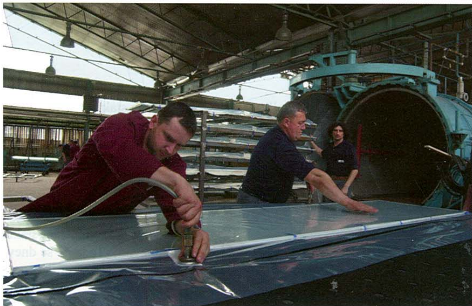
Detalj iz proizvodnje

budu postavljeni pogoni za proizvodnju float-stakla, u Lipik glasu trebalo bi raditi oko 450 ljudi. Veći broj sadašnjih zaposlenika krenuo je na tečaj talijanskog jezika, a uskoro će biti organiziran i tečaj za rad na računalima.