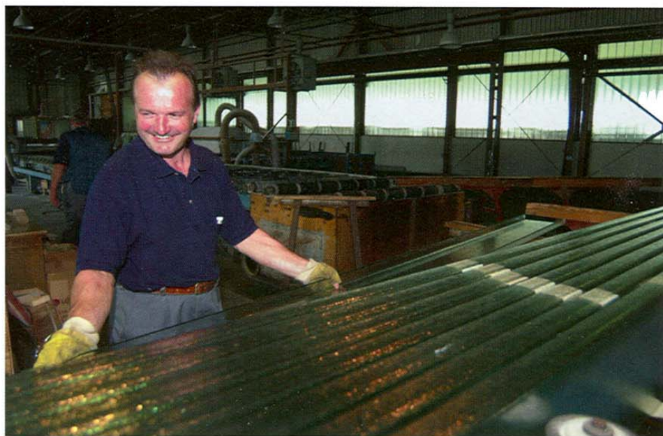
Rad na proizvodnji stakla

Nedavno je Lipik glas dogovorio s tvornicom automobila Volkswagen izradu stakla za novi model automobila "bentley". Trenutno se s VW-om pregovara o izradi stakla za još jedan model "bentleya", a izglednim se čine i dogovori o proizvodnji stakla za nove modele "lamborghinija" i "ferrarija" te za novi Peugeotov model 407. VW će u proizvodnju uložiti 700 tisuća eura koji će se utrošiti za kupovinu strojeva i alata za izradu stakala. Početak proizvodnje stakla