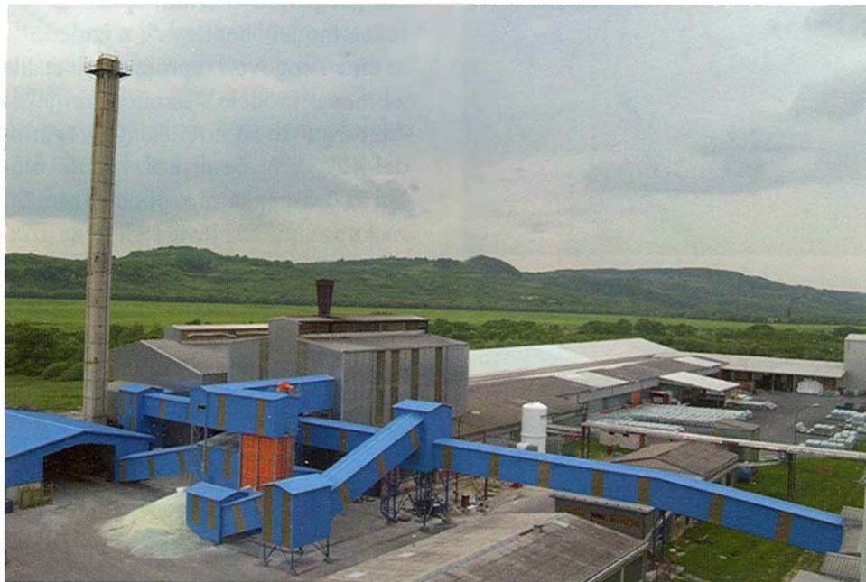
Pogled na tvornicu stakla u Lipiku

Sklopljeni su i novi ugovori o radu s 200 radnika, čiji se broj ne smije smanjiti u sljedećih pet godina. S obzirom na veličinu ulaganja očekuje se da će biti otvoreno novih 200 radnih mjesta, a posredno još 300. Danas Lipik glas već ima 206 radnika. Novi ugovori donose i redovitu isplatu plaća (oko 3500 kuna). Kad