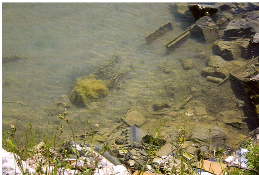
Duboke naslage peloidnog mulja

Područje Morinjskog zaljeva ima riješenu vodoopskrbu. Odvodnja otpadnih fekalnih voda još se uvijek rješava lošim septičkim jamama, ali kako kaže Zoran Bumbak, koji inače radi u šibenskom Vodovodu , mogućnosti da se i ovaj problem riješi ima, posebno sada kada je pri kraju izgradnja kanalizacijskog sustava i pet kilometara dugoga podmorskog ispusta za grad Šibenik. Opasnost za Morinjski zaljev mogla bi biti nekontrolirana stambena izgradnja u Donjem polju, koje se nalazi nasuprot Jadrtovcu, i nažalost ima visokokvalitetnu zemlju koju bi bilo prava šteta potrošiti za stambenu izgradnju, a posebno ako bude protuzakonita. Zainteresiranih za sadnju maslina ili vinograda u tome kraju, čini se, nema, ali za gradnju kuća, kako vrijeme bude odmicalo, moglo bi ih biti sve više. S neriješenom infrastrukturom, pokraj sedimentata peloidnog mulja koji se milijunima godina taloži u Morinjskom zaljevu, na njegovu dnu