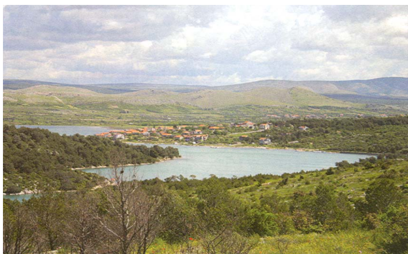
Pogled na Morinjski zaljev

Ekološka udruga Morza krenula je u priču o zdravstvenom turizmu puna entuzijazma i zanosa. Zoran Bumbak, ing. građ., kaže da ga žalosti potpuna nezainteresiranost stanovnika da u tom poslu budućnosti i sami sudjeluju. Zadovoljavaju se s malo ribe i malo rada u polju i ne traže mnogo više. Velike nade članovi Udruge polažu u to da se u sklopu planova za građenje na ovome prostoru počelo stvarati naselje kuća koje grade stanovnici Koprivničko-križevačke županije. Kažu, sve je legalno i po planu. Oni tu namjeravaju sami provoditi odmor, ali planiraju i dovoditi turiste. Do dolaska turista u većem