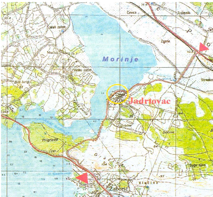
Zemljovid Morinskog zaljeva

I tako dok stojite na obali maloga Jadrtovcva razmišljate je li to jedini grijeh koji je učinjen. Možda je bolje da je rijeka izgubljena u podzemlju nego da je ostala i nastavila prikupljati sve ono što kiše speru s bezbrojnih gomila smeća i građevinskog otpada razbacanog na sve strane. Stanovnici Jadrtovcva, pola u šali a pola ozbiljno, prepričavat će da je ovdje