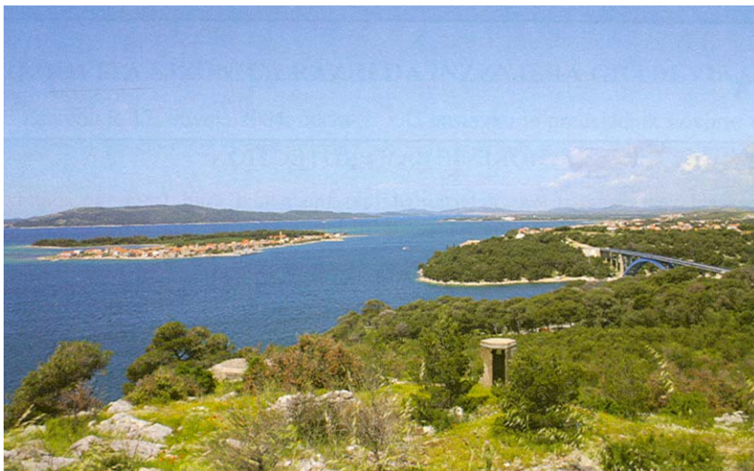
Panorama morske obale ispred Morinskog zaljeva s otokom Krapnjom

boravio potencijalni investitor zainteresiran za razvitak zdravstvenog turizma zasnovanog na ljekovitosti peloidnog mulja Morinjskog zaljeva. Razgovori su se kretali u željenom smjeru, a kako je bio red povesti gosta da razgleda područje u koje je spreman investirati, povelu su ga na dio velikog priobalnog pojasa zaljeva i on je u moru ugledao jedan odbačeni akumulator. Njegovu zaprepaštenju, kažu Jadrtočani, nije bilo kraja i razgovori su nekako zapeli. Očekivano sve je završilo na dobroj oboritoj ribi, koja se inače mrijesti u Morinjskom zaljevu i peloidnom mulju, ali se budući investitor više nije javio.