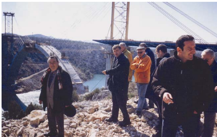
Članovi DIT AGG Zadar u posjeti gradilištu mosta Krka (4. ožujka 2004.)

skih inženjera (HSGI), posebno na skupštinama u Splitu i Šibeniku. Prigodom nedavnog službenog otvaranja autoceste Zagreb – Split mnogi su se članovi prisjetili organiziranih stručnog obilazaka gradilišta toga golemog projekta, posebno tunela Sv. Rok, a potom i dionice od Žute Lokve, do Gornje Ploče odnosno do Maslenice. Na to podsjećaju i zajedničke fotografije. Ugodan i pomalo iznenađujući događaj za pedesetak naših članova bilo je i prošlogodišnje zajedničko okupljanje na proslavi 55. obljetnice postojanja tvrtke Lavčević d.o.o. iz Zadra u Zadarskoj županiji.