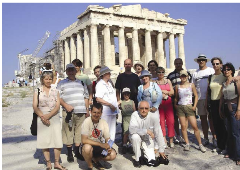
Zajednički snimak sudionika stručnog putovanja na Akropoli u Ateni

sve atenske spomenike i Posejdonov hram u Pireju. Ipak najviše im se dopao, a mnoge i oduševio, arheološki lokalitet u Delphima s Apolonovim svetištem i stadionom. Osim ljepotom bili su zadivljeni i pažljivim planiranjem u korištenju prostora. Valja dodati da se na u Grčku i natrag putovalo komfornim trajektom.