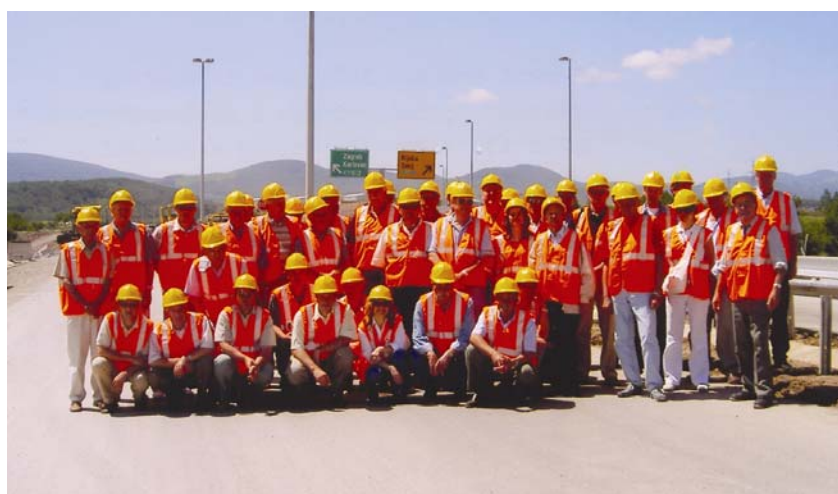
Članovi DIT AGG-a Zadar na dionici Žuta Lokva-Gornja Ploča autoceste Zagreb-Split (17. travnja 2004.)

četverogodišnjem razdoblju. Ali članovi budućeg Predsjedništva morat će biti znatno aktivniji u pripremanju proslave 60. obljetnice utemeljenja u 2007. godini, kako bi Društvo tu proslavu mogli proslaviti s novim uspjesima i poticajima. Vjerujemo da će u pripremanju za obilježavanje te značajne obljetnice, u gradu koji je u minulim ratovima toliko stradao, a koji su graditelji uvijek iznova uspješno obnavljali, biti i mnogo razumijevanja od strane političkih struktura u gradu i Županiji. Uostalom za svoj je rad i doprinos DIT AGG Zadar dvaput od grada dobio značajna priznanja – Grb grada Zadra i Nagradu grada Zadra. Vjerujemo da će se proslavi kao pokrovitelj priključiti i HSGI, koji je u proteklih 30 godina 3 puta proglašavao DIT AGG Zadar za najuspješnije i najaktivnije društvo. DIT AGG Zadar imao je od utemeljenja do danas više od tisuću članova – arhitekata, građevinara i geodeta, a više od 200 više nije među živima. Dugogodišnji predsjednik i voditelj mnogih akcija te organizator mnogih stručnih ekscurzija Boris Petračević, dipl. ing. građ., iznenada nas je napustio prošle godine, baš kao i Tomislav Valerijev, dipl. ing. arh. te mnogi drugi koji su dali velik doprinos i Društva i izgradnji Zadra i Zadarske županije. Vrijeme izmiče, ali uz uspomene ostaju i građevine