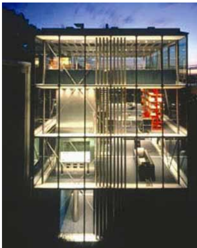
Kuća R 128 noću

Kuća R 128 je četverokatnica izgrađena 2000. u zelenoj zoni njemačkog grada Stuttgarta. Projektirana je kao kompletno reciklirajuća građevina koja nimalo ne zagađuje okoliš i potpuno je samostalna što se tiče energetske potrebe. Cijela je kuća ostakljena i bez unutrašnjih podjela. Čitav konstrukcijski sustav i projektiranje temelje se na modularnom principu. Kuća se električnom energijom opskrbljuje iz sunčanih pretvornika.