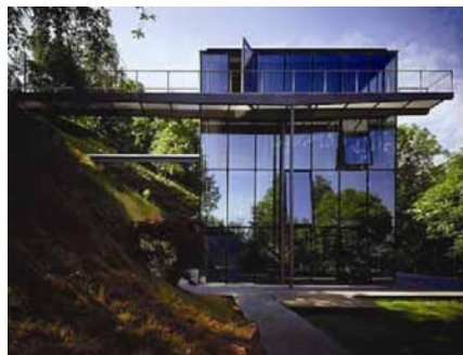
Pogled na staklena pročelja kuće

Problemi su vidljivi i na trenutačnim konstruktivnim rješenjima, u njihovom osnovnom projektnom konceptu i načinu na koji se izvode. Građevinski se elementi često proizvode na samoj lokaciji. To neizbježno rezultira pogreškama i uzrokuje znatna odugovlačenja u procesu građenja, ne samo zbog preklapanja različitih faza u konstruiranju, već i zbog ovisnosti proizvodnje na lokaciji o vremenskim uvjetima. Sljedeći problem tradicionalnih metoda građenja sastoji se u stalnom miješanju različitih materijala koji tvore složene komponente što se ne mogu sasvim reciklirati. Također, električne i sanitarne