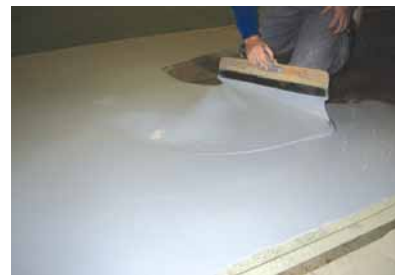
Izvedba industrijskog poda

Iz tablice se vidi da epoksidni industrijski podovi imaju najmanje nega-