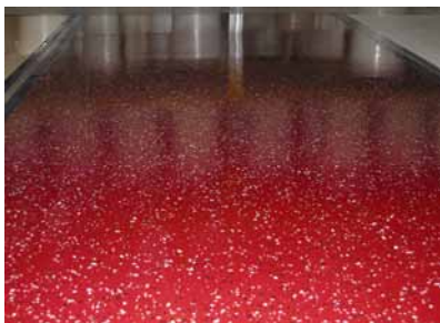
Izgled jednoga industrijskog poda

Kritične su točke kod industrijskih podova završne gornje zone podloge, način njihove pripreme i mehanička stabilnost, te nadgradnja različitim završnim sustavima.