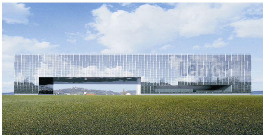
Pogled na Lentos danju

Noću se građevina pretvara u buktinju koja se zrcali na tamnoj površini Dunava. Ispod staklene konstrukcije umetnuta su svjetla kojima se tonovi boja i jačina svjetla mijenjaju te pro-