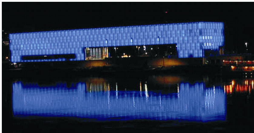
Pogled na Lentos noću

Dominirajući su materijal zgrade staklo i beton. Beton je vidljiv, što građevini daje poseban izgled uz kombinaciju sa staklom koji je materijal svjetlosti. U staklenim se pročeljima danju izvana zrcali okolina i nebo. Noću je obrnuto. U izložbenim prostorijama na katu staklo dozira svjetlost koja se u prostor kontroli-