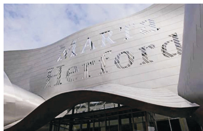
Dio pročelja iznad glavnog ulaza

te se gradić Herford često uspoređuje s Bilbaom.