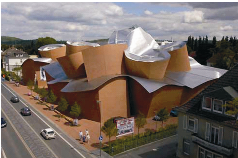
Pogled na Muzej MARTa

Gehry je integrirao u kompleks i povezo staklenim hodnikom koji vodi prema središnjem foajeu . Oko središnje točke nižu se galerije, neizmjerivi kutovi, kružni i drugi segmenti koji mogu predstavljati značajnu teškoću za izlaganje pojedinih umjetničkih djela.