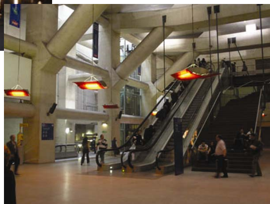
Stanica St. Lazare podzemne željeznice u Parizu

Hoće li grad Zagreb koji se guši u prometnim problemima smći hrabrosti za radikalne zahvate poput izgradnje nekoliko novih mostova, lake gradske željeznice ili denivelacije i ozbiljnije nadogradnje željezničke prigradske mreže, tek ćemo vidjeti. Nažalost, moramo ustanoviti