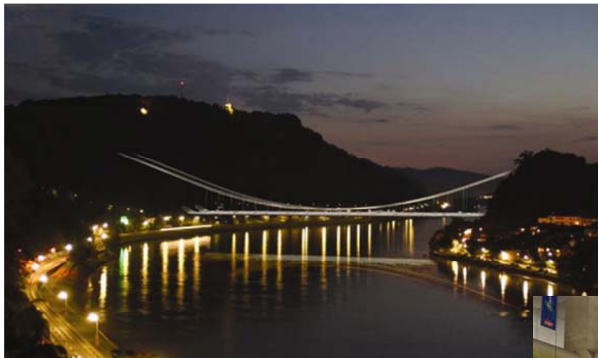
Most Donaubrücke u Linzu

kog i autobusnog prometa i vrlo zanimljivih cestovnih tunela na relaciji otok Hong Kong i poluotok Kowloon.