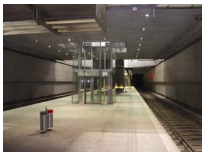
Postaja podzemne željeznice u Salzburgu

U Zagrebu je održan stručni seminar Transportni infrastrukturni objekti u urbanim sredinama na kojem su ugledni europski stručnjaci predstavili neke kapitalne projekte kojima su gradovi poput Linza, Beča, Salzburga, Hong Konga ili Pariza riješili ili namjeravaju riješiti svoje prometne probleme. Riječ je o velikim projektima poput izgradnje podzemnih garaža i parkirališta, prigradske željeznice, novih mostova u urbanim sredinama, gradskih obilaznica i lakih gradskih željeznica/metroa. Realizaciju sličnih projekata u Zagrebu posljednjih je godina najavilo i Gradsko poglavarstvo Zagreba.