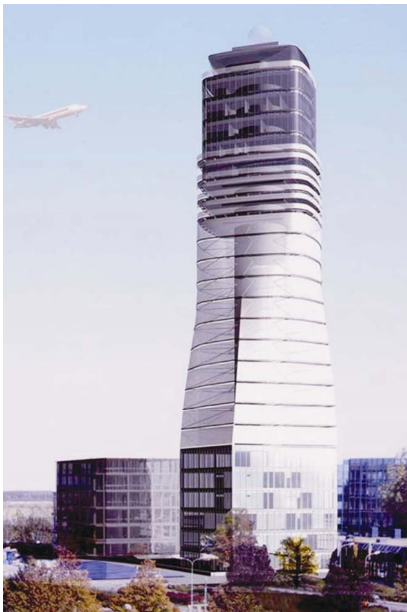
Novi toranj bečkoga aerodroma

Glavni cilj projekta bio je utemeljenje nove poslovne strategije uređenja prostora suvremenoga društva u