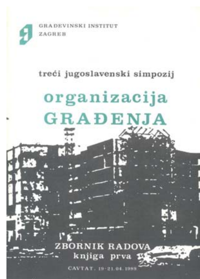
Naslovna strana zbornika radova simpozija na kojem je 1989. osnovano Društvo za organizaciju građenja Hrvatske