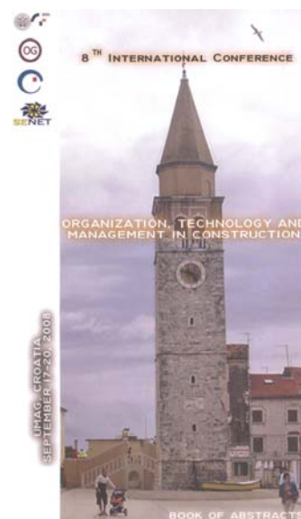
Naslovna strana zbornika s međunarodnog skupa u Umagu 2008.

Konferencija u Umagu bila je ujedno i 5. SENET konferencija i postigla je dosad najveći uspjeh. Bilo je gotovo 290 sudionika, a okruglom je stolu o novom zakonu o inženjerskim djelatnostima u građenju bilo nazočno čak 210 domaćih stručnjaka. Od šezdesetak radova polovicu su objavili inozemni autori.