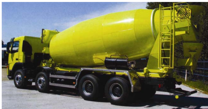
Automiješalice Schwing Stetter volumena 12 kubika

U toj branši među veće proizvođače pripada njemačka tvrtka Schwing Stetter koja je posebno omiljena na području bivše Jugoslavije. Njihov je program vrlo sličan konkurentskom, ali je nešto bogatiji jer nude kombinaciju miješalice s pumpom.