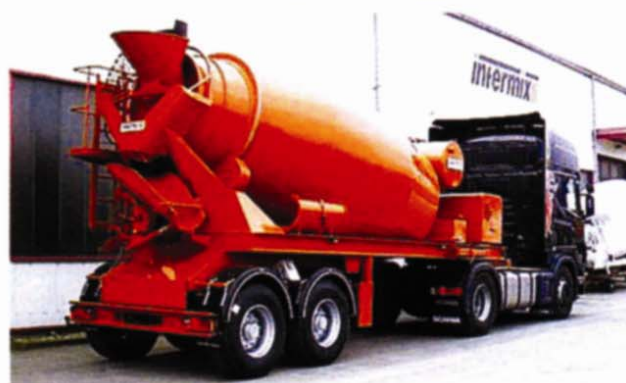
Automiješalice Intermix na različitim podvozjima

Sve je važnija njemačka tvrtka Intermix , osnovana 1984. u Heimertingenu, koja je specijalizirana za izradu miješalica volumena od 3 do 15 kubika. Intermix svoje proizvode nadograđuje i s prikolicama i željezničkim vagonima.