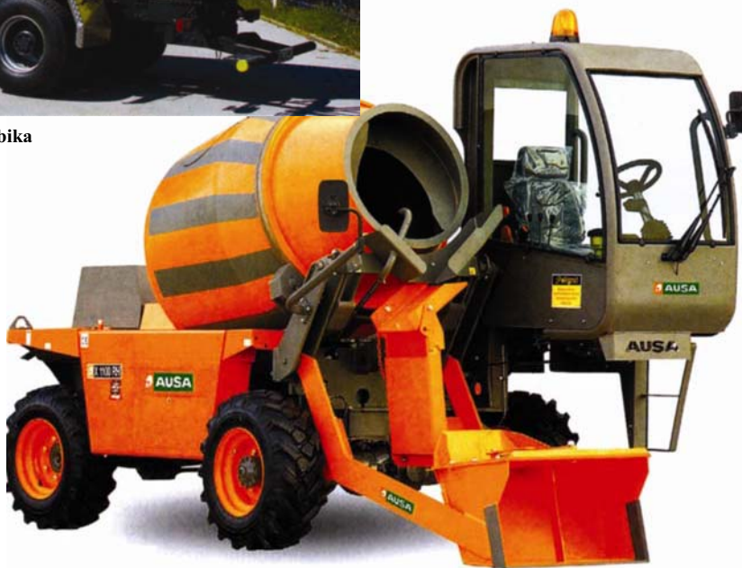
Mali španjolak volumena 500 kg

Libherr osigurava veliku uštedu tim novim komandnim pultom jer se rad motora samostalno regulira s obzirom na količinu betona u bubnju. Funk-