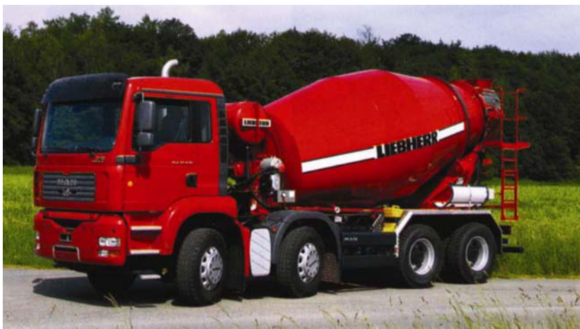
Automiješalica Libherr HTM 804 SL

Postigao je to smanjivanjem mase spirale unutar bubnja, s uporabom aluminija i jake plastike gdje je god to bilo moguće te uporabom tanjega, a čvršćeg čelika. Zbog te se optimi-