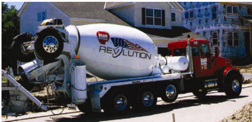
Automiješalica s bubnjem od umjetnih vlakana

dok u Americi proizvođači automiješalica sami izrađuju i vozila te u njih ugrađuju motore poznatih proizvođača ( Cummins , Caterpillar