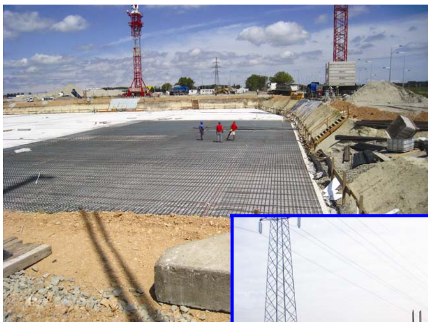
Izvedba poda podzemne garaže