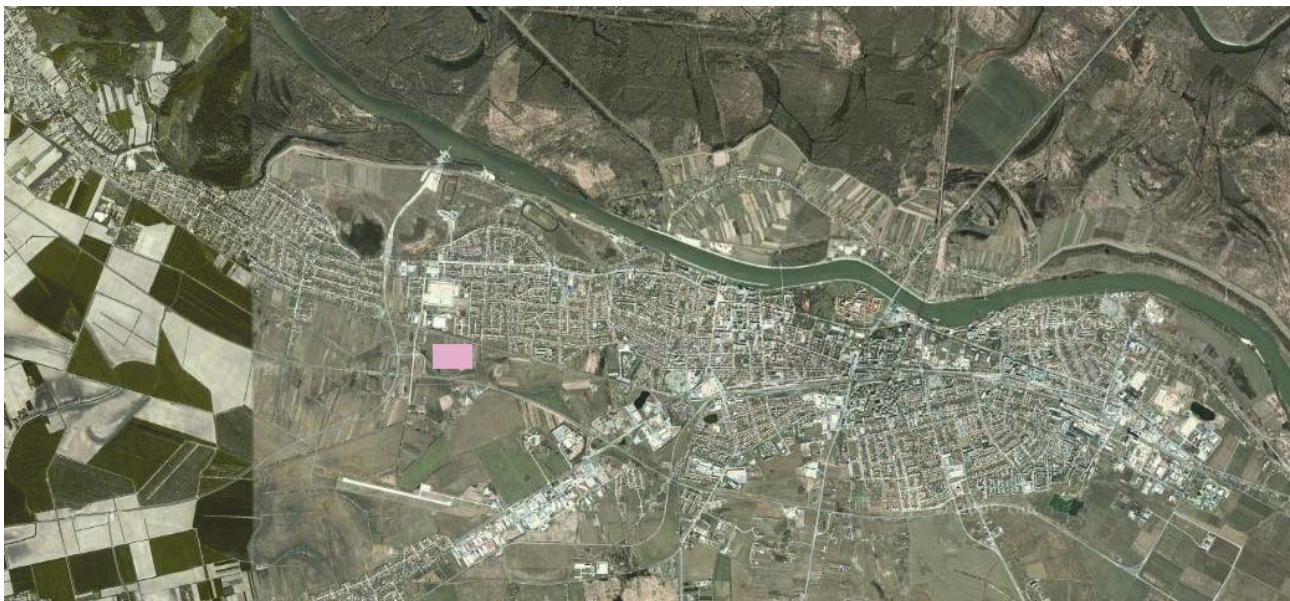
Položaj gradilišta na satelitskoj snimci Osijeka

Iako smo, nažalost neuspješno, pokušavali uspostaviti kontakt s predstav-