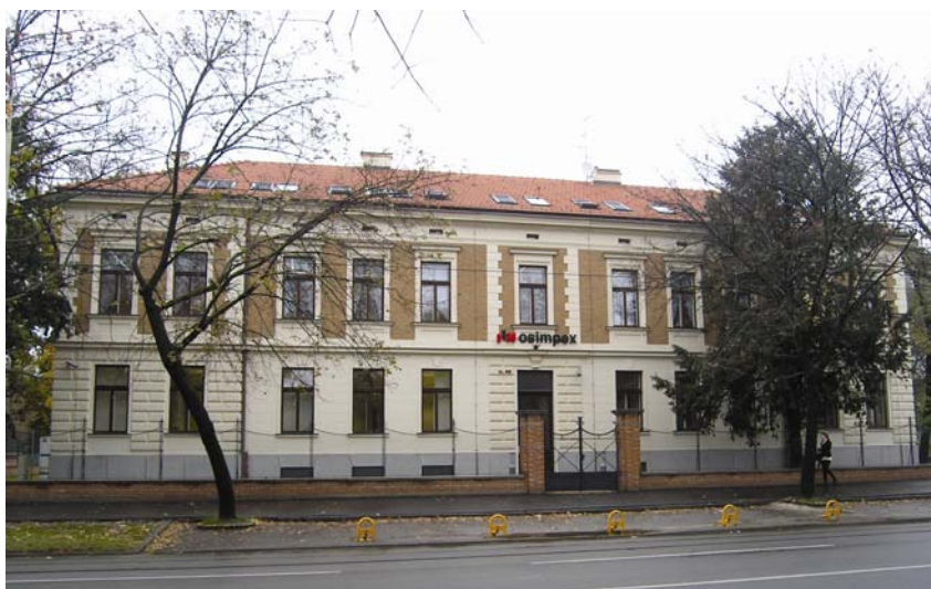
Nova upravna zgrada tvrtke Osimpex d.o.o. u Osijeku

nicima investitora, bili smo prisiljeni informacije o investitoru potražiti preko interneta, riskirajući pritom da neki od prikupljenih podataka možda i nije najtočniji. Pokušali smo ujedno zanemariti sve živopisne i brojne dodatke (posebno o bučnim glazbenim proslavama, provodima i političkim druženjima) o tom zanimljivom Osječaninu koji je relativno manje poznat u drugim dijelovima Hrvatske. Radi se ipak o jednom od naših uspješnijih poduzetnika, za kojega upućeni tvrde da je iznimno nadaren za trgovinu metalnim sirovinama i proizvodima, pa stoga nosi i neslužbenu titulu „hrvatskoga kralja željeza“.