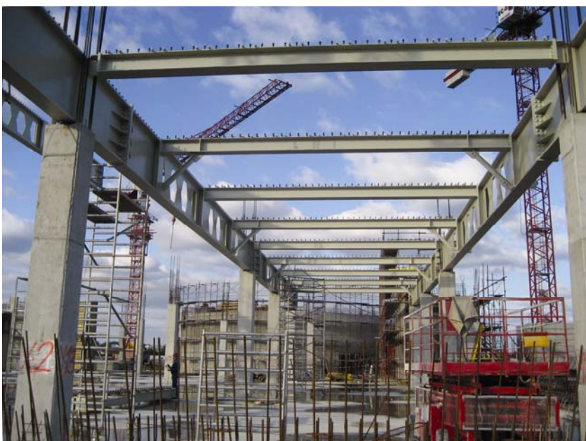
Montaža čeličnih nosača

količina. Na gradilištu će ukupno biti ugrađeno gotovo 5000 tona čelika, nešto više nego što je bilo planirano. Inače su čelični nosači dugi od 12 m