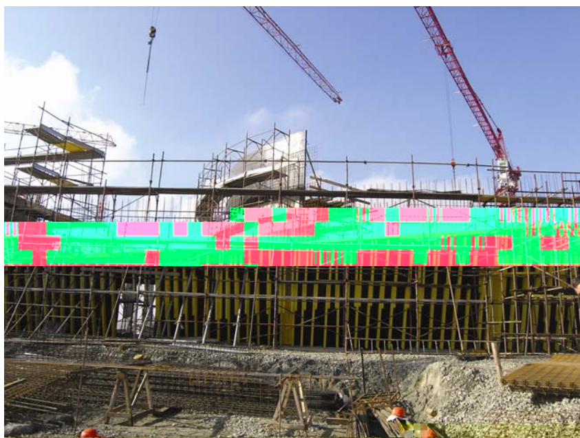
Gradnja rampe za prilaz automobila na krovu građevine

Gradilište smo obišli s nadzornim inženjerom Dariom Bilonićem. Sa zadovoljstvom smo uočili da je uprava gradilišta vrlo lijepo uređena i plato ispred nje betoniran te da svi radnici na gradilištu imaju zaštitne kacige. Razgledali smo sve dijelove gradilišta, uključujući i garažu i prilaznu rampu za parkiralište na krovu. Zamijetili smo da se rabi Doka oplata, štoviše upravo se očekuju novi dijelovi oplata prilagođeni nestandardnim zidovima. Razgledali smo i montažu čeličnih nosača, ali i gradnju armiranobetonskih stupova te postavljanje armature za dio armirano-