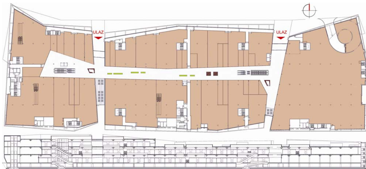
Tlocrt i presjek novoga trgovačko-poslovnog centra

posebno specijaliziran za trgovačke prostore i posjeduje specijalizirana znanja za njihovo projektiranje, osobito u rasporedu pojedinih trgovačkih sadržaja te hijerarhiji pojedinih brendova i smještaju zabavnih sadržaja, ali i završnoj obradi (keramika, limovi, izlozi, stropovi...). Sva su znanja naizgled vrlo jednostavna, ali su stečena dugogodišnjom praksom i ujedno se, ovisno o modi i trendovima, s vremenom mijenjaju. Studio XXL istodobno je vrlo poželjan partner za tvrtku Chapman Taylor , posebno stoga što poznaju odnose na tržištu i domaću legislativu. To je svojevrsni transfer znanja, ali i prigoda za velike poslove jer banke u odobravanju zajmova paze tko je