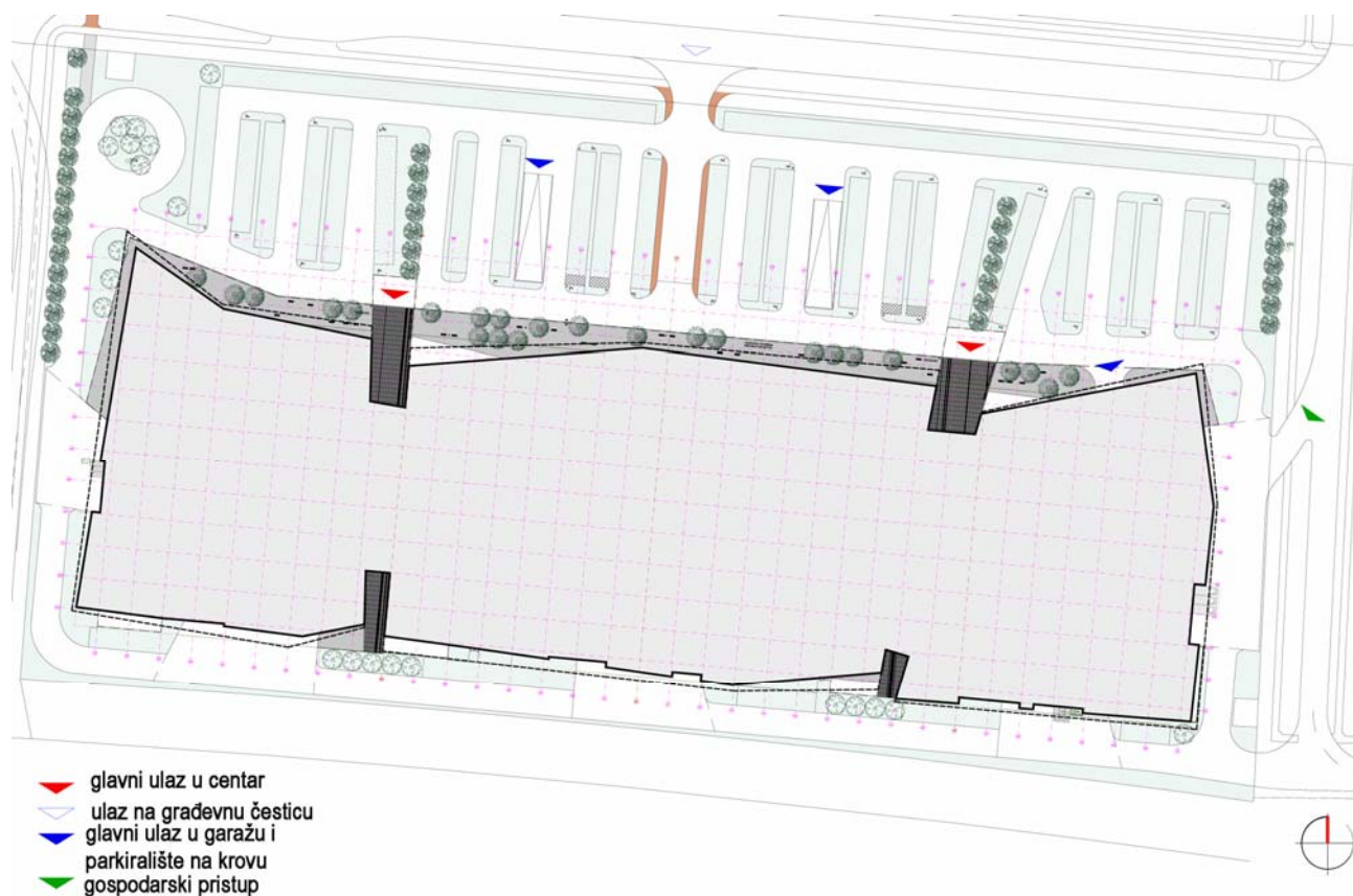
Situacija gradilišta novoga poslovno-trgovačkog centra

Arn Villemis je potvrdio da je u jednom trenutku u Hrvatskoj u pripremi bilo više trgovačkih centara nego što je to slučaj u zemljama koje su i do deset puta veće, poput Francuske, Njemačke ili Velike Britanije, te da je jedna od malobrojnih dobrih stvari sadašnje krize što mnogi od tih centara neće biti izgrađeni. No za njega je Portanova Shopping Centar , projekt na kojemu surađuju od kraja 2007. i gdje je CBRE bio i razvojni konzultant i posrednik u zakupu, ipak nešto sasvim drugo. Potvrdio je da su pomogli u angažiranju međunarodnih tvrtki, posebno engleskih, kao što je Mace za vođenje projekta ili projektni arhitektonski biro Chapman Taylor . Bili su uključeni u idejno rješenje i potpuno je siguran da će novi osječki trgovački centar biti vrlo uspješan, ponajprije zbog iznimnog položaja te sadržaja za zabavu i slobodno vrijeme, ali i atraktivnoga izgleda koji će nesumnjivo zadiviti brojne svjetske ulagače. Uspjeli su