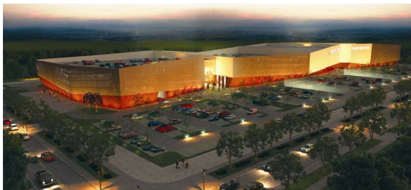
Prikaz budućega izgleda centra Portanova u predvečerje

uključen u projekt, što je u slučaju novoga poslovno-trgovačkog centra u Osijeku bilo itekako važno.