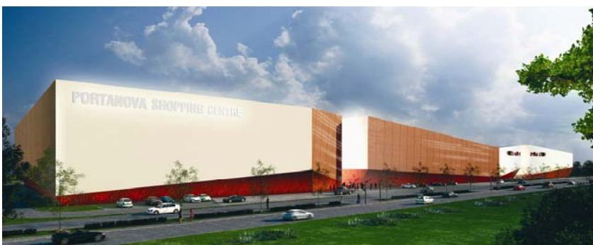
Pročelje budućega centra prema južnoj obilaznici

Zgrada se sastoji od tri glavna uglavnom potpuno zatvorena volumena, čiji