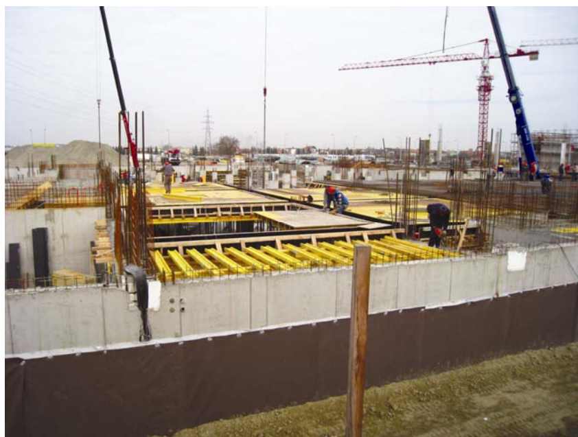
Pripreme za izvođenje armiranobetonske ploče prizemlja

ničava slobodnu uporabu dizalica. Riječ je o visokonaponskim vodovima koji strujom opskrbljuju zapadni dio grada. Rješenje je tog problema u nadležnosti investitora i obećano je da će to biti učinjeno do 1. prosin-