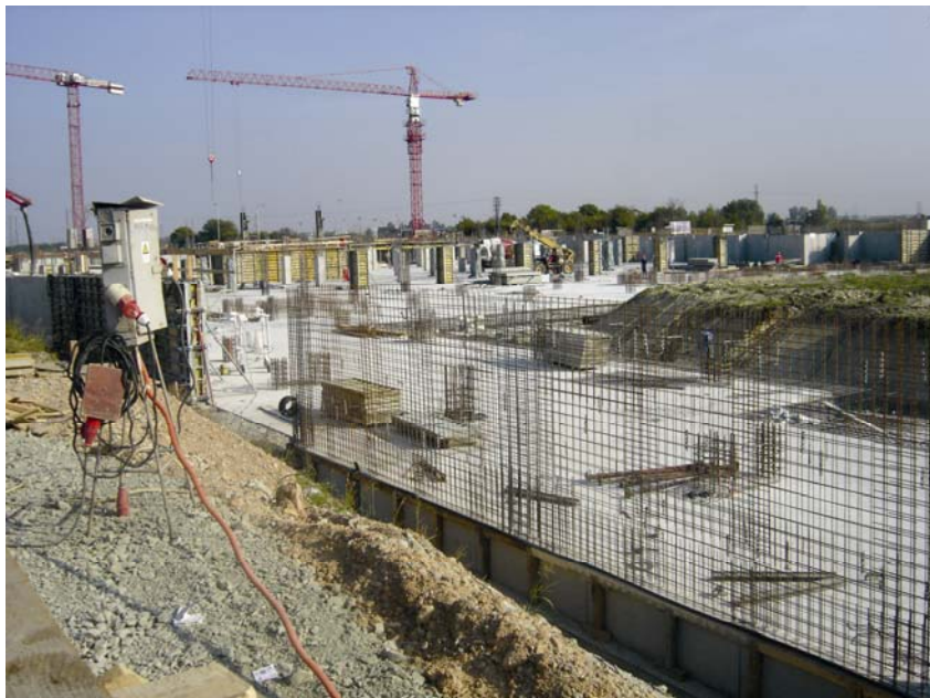
Armiranobetonski radovi u podrumu građevine