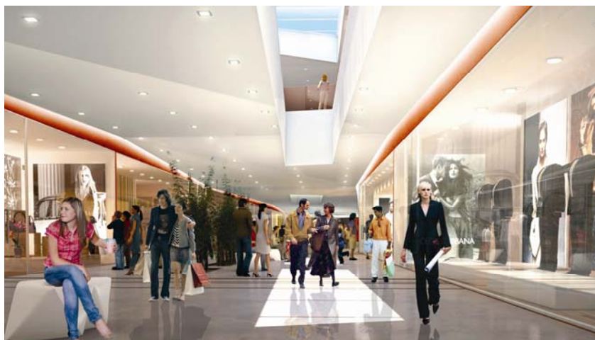
Detalj budućega izgleda interijera novoga centra

Čini se da unatoč svim sadašnjim gospodarskim teškoćama novi poslovno-trgovački centar prema ozra-