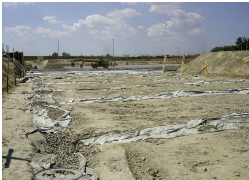
Gradevna jama prije početka betonskih radova