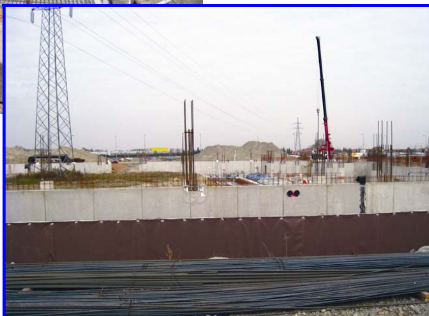
Izvođenja radova u blizini stupa dalekovoda