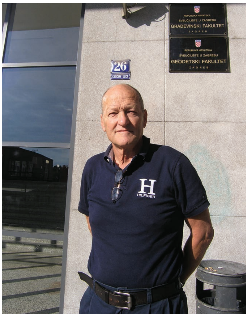
Prof. Nenad Bićanić snimljen ispred matičnog fakulteta u Zagrebu 2015. za posljednjeg razgovora za Građevinar

nije do kraja hidratirao. Nenad je radio kompletnu računsku analizu "unatrag", što je uključivalo faze montaže, procjene i provjere toga kada se što dogodilo, odnosno u kojoj fazi, određivanje uzroka određenog oštećenja te procjene varijanti oštećenja. U tome postupku primijenjena je i nelinearna termomehanička analiza.