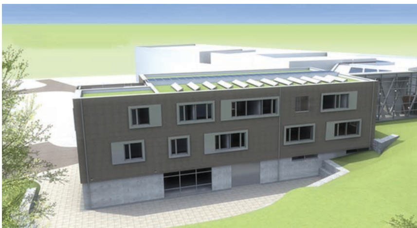
Model buduće zgrade Neobuilda

rijala i ispitati učinkovitost korištenja obnovljivih izvora energije. Svrha je građevine poboljšati ili promijeniti nedostatke novih materijala, sklopova i tehnologija na temelju korisničkih iskustava, i to prije nego li se lansiraju na tržište, kako bi se spriječile pogreške i gubici te zaštitili kupci.