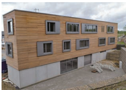
Detalji s gradilišta