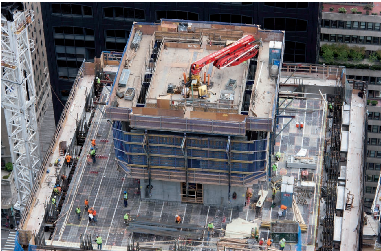
Detalj s gradilišta

Općenito je jedna od bitnih karakteristika urbanog razvoja New Yorka, osobito u zadnjih stotinjak i više godina, konstantna smjena zgrada. Pritom je, kako piše arhitektonski kritičar Paul Goldberger, tridesetih godina prošloga stoljeća jednu kvalitetnu zgradu zamjenjivala druga kvalitetna zgrada, no do sredine 20. stoljeća to više nije bio slučaj.