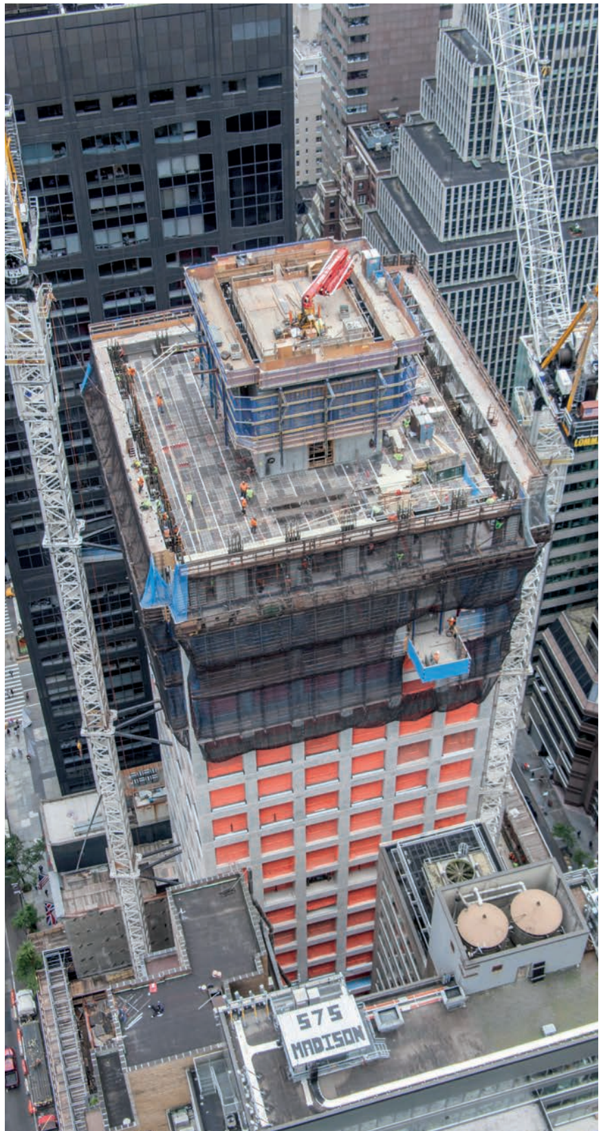
Gradilište je zbog velike izgrađenosti moralo biti jako usko

www.doka.com/en/news/press/432-Park-Avenue--New-York