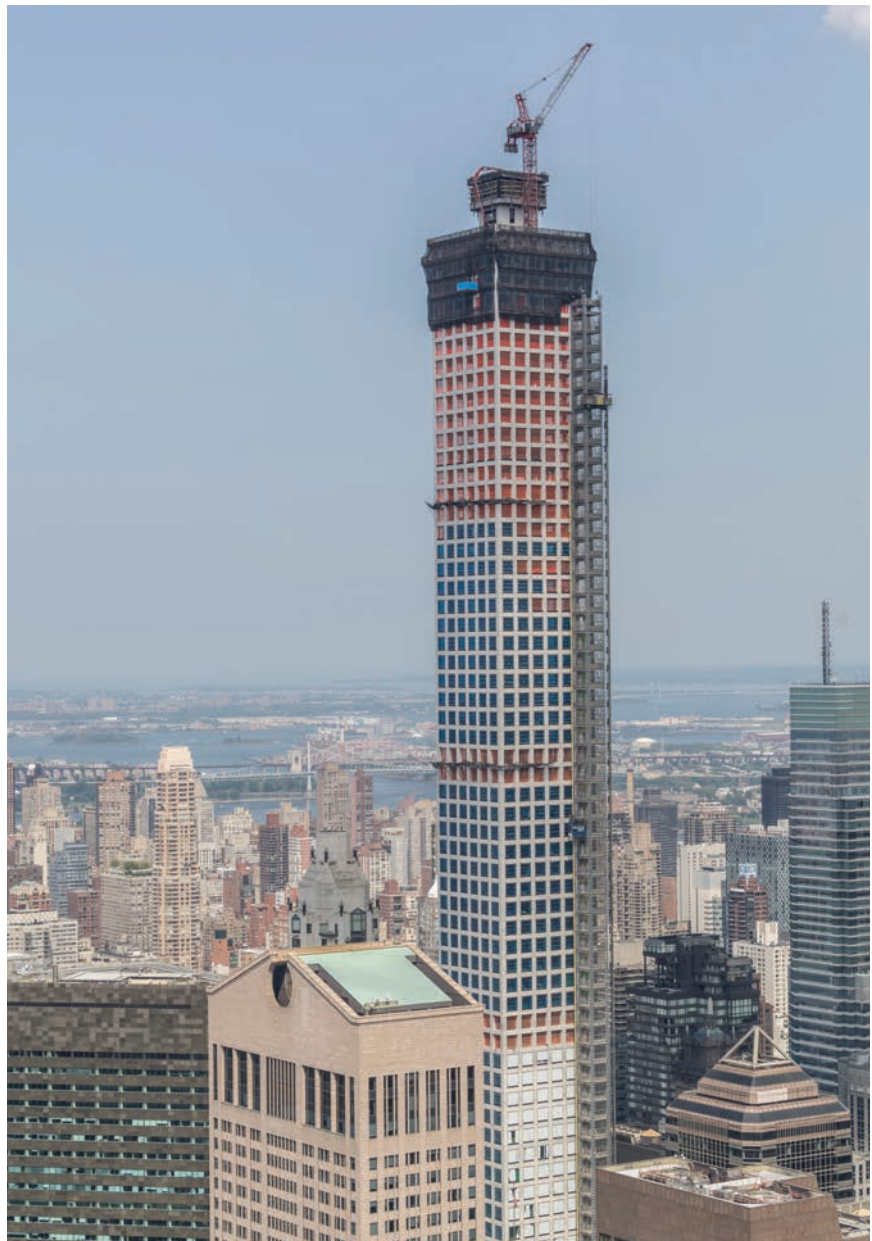
Pogled na gotovo završen neboder 432 Park Avenue

jako uski 111 West 57th Street . Neki od planiranih nebodera u tome dijelu Manhattana visinom će nadmašiti sve one koji su do sada ondje izgrađeni, što samo potvrđuje da titula najviših u 21. stoljeću vrlo brzo mijenja titulara.