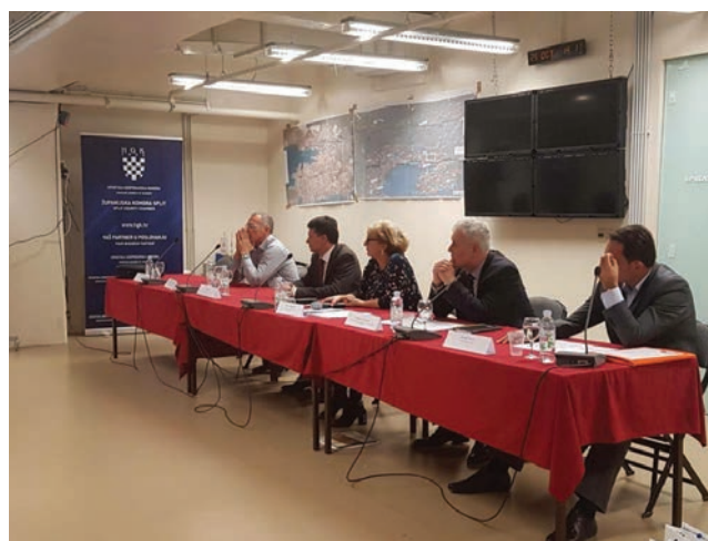
Sudionici okruglog stola "Problem prometne povezanosti Splita"