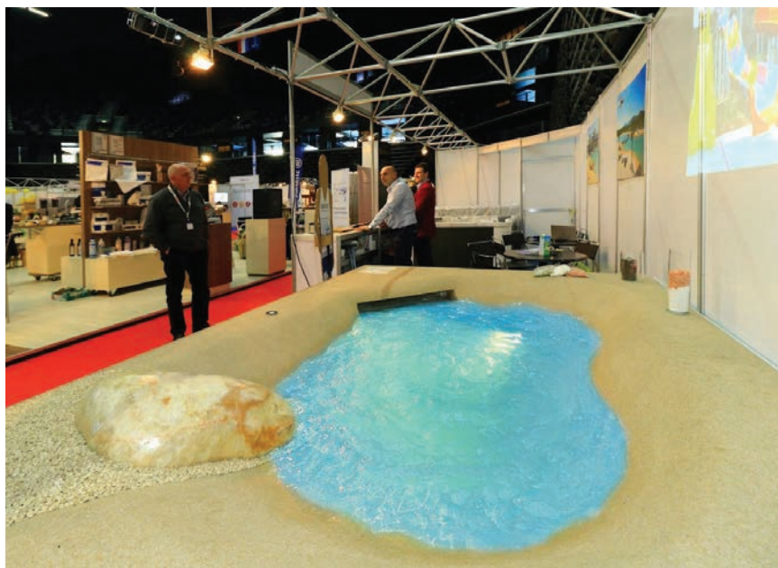
Sajamski novitet bila je bazenska tehnika

Procjenjuje se to da vrijednost sklopljenih poslova na sajmu SASO iznosi približno 119 milijuna eura, što je još jedna potvrda toga da se sajmovi nakon svjetske gospodarske krize, bilježeći kontinuirani rast posljednjih godina, vraćaju na mjesto koje im pripada te ponovno postaju nezaobilazna mjesta susreta gospodarstvenika i sklapanja unosnih poslova. Također je potvrđeno to da, unatoč razvoju komunikacijskih tehnologija, osobni kontakt i razgovor ništa ne može zamijeniti.