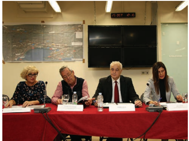
Okrugli stol "Nedostatak radne snage u građevinskom sektoru"

daljnje planiranje i razvoj grada Splita. Crnjak je, među ostalim, bio koordinator i jedan od voditelja te studije. Istaknuo je to kako probleme u prometu treba rješavati sinergijski, a ne "granski", odnosno kao pojedinačne pothvate u prostoru. Studijom je zamišljen dugoročni koncept razvitka primarne cestovno-željezničke infrastrukture šireg okruženja grada Splita (Trogir – čvorište Progmet – Dugopolje – Podstrana). Problem je Splita problem svih velikih gradova u Republici Hrvatskoj. Crnjak smatra kako problemi nastaju zbog činjenice što se prometne studije izrađuju prije prostornog plana pa se u prostornome planu definiraju praktično svi detalji, a potom inženjeri projekte moraju prilagoditi prometnome planu, što je veliki apsurd.