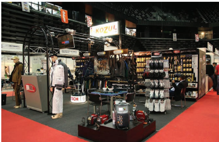
Detalj izložbenog prostora na sajmu

dostatak radne snage u građevinskom sektoru".