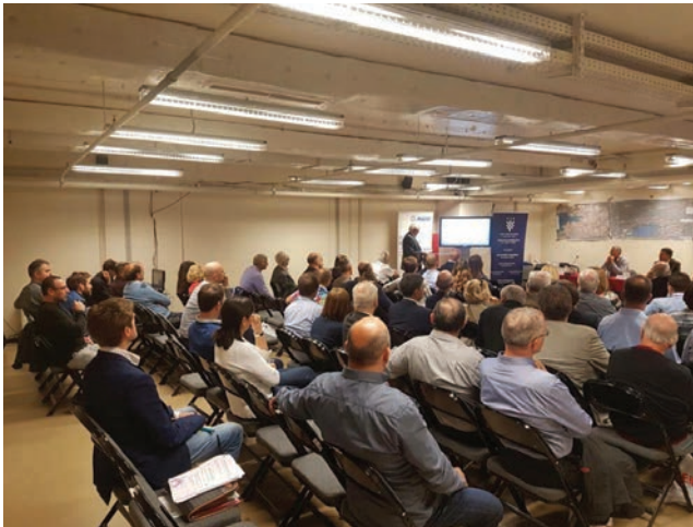
Izlaganje o prostorno-prometnoj studiji koju je izradio Institut IGH