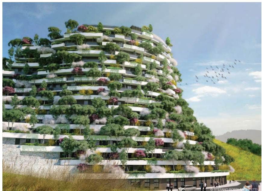
Pogled na hotel u šumskom gradu

The Forest City, čija je gradnja započela u lipnju 2017. prostirat će se na približno 175 hektara površine, a kada bude dovršen, u gradu će živjeti približno 30.000 stanovnika. Zahvaljujući mnoštvu drveća i zelenila apsorbirat će 10.000 tona ugljičnog dioksida godišnje, a istovremeno proizvoditi 900 tona kisika. Taj grad to će moći postići zahvaljujući milijunu biljaka i 40 tisuća stabala, koja će se zasaditi na fasadama gotovo svake vanjske