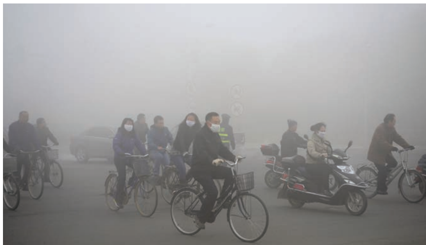
Velike količine smoga ključan su problem kineskih gradova

U Peking, glavnom kineskom gradu, u kojem živi oko 17,4 milijuna stanovnika, zrak je izuzetno onečišćen, pa se tamošnjim stanovnicima preporuča da prilikom izlaska iz svojih domova koriste zaštitne maske za lice