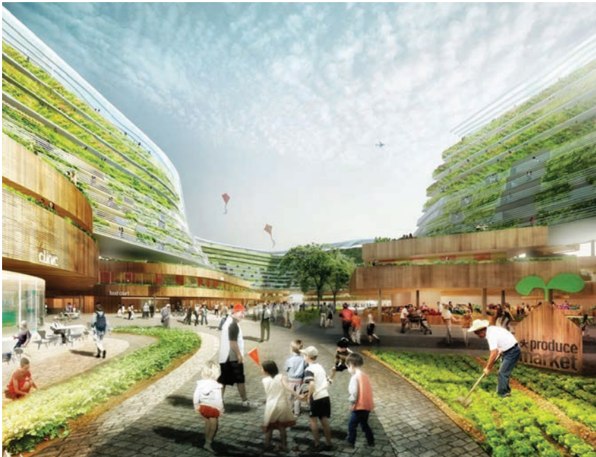
Vizualizacija šetnice u novom gradu

ste hotela. Vrtove će krasiti više od 1100 stabala i 2500 biljki penjačica. Zelenilo će prekriti površinu veću od 6000 m 2 . Biljke će na godišnjoj razini apsorbirati 25 tona ugljičnog dioksida, a istovremeno proizvesti 60 kilograma kisika dnevno. Završetak gradnje tih ekoloških nebodera očekuje se 2018. godine.