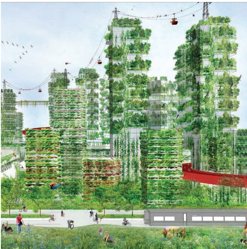
Projektno rješenje tkz. vertikalne šume

građenu višekatnicu na svijetu. Prestižnu nagradu 2015. dobili su projektanti iz studija Stefano Boeri Architects za osmišljeni i izvedeni koncept vertikalne šume, a dodijeljen im je i LEED zlatni certifikat. Inače, LEED (engl. Leadership in Energy and Environmental Design ) program certificiranja zelenih zgrada procjenjuje niz čimbenika, i to od lokacije preko utjecaja na okoliš, primjene modernih recikliranih materijala i opreme, manje energetske potrošnje i emisije CO 2 do kvalitete interijera i za posjetitelje i za osoblje. Ubrzo je koncept vertikalne šume postao ikonom suvremene arhitekture.