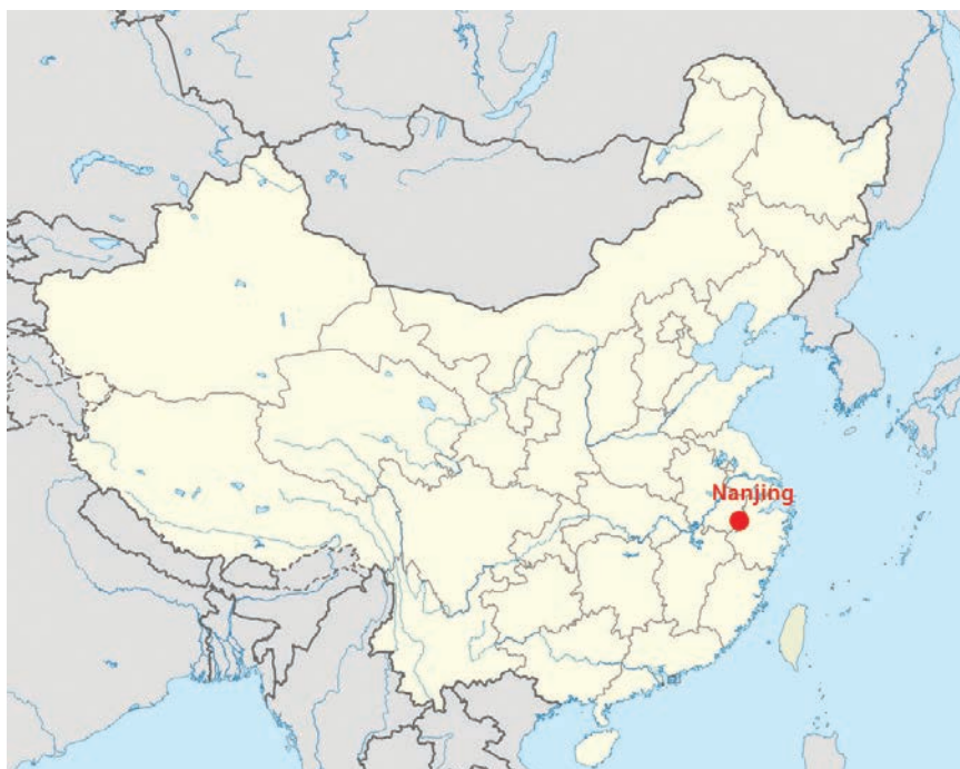
Položaj Nianjiga na zemljovidu

Novo, 40-megavatno postrojenje smješteno je u bivšem rudarskom gradu Huanianu, u provinciji Anhui, a gradila ga je kompanija Sungrow Power Supply Co. Kineska vlada fokusirana je na povećanju