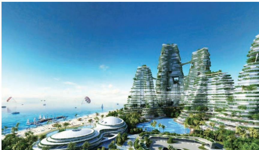
Šumoviti gradovi mogli bi postati koncept prema kojem će se stvarati gradovi u budućnosti

nja, kompleksnosti cijelog sustava zbog povećanja opterećenja uslijed vjetrova, kao i poteškoće samog drveća u prilagodbi na različite visinske uvjete. Unatoč brojnim nagradama koje je dobio projekt Bosco verticale u Milanu, kritičari su primijetili da iznos sredstava potrebnih za postavljanje i održavanje stabala na vrtovima nebodera daleko nadmašuje njihovu ekološku vrijednost. Neki od njih sma-