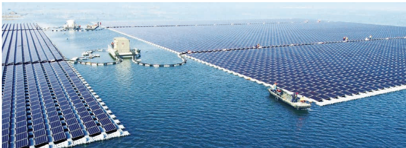
Nova plutajuća solarna elektrana u Huainanu

17,4 milijuna stanovnika, zrak izuzetno onečišćen, a tamošnjim stanovnicima se preporuča da prilikom izlaska iz svojih domova koriste zaštitne maske za lice. Zbog toga je Kina na nacionalnoj razini odlučila napraviti preokret i postati lider u obnovljivim izvorima energije. Kineska vlada pohvalila se početkom lipnja 2017. završetkom gradnje trenutačno najvećeg