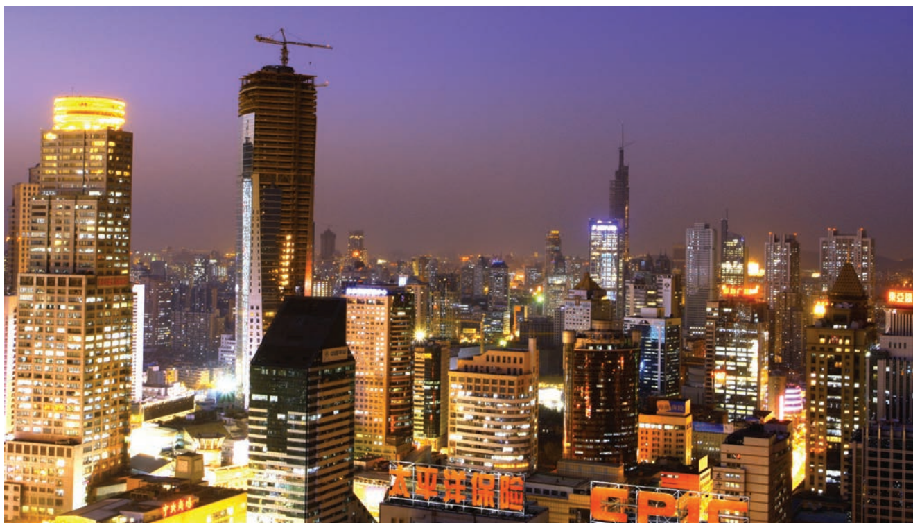
Panorama grada Nanjinga

U nizu mjera koje Kinezi poduzimaju kako bi se nosili s problemom zagađenosti, osim golemih solarnih elektrana, najveću pozornost javnosti je privukla nedavna odluka o gradnji tzv. vertikalnih šuma. Prvi takav projekt u Kini nazvan je "Zeleni neboderi Nanjinga", a grade se dvije