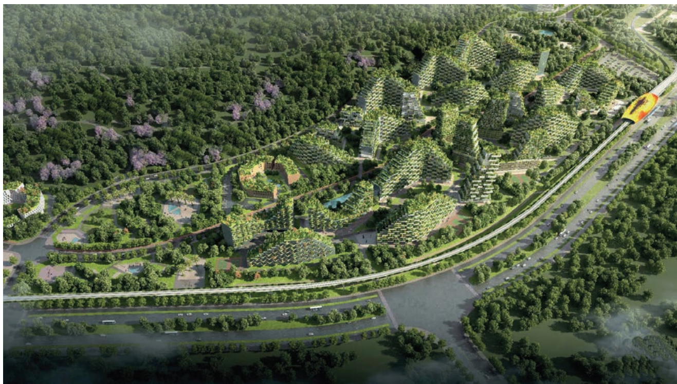
Vizualizacija šumskog grada u Liuzhou

U drugom neboderu, visokom 108 metara, smjestit će se hotel, a 247 soba bit će različitih dimenzija (od 35 do čak 150 m 2 ), dok će na vrhu nebodera bit bazen za go-