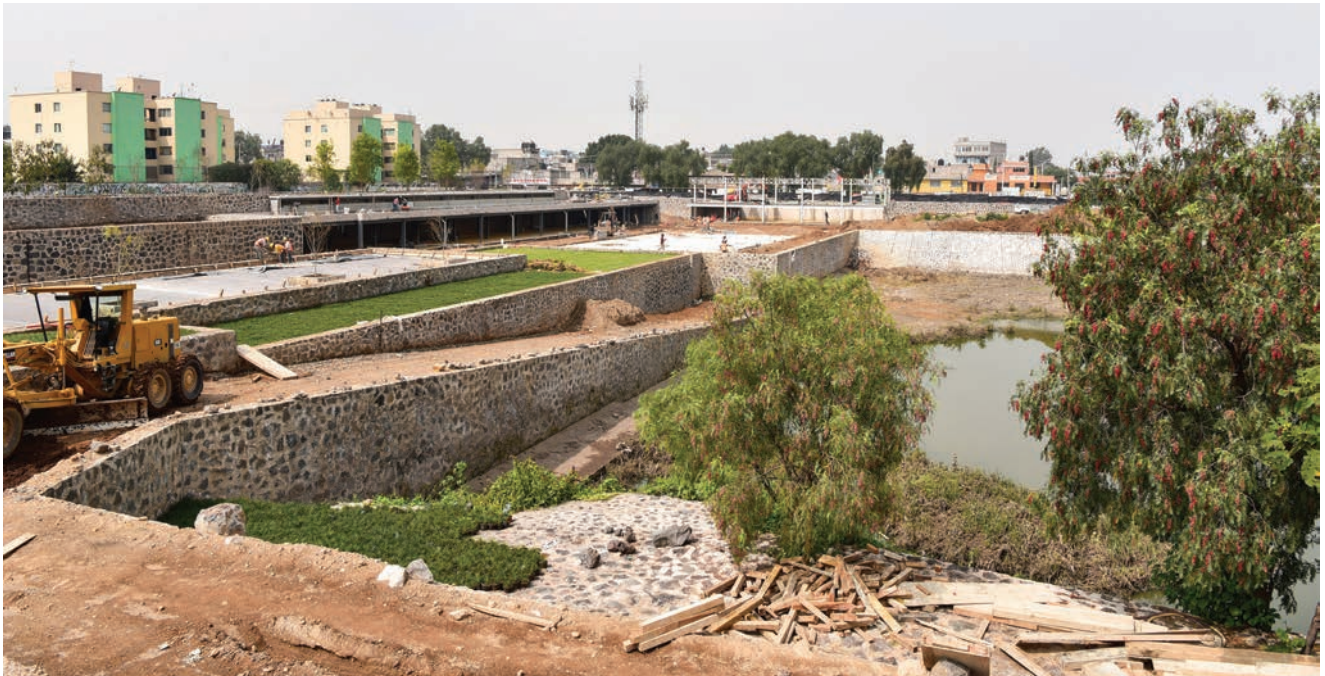
Detalj s gradilišta

za košarku i odbojku te dječje igralište, otvoreno kazalište i knjižnica s kafićem. Potporni zidovi i većina ostalih elemenata u parku izgrađeni su od vulkanskog kamena jer cijelo gradilište leži na vulkanskoj stijeni. U cijeli projekt uloženo je približno 11 milijuna dolara, a projekt su financirali meksička vlada, privatni donatori i lokalna zajednica.