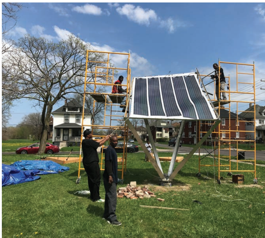
Instalacija fotonaponske tende kojom će se proizvoditi električna energija

nje, restorana, kafića i sportskih dvorana. Sljedeći izazov projektantima bio je kako sve nabrojano uklopiti u jedan koncept i jedan projekt, a da pritom projektno rješenje bude održivo. Holistički pristup planiranju projekta pokazao se vrlo uspješnim jer su projektom omogućena nova radna mjesta, i to ponajprije u području korištenja obnovljivih izvora energije. Koncept Seebaldt Street obuhvaća cijeli