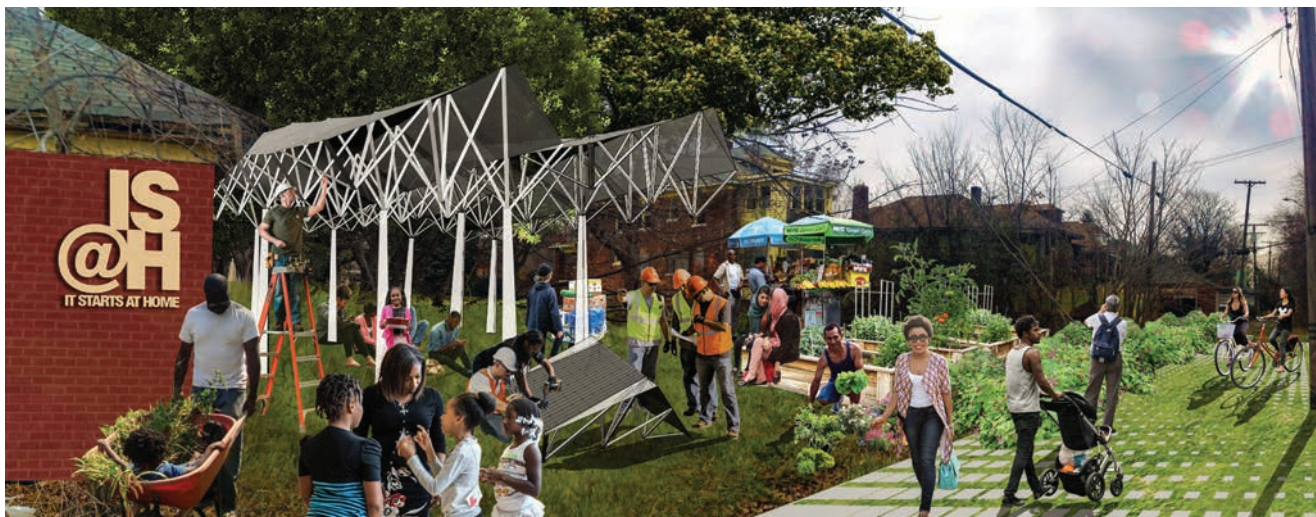
Cilj projekta Seebaldt Street jest stvaranje održivog prostor za zajednicu

počela financijska kriza. Ljudi su masovno napuštali grad. Dijelovi Detroita, njegove istočne četvrti, mogli bi djelovati kao da ih je prije četvrt stoljeća pogodila nuklearna bomba: napuštene kuće zarasle u travu, polupani prozori, uništene crkve, napuštena dječja igrališta i razbijene ulične lampe. Ipak, nisu sve četvrti grada napuštene i uništene u istoj mjeri. Ljudi koji su ondje ostali živjeti vole svoje četvrti i žele ih održavati. U takvim su susjedstvima kuće održavane, okućnice uređene, a ljudi svoju budućnost vide upravo u Detroitu. Ipak, učitelji u obližnjim školama uočili su manjak sportskih i društvenih aktivnosti i zanimanja kao jednog od čimbenika porasta stope kriminala među školskom djecom. Kada mladost nema priliku sudjelovati u smislenim aktivnostima, vrijeme provodi na ulicama Detroita gdje su izloženi nasilju.