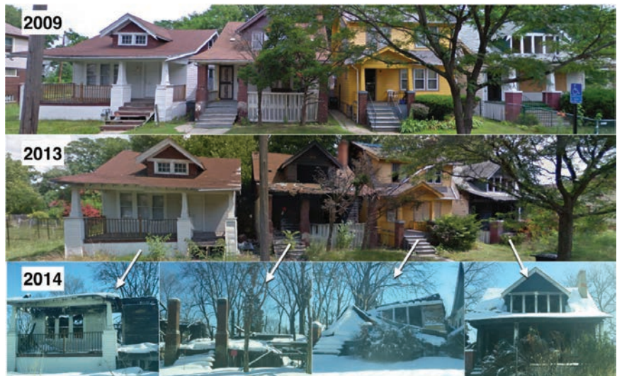
Nakon bankrota Detroita, mnoge su kuće opljačkane, srušene ili zapaljene

Detroit je postao poznat po Henryju Fordu koji je 1903. otvorio tvornicu i usavršio proizvodnu liniju za proizvodnju automobila u gradu. Privukao je desetine