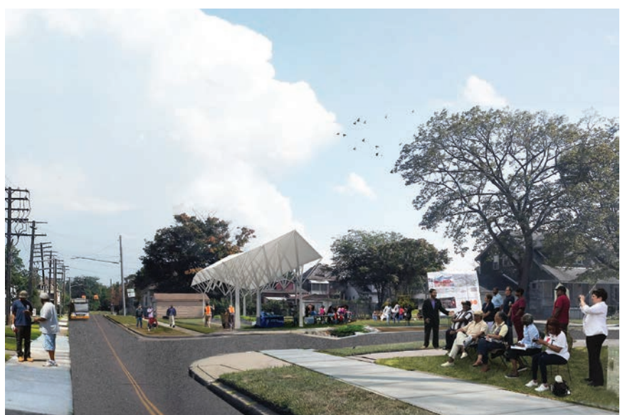
Vizualizacija obnovljenog gradskog bloka Seebaldt Street

Nekada četvrti grad po veličini u SAD-u bankrotirao je kao najveći američki grad koji se ikada našao u toj situaciji. Detroit je propao jer su propale njegove glavne industrije. Automobilski giganti prvo su se našli u krizi kada se proizvodnja preselila na Daleki istok, a potom i kada je