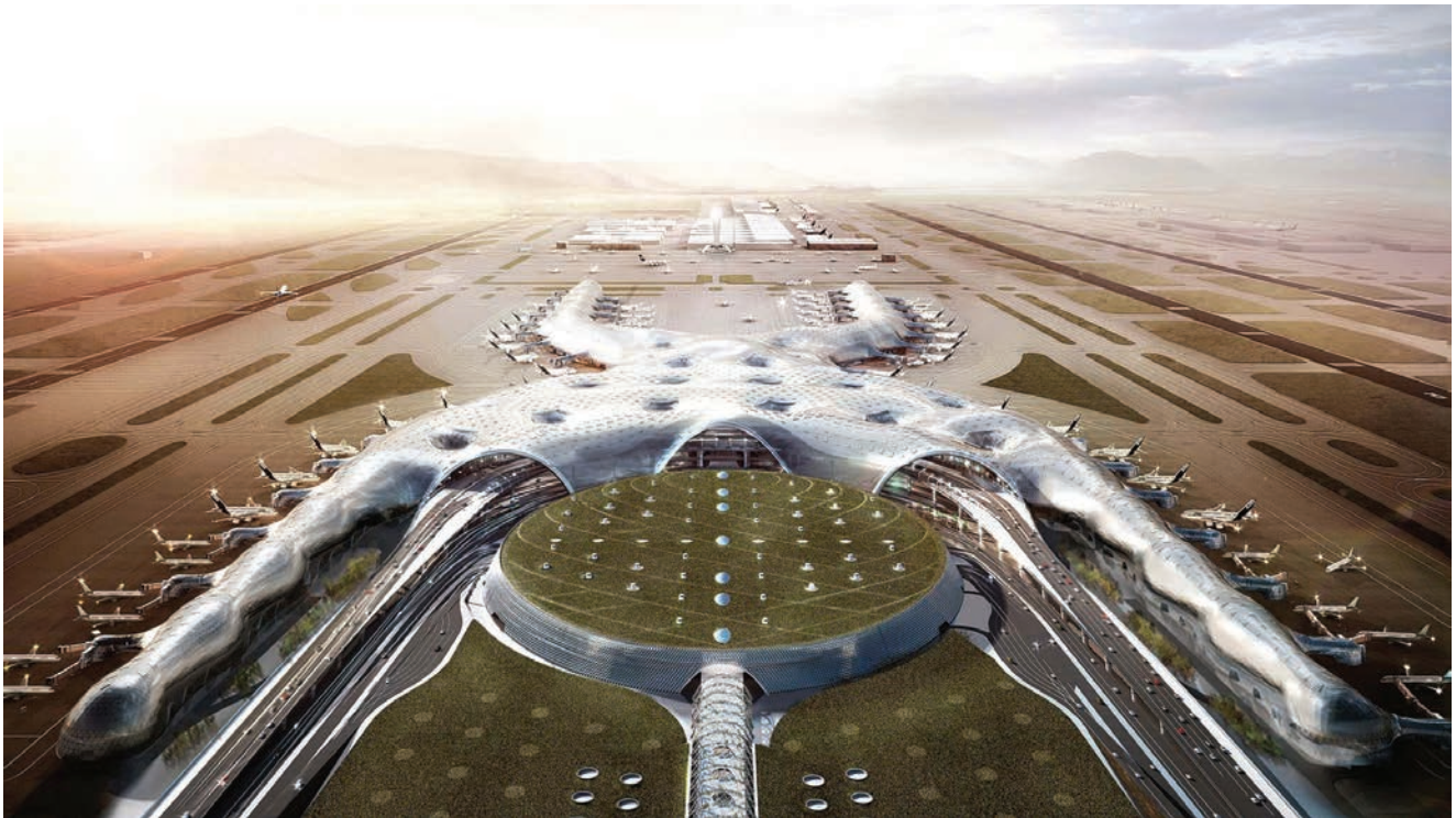
Nova međunarodna zračna luka u Ciudad de Mexico (Foto: Norman Foster)

gradski blok, a temelji se na tri ključne postavke. Stanovnici bloka, ali i novi investitori kupuju odnosno renoviraju svoje kuće koje se mogu pronaći tek za nekoliko stotina dolara jer je cijena nekretnina drastično pala zbog svih problema u kojima se našao Detroit. Nakon renovacije sve će kuće i zgrade biti gotovo nula energetske, grijat će se uz pomoć solarnih panela, a javni prostor bit će namjenjen cijeloj zajednici, bez obzira na dob. U gradskome bloku smještene su 34 kuće, među kojima je njih 11 napušteno. Prema američkim zakonima, kuće koje su dulje napuštene postaju vlasništvo grada. I te će kuće biti obnovljene, a potom ponuđene zainteresiranim kupcima. Zbog korištenja obnovljivih izvora energije drastično će se smanjiti računi za grijanje i električnu energiju, i to čak do 60 posto. Projektom je predviđena i gradnja lokalne "farme" u kojoj će se proizvoditi hrana.