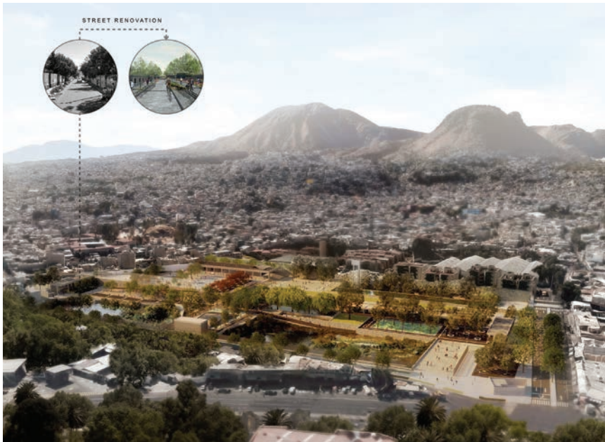
Vizualizacija parka La Quebradora Hydraulic Park

Autónoma de México osmislio je projekt vodne infrastrukture za kojim je žudila istočna periferija glavnog grada Meksika. Projekt nazvan La Quebradora Hydraulic Park trenutno je pri kraju izgradnje, a s njegovim dovršetkom kroz zeleni pojas znatno će se poboljšati uvjeti u (pre)napučenoj gradskoj sredini.