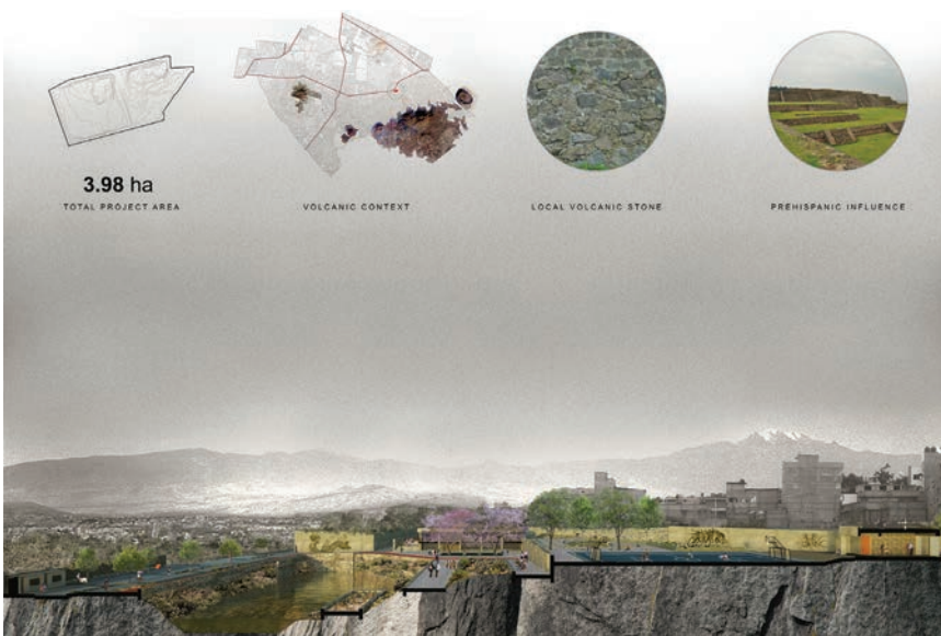
Park se gradi na vulkanskoj stijeni

Projekt religioznog i obrazovnog kompleksa u Nigeru potiče obrazovanje djece i žena te jačanje njihove prisutnosti u zajednici