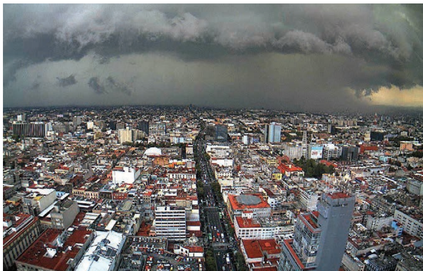
Cuidad de Mexico se svake godine bori s poplavama koje uzrokuju jake kiše