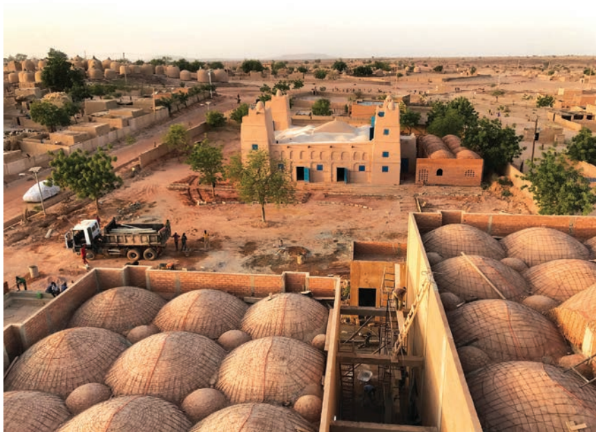
Projekt religioznog i obrazovnog kompleksa u Nigeru

Gotovo polovina svjetskog stanovništva, a velika većina odnosi se na stanovnike afričkih država, živi s oko dva američka dolara na dan. Posao u tim krajevima ne jamči bijeg iz siromaštva. Taj spor i neujednačen napredak zahtijeva ponovno promišljanje i moderniziranje ekonomskih i socijalnih politika usmjerenih na iskorjenjivanje siromaštva.