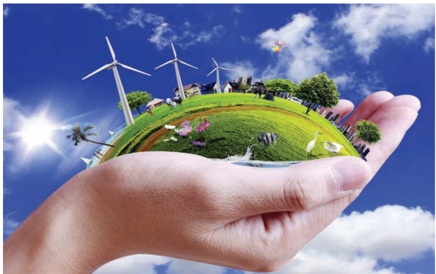
Održivi razvoj postaje imperativ poslovnog svijeta

Današnji su globalni ciljevi održivog razvoja univerzalni i moraju biti primijenjivi u svim zemljama i zajednicama. U njihovoj provedbi u obzir treba uzeti specifične prilike, uvjete i mogućnosti na različitim dijelovima planeta. Treba prepoznati pri-