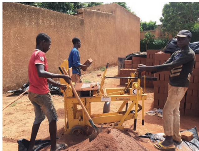
Za gradnju kompleksa korištena je opeka proizvedena na licu mjesta