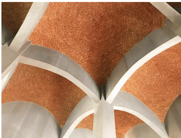
Pogled na unutrašnjost kupole

Nova građevina interpretira stari izgled džamije, ali uz primjenu suvremenih materijala i tehnika. Vanjski je prostor