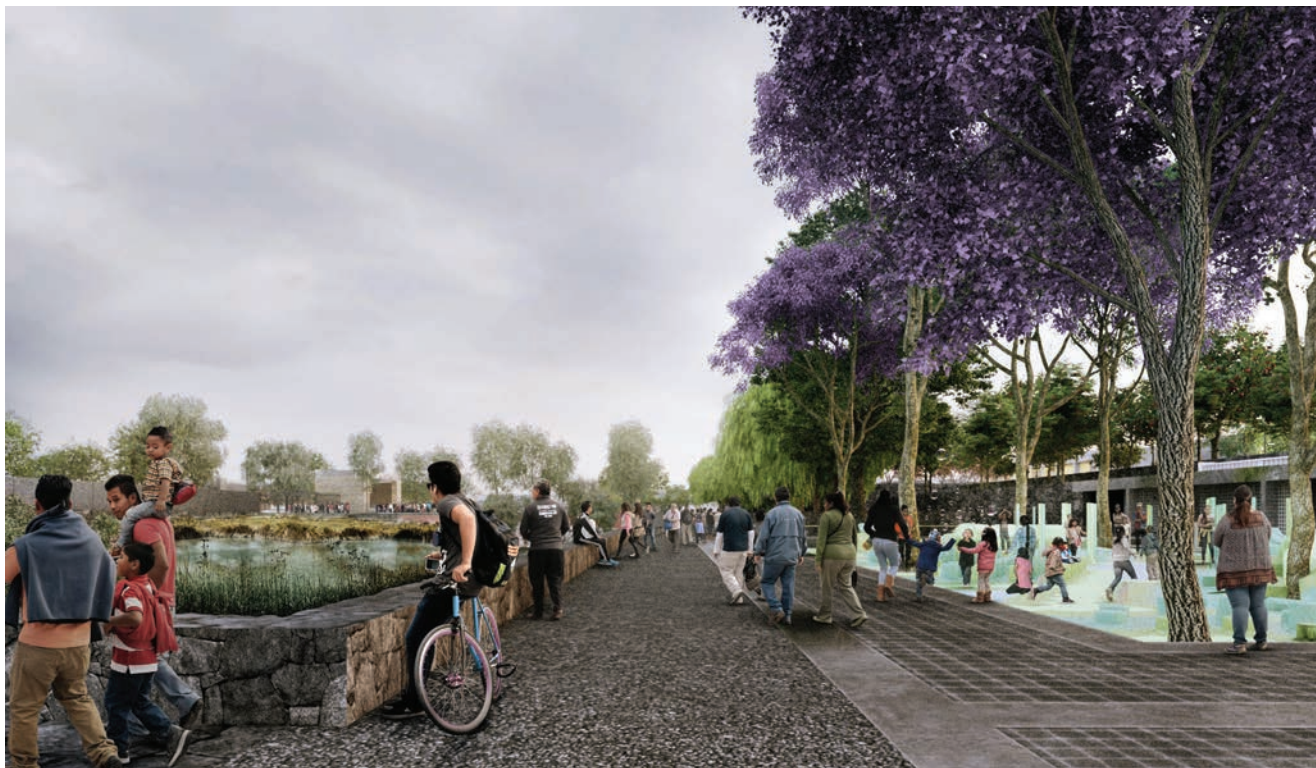
Park je namijenjen za rekreaciju, sport i društvene aktivnosti

da se njegovo rješenje može primijeniti u napućenoj gradskoj sredini koja vapi za pitkom vodom. S približno dva milijuna stanovnika Iztapalapa je najveća četvrt u Ciudadu de Mexico. U toj četvrti voda iz slavine nije uvijek dostupna, izrazito je loše kvalitete i nije preporučljiva za piće. Takva je situacija postala i financijsko opterećenje za građane jer gotovo trećina ljudi kupuje flaširanu vodu za piće i za to izdvaja i do 20 posto svojih prihoda.