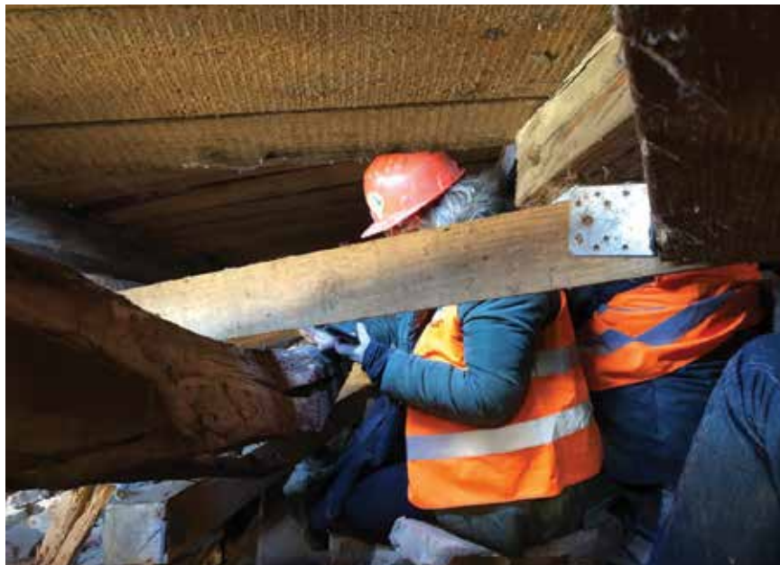
Tim inženjera volontera ostao je zatočen ispod urušenog krova

vinskih stručnjaka volontera nalazila se u oštećenim zgradama kako bi utvrdila uporabivost zgrada. Jedan tim inženjera volontera ostao je zatočen među porušenim zidovima, urušenim krovom i stropovima. Kako bi ih izvukli iz ruševina, intervencijske službe uskočile su im u pomoć. Nažalost, dvoje inženjera teže je ozlijeđeno.