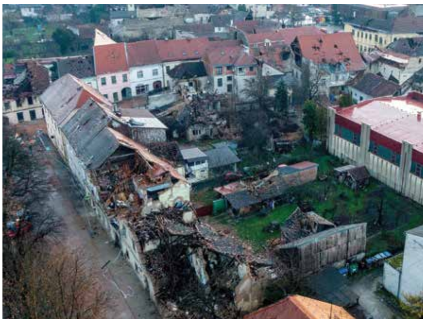
Uništeno središte Petrinje

Razorni potres magnitude 6,2 stupnja prema Richteru pogodio je Sisačko-moslavačku županiju 29. prosinca 2020. u 12 sati i 19 minuta