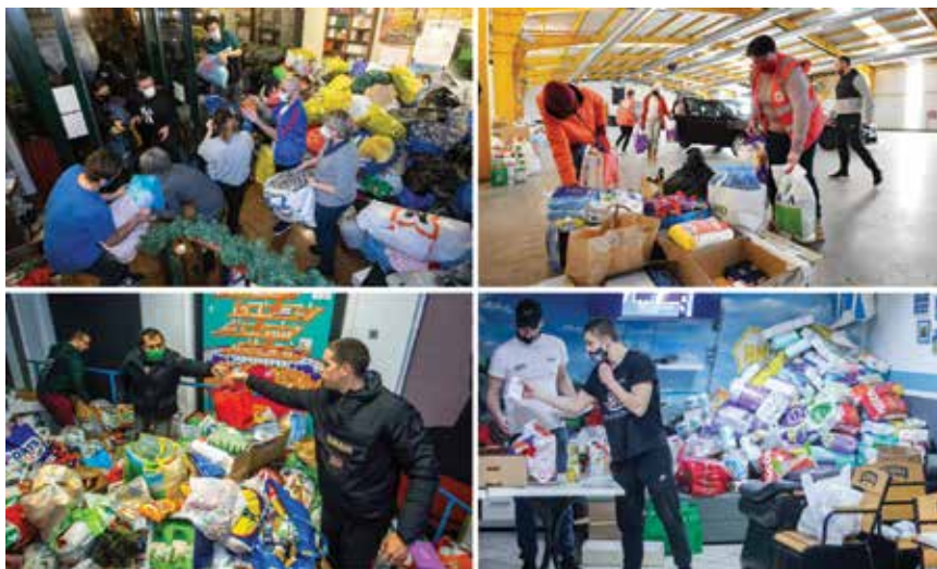
Humanitarna pomoć iz cijele Hrvatske i inozemstva dosegly nezabilježene razmjere