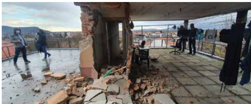
Velika šteta na višestambenoj zgradi u središtu Zaprešića

Od približno 43.000 prijavljenih zahtjeva do 1. veljače 2021. pregledano je više od 25.000 građevina. Iza svima poznatih crvenih, žutih i zelenih naljepnica koje kategoriziraju posljedice potresa opsežan je popis unesenih podataka. Zapažanja na terenu svjedoče o tome da je većina oštećenih zgrada sagrađena od nearmiranoga ziđa i opeka koje su izgubile svoj-