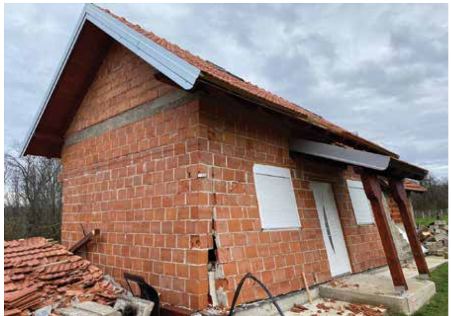
Razorni potres upozorava na iznimnu važnost sigurne i kvalitetne gradnje zgrada

Uz pomoć Vlade RH i Europske unije te međunarodnih i privatnih donacija uništene kuće sigurno će jednoga dana biti obnovljene, no povjerenje stanovnika zanemarenih i zaboravljenih pod-