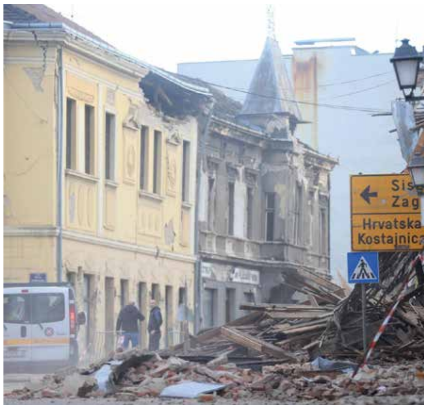
Obnova Banovine nakon bit će težak i dugotrajan proces

ručja Hrvatske neće pripasti političarima, već običnim ljudima volonterima. Katastrofalni potres, nažalost, opet je skrenuo pozornost na činjenicu da se u Hrvatskoj godinama sustavno zanemario aspekt potresne sigurnosti te da se nisu uzimala u obzir upozorenja građevinske struke na moguće posljedice potresa, ali ni to da na trusnome području nije samo Zagreb, nego cijela Hrvatska. Na potresnoj karti Republike Hrvatske gradovi Sisak i Petrinja označeni su kao zeleno područje, no siloviti potres pokazao je da se tlo mijenja, a nitko ne zna kada će se dogoditi novo podrhtavanje tla, ni kakve će biti njegove posljedice.