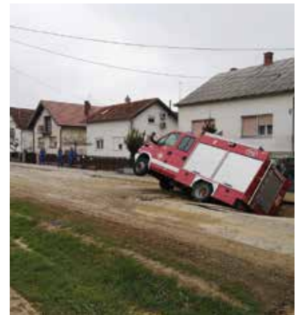
Pojavom likvefakcije tlo gubi čvrstoću te prelazi u tekuće ili polutekuće stanje

Likvefakcija tla jest pojava koja nastaje tijekom potresa na pjeskovitome tlu zasićenome vodom, pri čemu tlo gubi čvrstoću i nosivost, pritom prelazeći u tekuće ili polutekuće stanje. Može uzrokovati znatna oštećenja objekata zbog gubitka nosivosti, odnosno "nestajanja" tla ispod temelja građevina.