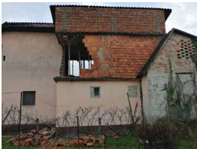
Većina oštećenih zgrada sagrađena je od nearmiranoga ziđa i opeka ( Autori: Ž. Jembrih, D. Milišić, N. Rebronja)

za preglede, uključeni su u mrežnu ( WhatsApp ) grupu inženjera te im je omogućen pristup važnim informacijama (lokacije HCPI-ovih stožera, materijali za edukaciju, koraci koje treba proći prije izlaska na teren i slično).