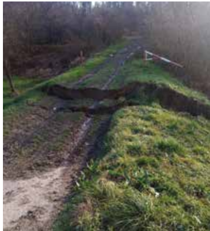
Rasjed snimljen u okolici Petrinje

U Sloveniji zgrade su oštećene na nekoliko područja, uglavnom u blizini slovensko-hrvatske granice. Ljudi su prijavili oštećenja fasada, krovova i dimnjaka u jugoistočnim gradovima Krškom, Brežicama i starome gradu Kostanjevici na Krki. Nuklearna elektrana Krško automatski je zatvorena, a poslije je sustavno pregledana, no nije bila prijavljena nikakva šteta. U sjeveroistočnoj Sloveniji nestalo je struje i bile su