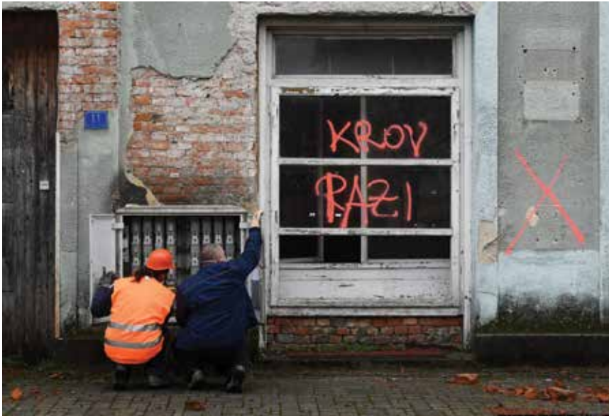
Središte Gline pretrpjelo je značajna oštećenja

le trošenjem zelenih magmatskih stijena (vjerojatno bazalta) te crvenih i tamnosivih klastičnih i karbonatnih stijena (vjerojatno krednih i paleocenskih sedimentnih stijena) koje su rijekom Sunjom i njezinim okolnim pritocima donesene s vršnoga dijela Zrinske gore (gdje su te vrste stijena otkrivene na površini) u poplavnu ravnicu rijeke Sunje, na područje sela Mečenčana.