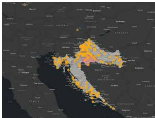
Pozivu za pomoć odazvali su se inženjeri iz cijele Hrvatske

U financijskome obliku ili humanitarnim pošiljkama brzo su pomogle i zemlje jugoistoka Europe: Albanija, Bosna i Hercegovina, Crna Gora, Sjeverna Makedonija, Srbija i Turska, ali i druge države iz svih krajeva svijeta poput Kanade, Kine, Ukrajine, Južne Koreje i SAD-a. Hrvatski iseljenici diljem svijeta pokazali su iznimnu nesebičnost te su kroz svoje udruge, hrvatske katoličke misije i župne zajednice i tom prigodom, kao i nebrojeno puta dosad, spremno pomogli domovini u teškim trenucima. Solidarnost s Hrvatskom također su pokazale međunarodne organizacije poput UNICEF-a i UNHCR-a te brojni drugi međunarodni partneri, strani ulagači, tvrtke i udruge građana.