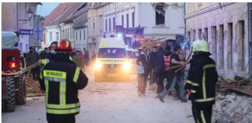
Sve hitne službe u rekordnom su roku započele evakuaciju stanovništva

Sve žurne službe, vatrogasci, hitna pomoć, policija i Hrvatska vojska, su uz dodatnu pomoć volontera Crvenoga križa, Hrvatske gorske službe spašavanja, građevinskih stručnjaka okupljenih oko Hrvatskoga centra za potresno inženjerstvo te alpinista, speleologa i visinaca, navijačkih i drugih skupina koje su se samoinicijativno organizirale u rekordnome roku izišle na teren te počele evakuirati stanovnike i čistiti blokirane ulice i ceste na koje su padali dijelovi fasada, krovova i dimnjaka. Građani iz svih dijelova Hrvatske počeli su organizirati akcije prikupljanja pomoći koje su dosegly nezabilježene razmjere. Ujedinila se cijela Hrvatska. Pomoć je bila prikupljena u rekordnome roku te je počela stizati u razorena područja iz svakoga kutka domovine. Kamp-kućice i kontejneri za privremeni smještaj stradalnika stizali su uglavnom zahvaljujući