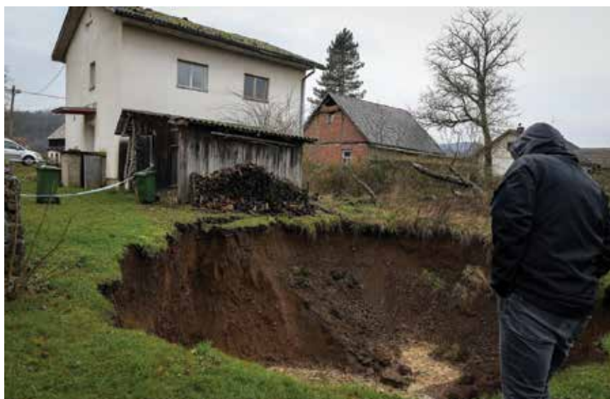
Nakon potresne trešnje, na pogođenom području zabilježene su urušne vrtače

procesu likvefakcije. Razlog jest uobičajeno veća poroznost (količina šupljina u volumenu tla) nego kod sitnozrnastih tala. U slučaju da je takav materijal gotovo potpuno ispunjen vodom prilikom udara seizmičkoga vala može doći do potpunoga gubitka posmične čvrstoće tla. Čestice tla tada se počinju slobodno kretati u vodi te se tlo ponaša kao gusta tekućina. Do sada su utvrđene ukupno 32 zone zahvaćene likvefakcijom. Posljedice toga fenomena očituju se kroz tonjenje i naginjane građevina na likvefiranome zemljištu, pojavu pukotina na površini tla, bočno razmicanje tla, pojavu klizišta, izbacivanje vode i pijeska te formiranje