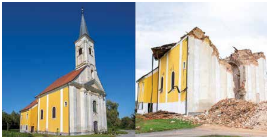
Crkva Sv. Nikole i Sv. Vida u Žažini prije i nakon potresa

oštećenih građevina Hrvatska komora inženjera građevinarstva sklopila je ugovor o životnome osiguranju za sve ovlaštene inženjere građevinarstva (volontere) koji sudjeluju u žurnim pregledima zgrada oštećenih potresom te ponudila pokrivanje troškova smještaja za one članove kojima je potreban.