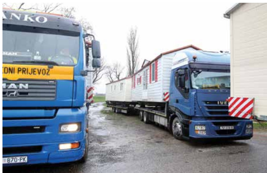
Hrvatskome zahtjevu za žurnom materijalnom pomoći odazvale su se brojne države diljem svijeta

svjetiljkama, električnim grijačima, sklopivim krevetima i vrećama za spavanje odazvalo se odmah 15 država članica Europske unije i Mehanizma unije za civilnu zaštitu. U prvim danima nakon potresa kopnenim, morskim i zračnim putem pomoć je stigla iz Austrije, Poljske, Bugarske, Češke, Finske, Francuske, Grčke, Italije, Litve, Mađarske, Njemačke, Portugala, Rumunjske, Slovačke i Slovenije.