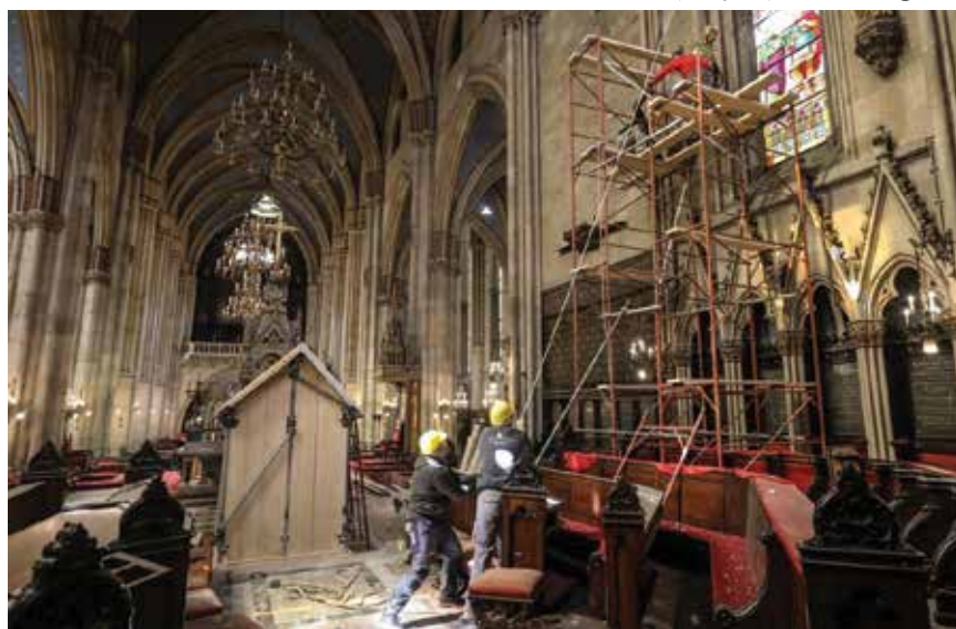
Oštećenja na zagrebačkoj katedrali dodatno su se povećala nakon potresa kod Petrinje

Materijalna šteta prijavljena je u Sisačko-moslavačkoj županiji, ali i u Zagrebu