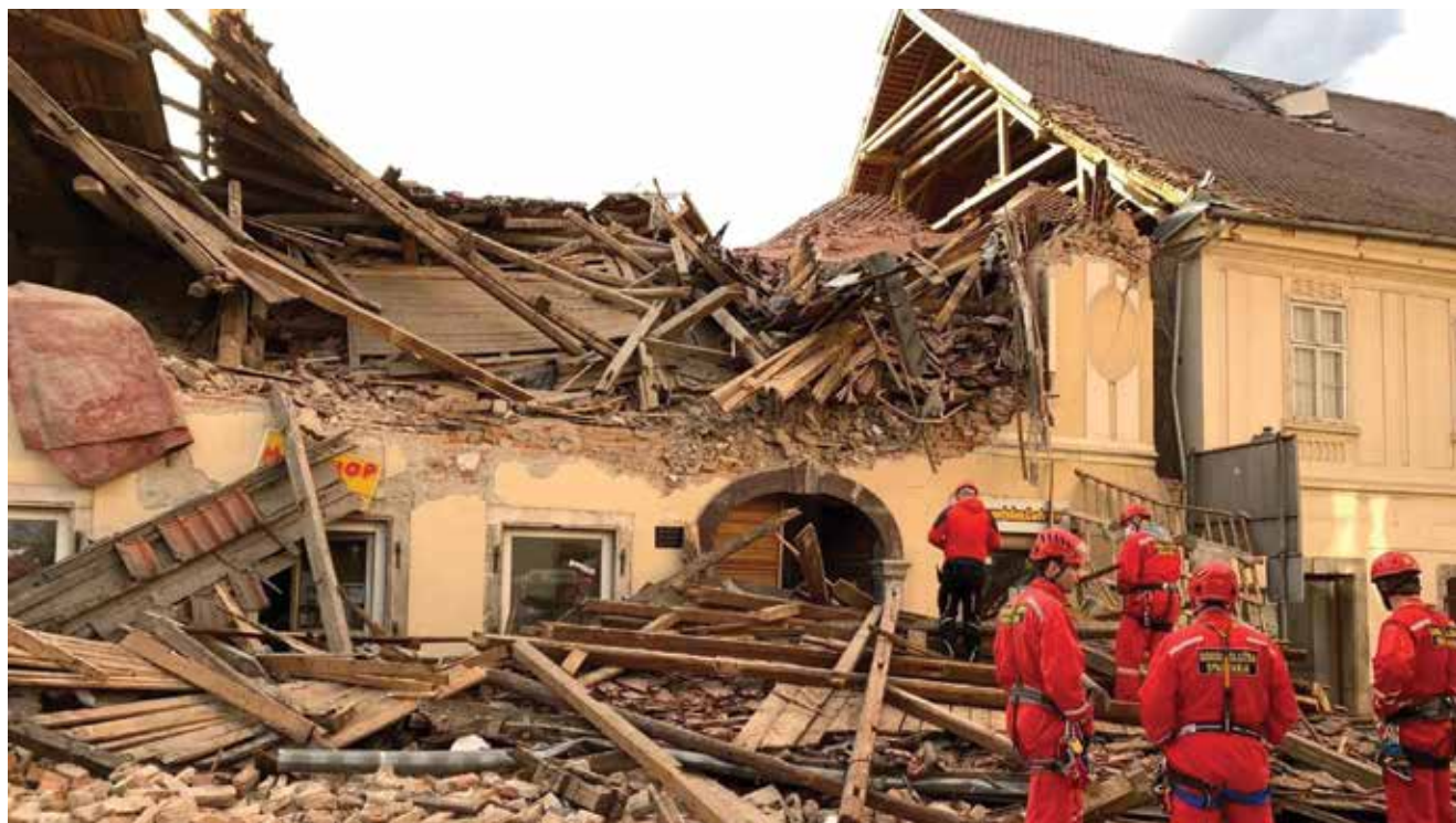
Zbog razornog potresa Vlada RH je proglasila katastrofu na pogođenom području

dobrim ljudima i tvrtkama koji su ih donirali.