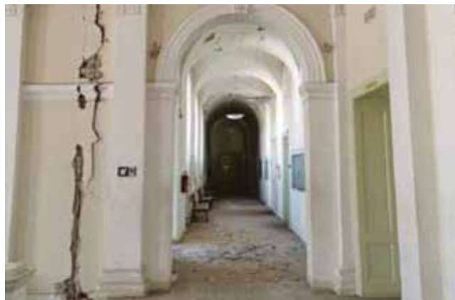
Oštećenja zgrade Pravnoga fakulteta

Dobivena financijska sredstva za obnovu infrastrukture 24 visokoškolskih i znanstvenih ustanova pogođenih potresom u ukupnome iznosu nešto većem od dvije milijarde kuna je velika prilika za podizanje standarda jer su sredstva namijenjena za cjelovitu obnovu građevina. Jedan dio sredstava predviđen je iz Fonda solidarnosti Europske unije dok je drugi dio predviđen iz Nacionalnog programa oporavka i optpronosti. U razgovoru s dekanom Građevinskoga fakulteta Sveučilišta u Zagrebu Prof.dr.sc. Stjepanom Lakušićem, saznali smo da su znanstvene ustanove veliki napor uložile u izradu projektnih prijedloga kako bi se izradila što preciznija procjena troškova cjelovite obnove te će vjerojatno kod same obnove doći do potrebe za dodatnim sredstvima. Naime, u projektnom prijedlogu su predviđeni svi troškovi, od izrade projektno-tehničke dokumentacije do vrijednosti radova cjelovite obnove. S obzirom da neke zgrade nisu imale Detaljni pregled i Elaborat ocjene postojećeg stanja čime se sagledava stabilnost i mehanička otpornost nosive konstrukcije zgrade s obzirom na