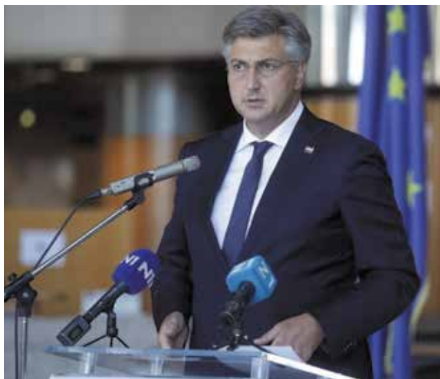
Sudionicima se obratio Andrej Plenković, predsjednik Vlade RH