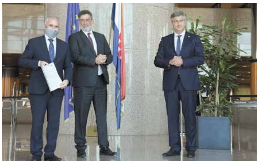
Dekan Građevinskog fakulteta prof. Stjepan Lakušić s ministrom znanosti i obrazovanja Radovanom Fuchsom i predsjednikom Vlade Andrejem Plenkovićem

potresa koji su u 2020. uzdrmali Hrvatsku, ponovimo kako je u trenutku kada su se dogodili potresi jedino akademska zajednica bila spremna preuzeti cijeli rizik i pokazati na koji način treba postaviti sustav brzih pregleda i koji se podaci moraju prikupljati kako bi se mogli koristiti u provedbi daljnjih koraka (procjena štete, razine obnove, donošenje Zakona o obnovi i drugo). Kao primjer treba spomenuti dokument Brza procjena šteta i potreba (Rapid Damage and Needs Assessment - RDNA) na temelju kojega je Hrvatska povukla 680 milijuna eura iz Fonda solidarnosti Europske unije, a koji su najvećim dijelom izradili stručnjaci s Građevinskoga fakulteta na temelju podataka koji su prikupljeni tijekom brzih pregleda te