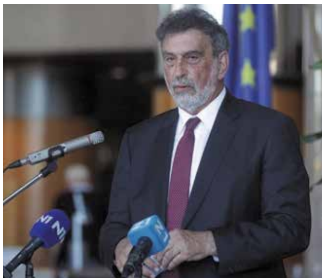
i ministar znanosti i obrazovanja Radovan Fuchs

i navedene smjernice sastavni su dio Zakona o potresu, izrađen je dokument Croatia Earthquake – Rapid damage and needs Assessment 2020 na temelju kojega je Hrvatska ostvarila pravo na sredstva iz EU-ova fonda solidarnosti, izrađen je priručnik Urgentni program potresne obnove , a u završnoj je fazi knjiga Potresno inženjerstvo – obnova zidanih zgrada , koja je objavljena kao sveučilišna monografija.