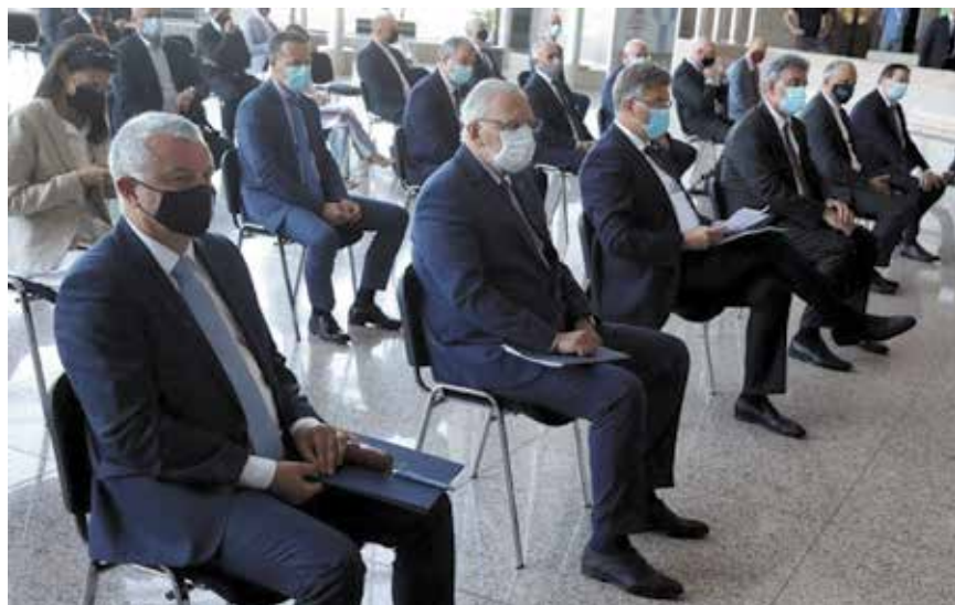
Dio sudionika skupa