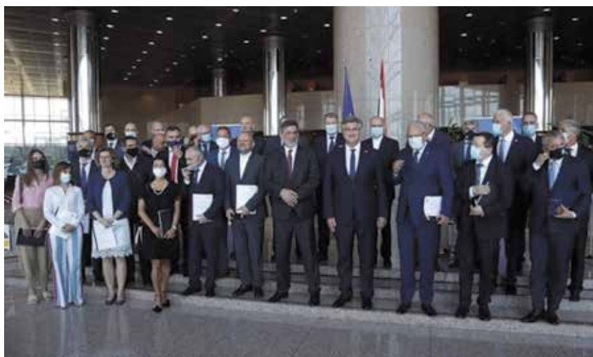
Potpisnici ugovora o dodjeli sredstava za obnovu s predsjednikom Vlade Andrejem Plenkovićem i ministarom znanosti i obrazovanja Radovanom Fuchsom

Iako smo već pisali o uključivanju akademske zajednice u aktivnosti nakon