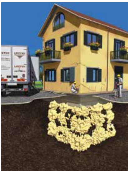
Tehnologija Deep Injections (duboko injektiranje) prvi se put pojavila na tržištu 1996.

Velika opterećenja na hrvatskim autocestama uzrokuju brojna oštećenja kolničke konstrukcije kao što su kolotrazi i pukotine. Takva su oštećenja opasnost za vozače i vozila. Zbog toga se izvode sanacije asfaltnoga zastora, odnosno habajućega i veznoga asfaltnog sloja, a po potrebi i nosivoga sloja. Oštećeni se slojevi uklanjaju, a novi ugrađuju. Tehnologija Uretek, koja je dostupna na hrvatskome tržištu, omogućuje neinvazivnu sanaciju nosivih slojeva konstrukcije, brži popravak oštećenih dijelova autocesta, a ne zahtijeva kopanje, rušenje ni potpuno zaustavljanje prometa na dionicima koje su u rekonstrukciji.