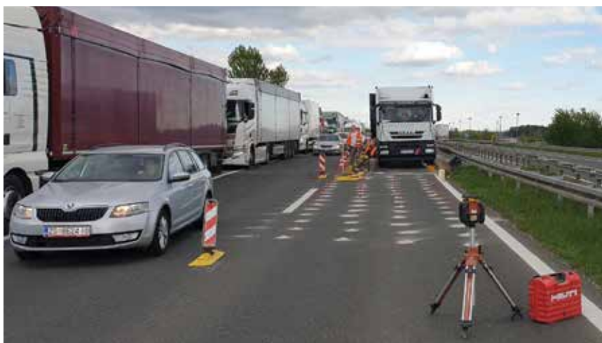
Radovi na sanaciji mosta Gradna obavljani su bez potrebe zatvaranja prometa

TAUS d.o.o Uretek Hrvatska E-adresa: info@uretek.hr Tel: 01/33 77 007