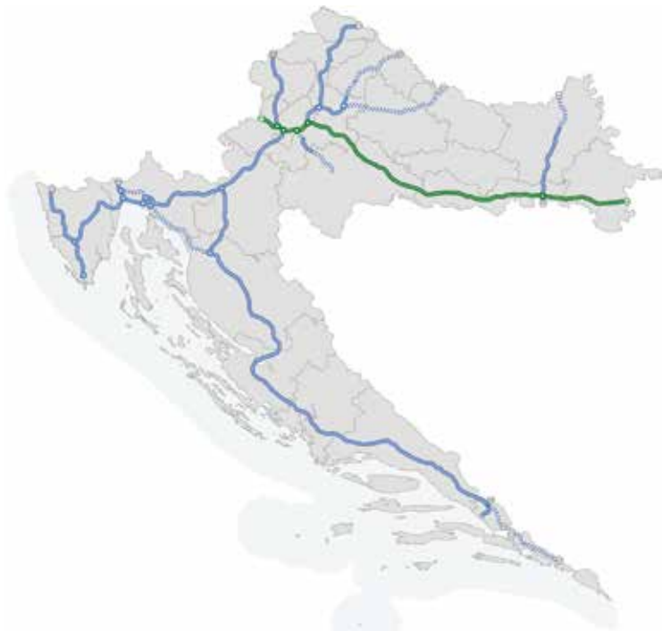
Položaj autoceste A3 na karti Republike Hrvatske (označena zelenom bojom)

Walls Restoring ® za rekonstrukciju do-trajaloga vezivnog sredstva u zidanim građevinama. Od 2006. na tržištu je dostupna i metoda Cavity Filling ®, koja rješava problem potpunoga popunjavanja i stabilizacije podzemnih šupljina. Uretek je 2008. dobio Certifikat sustava upravljanja kvalitetom ISO 9001:2000 (br. 50 100 7969) za projektiranje i izvođenje zahvata ojačanja temeljnoga tla dubinskim injektiranjem ekspanzivnih smola. Danas je Uretek dio međunarodne grupe koja posluje u više od 30 zemalja svijeta. U stalnom je procesu rasta, ima bogato iskustvo te je neprestano okrenut istraživanjima čija je svrha ponuditi uslugu koja će najbolje odgovoriti na potrebe klijenta. U ovome prilogu prikazana je inovativna tehnologija Uretek , i to na primjeru sanacije mosta Gradna koja se trenutno izvodi na dionici autoceste A3.