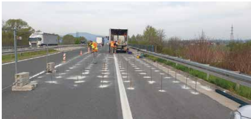
Pripreme za sanaciju dijela prometnice na mostu Gradna