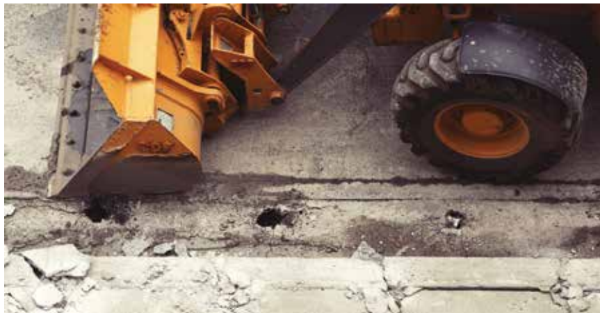
Najveći izazovi su kašnjenja u provedbi projekata, prekoračenja troškova i nedostatak koordinacije između EU-a i članica

Europska unija trenutačno je suočena s nezapamćenom situacijom zbog nužnosti istodobne apsorpcije brojnih izvora financiranja. Kao odgovor na krizu uzrokovanu bolešću COVID-19 Komisija je 27. svibnja 2020. predložila privremeni instrument za oporavak NextGeneratio-