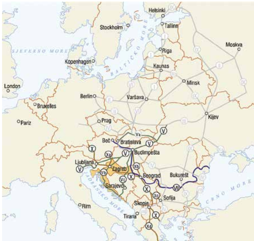
Hrvatska je uključena u četiri od devet koridora