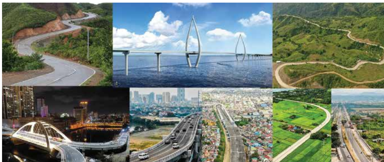
Potreban je bolji nadzor i praćenje infrastrukturnih projekata

Za Republiku Hrvatsku ta je rezolucija važna ponajprije jer su u njoj kao prioritet prepoznati pravci koji spajaju dvije ili više država poput spoja Istarskog ipsilona na slovensku mrežu autocesta ili spoja Za-