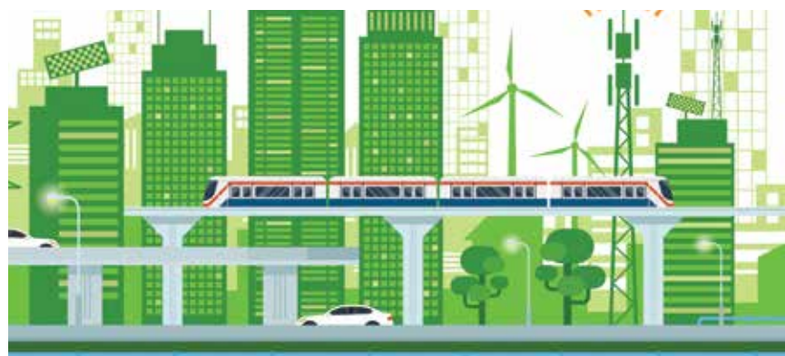
Treba ubrzati dekarbonizaciju i modernizaciju cijeloga sustava prometa i mobilnosti u EU

https://erticonetwork.com/wp-content/uploads/2020/05/2018_shutterstock_green-city_sustainability.jpg