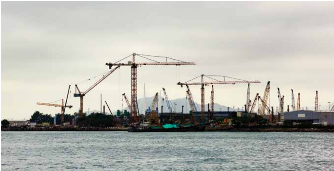
Cilj europske prometne politike jest eliminirati uska grla i poboljšati povezivost među regijama

kapaciteta željeznica velikih brzina i nova potpora Europske investicijske banke za ulaganje u željeznicu, uz opći cilj postizanja nulte neto stope emisija iz Europskoga zelenog plana. To bi trebalo doprinijeti rastu opsega unutarnjeg tržišta i otvaranju radnih mjesta te istodobno ostvarivati ciljeve u vezi sa zaštitom okoliša i održivim razvojem.