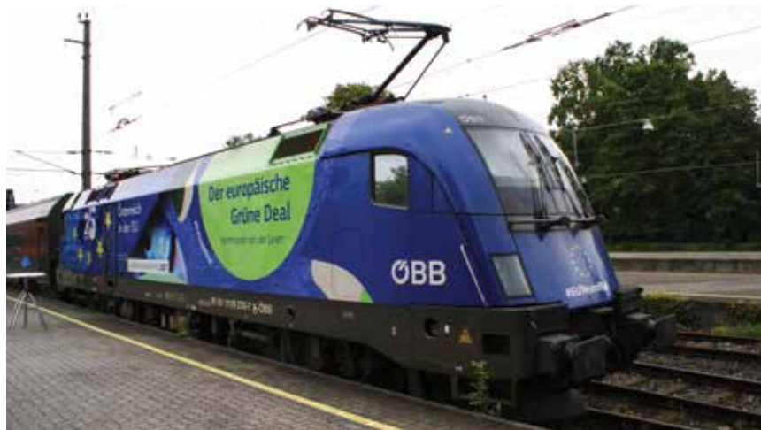
Smjernicama za razvoj TEN-T mreže podupiru se ciljevi Europskog zelenog plana

TEN-T mreže. Naime, u skladu s Uredbom o smjernicama Unije za razvoj transeuropske prometne mreže od 11. prosinca 2013. godine i Instrumentu za povezivanje Europe za prometnu, energetska i informacijsko-komunikacijsku infrastrukturu (engl. Connecting Europe Facility – CEF ), odlučeno je da se TEN-T treba razvijati na temelju dvoslojnog pristupa, sastojeći se od sveobuhvatne i osnovne mreže. Europska komisija je 14. prosinca 2021. usvojila reviziju smjernica. Tim prijedlogom Uredbe predviđene su promjene u odnosu na Uredbu iz 2013. te je