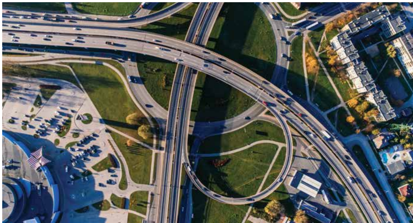
Stvaranje TEN-T mreže zahtijeva provedbu tisuća infrastrukturnih projekata

Budući da je riječ o golemome poduhvatu koji se provodi desetljećima, Europska komisija prati napredak razvoja TEN-T mreže te pristupa reviziji planova njezine provedbe. Krajem 2013. došlo je do korjenite reforme