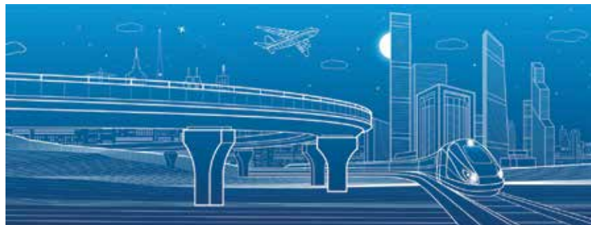
EU poziva na tijesno usklađivanje strateških prioriteta EU-a i država članica

između EU-a i država članica, uloži europskih koordinatore u infrastrukturnim projektima te proširenju mreže TEN-T uz usklađivanje nacionalnih planova s ciljevima EU-a. Predstavljene su smjernice za unapređenje prometne politike EU-a i infrastrukturnih projekata te je posebno istaknuta važnost povezivanja infrastrukture istočnih i zapadnih država članica kako bi se osigurao uspjeh velikih projekata prometne infrastrukture. Pri tome je Europski parlament jasno istaknuo to da se prometne mreže država članica ne mogu promatrati izolirano jer je europska prometna mreža TEN-T jasno prepoznata kao vizija čije koristi nadilaze izolirano nacionalno djelovanje. Zato Europski parlament poziva na tijesno usklađivanje strateških prioriteta EU-a i država članica.