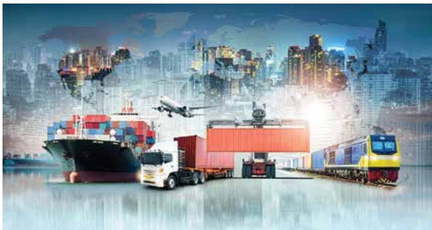
Prometna infrastruktura sufinancira se kombinacijom različitih EU-ovih financijskih instrumenata

Financiranje transeuropskih mreža može se dopuniti sredstvima iz strukturnoga fonda, potporom Europske investicijske