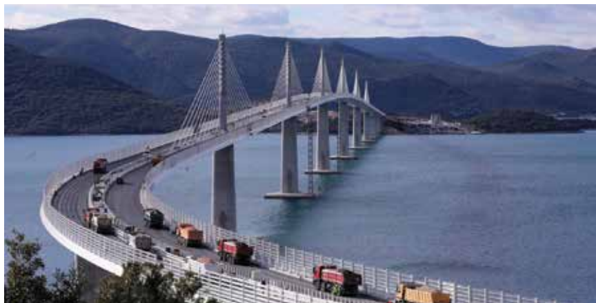
Projekt Cestovna povezanost s južnom Dalmacijom sufinanciran je sredstvima iz EU-a

greb – Maribor – Graz ili spoja Rijeke preko Slovenije do Italije. Takav dugoročan pristup omogućuje neometano izvođenje planiranih dionica u TEN-T koridorima, a Vlada RH treba na vrijeme pripremiti projekte kako bi već 2024. mogla operativno povlačiti financijska sredstva od planiranih 26 milijardi eura koliko je osigurano preko CEF-a. U rezoluciji su također istaknuti dosadašnji uspješni infrastrukturni projekti sufinancirani iz proračuna EU-a među kojima i projekt Cestovna povezanost s južnom Dalmacijom, u koji je uloženo približno 418 milijuna eura, te nadogradnja postojeće željezničke pruge Maribor – Šentilj u Sloveniji, u koji je uloženo 195 milijuna eura.