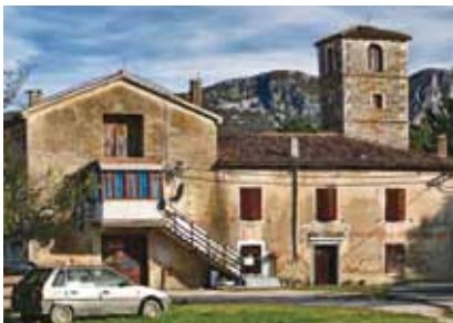
Ostaci pavlinskog samostana u zaselku Kloštar naselja Polje Čepić

svjetovni dio. Taj je dio Čepića nazvan prema "purgerima" (od njem. burger – pripadnik plemstva i građanstva njemačkih slobodnih kraljevskih gradova) koji su uz obale jezera i po okolnim padinama tijekom 15. i 16. st. podigli niz utvrđenih ljetnikovaca.