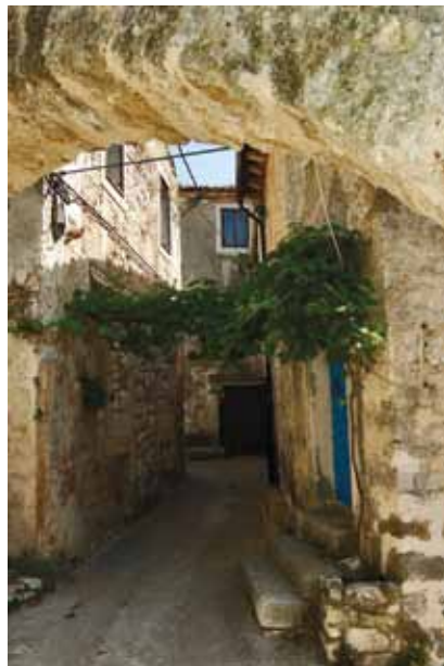
Jedna plominska ulica

renesansnom i zemljom ispunjenom platformom za topove. Gradska je loža manja jednokatna barokna građevina pravokutnog tlocrta, izgrađena 1650. na sjeverozapadnoj strani u produžetku župne crkve. Sastoji se od arkadno otvorenog prizemlja i prostorija na kat.