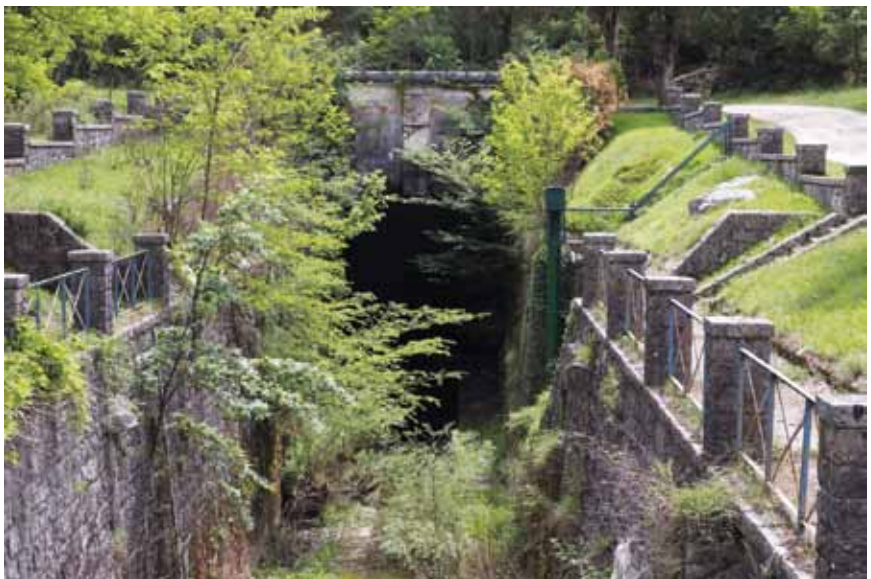
Ulaz u tunel između Kožljaka i Kršana

bilo obraslo trstikom i šašem te bogato ribama (posebno jeguljom i šaranom) i ptičjim vrstama (divlja patka, bijela roda, labudovi i sl.), ali su poslije malarični komarci uzrokovali bolesti i smanjivanje okolnoga stanovništva.