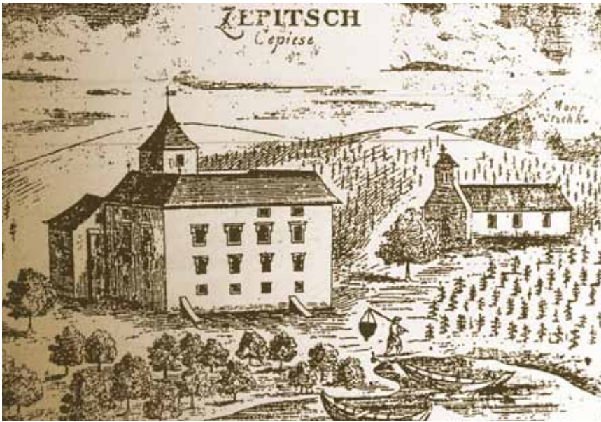
Kaštel u Čepiću na prikazu J. W. Valvasora

svjetovni dio. Taj je dio Čepića nazvan prema "purgerima" (od njem. burger – pripadnik plemstva i građanstva njemačkih slobodnih kraljevskih gradova) koji su uz obale jezera i po okolnim padinama tijekom 15. i 16. st. podigli niz utvrđenih ljetnikovaca.