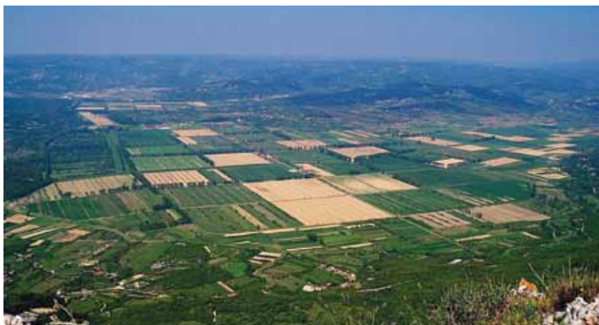
Panoramski snimak Čepičkog polja

djelstvu i stočarstvu. Valja ipak dodati da se u posljednje vrijeme razmišlja o stvaranju novoga manjeg jezera za navodnjavanje na najnižem dijelu polja, na retenciji odnosno rezervnom akumulacijskom prostoru koji služi za obranu od poplava [1].