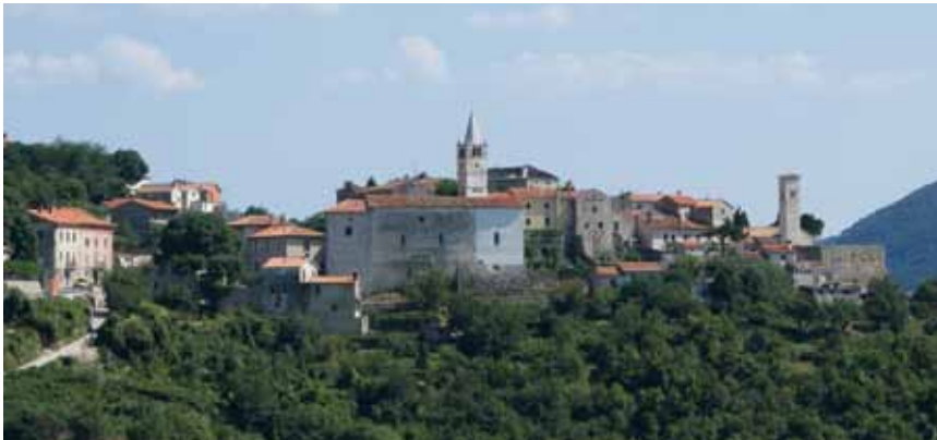
Plomin snimljen sa zapada

naselja svjedoči i prapovijesna gradinska urbanistička struktura koju je preuzelo i srednjovjekovno naselje. Riječ je o tipičnome istarskome srednjovjekovnom gradiću nepravilna elipsoidnog tlocrta koji je opasan srednjovjekovnim (13.-14. st.) i renesansnim (16.-17. st.) obrambenim zidovima. Danas su sačuvani tek manji dijelovi na tri strane gradića, a preostalo je srušeno u 18. i 19. st. ili uklopljeno u okolne stambene kuće. Kroz cijelo naselje vijuga dugačka ulica na koju se spajaju brojni poprečni prolazi i uličice s nizovima renesansnih i baroknih zgrada.