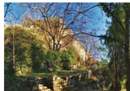
Ruševine kaštela Kožljak

Na zapadnu se stranu gradske jezgre naslanja veliko utvrđeno podgrađe čiji obrambeni zidovi okružuju tri umjetne terase međusobno povezane strmim stubištima. Obrambeni je zid podgrađa najbolje očuvan na donjoj terasi, gdje