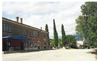
Središte naselja Polje Čepić

Diotalevo iz talijanskoga grada Riminija koja je srušila stari kaštel i na istom mjestu podignula novi. Ipak i taj je kaštel teško stradao u Uskočkom ratu početkom 17. st. pa je temeljito obnovljen u baroknom stilu. Premda su posljednji ostatci kaštela uklonjeni pri isušivanju jezera u tridesetim godinama prošloga stoljeća (kamen je navodno iskorišten za gradnju okolnih cesta i mosta na Raši), izgled mu se može rekonstruirati prema Valvasorovoj veduti iz 1680. kada je bio u vlasništvu obitelji Auer-sperg, gospodara susjednog Kožljaka.