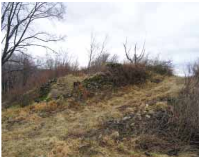
Ostaci beligradskog kaštela

Beligradski je kaštel zapravo veća kula koja je s južne strane bila dobro zaštićena okomitim liticama, dok su je sa sjeverne strane, gdje je pristup najlakši, dodatno štitili troredni prapovijesni bedemi, između kojih su terase s još vidljivim ostatcima kuća i mnogo prapovijesne keramike.