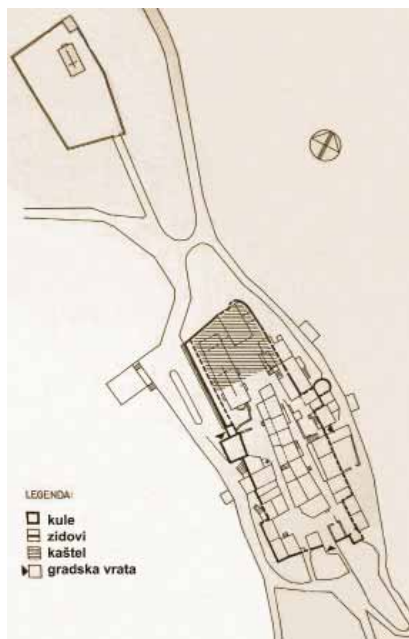
Tlocrt Huma (prema K. Horvat-Levaj)

plemiću Menhardu ili Majnhardu od Epensteina (12. st.). Njegovi će potomci potom nositi pridjevak von Schwarzenburg (Crnogradski), a držali su obje utvrde do 1383. Tada su vlasnici postali Giovanni Turrini i njegov brat Isacc, a potom i nećak Dujam iz Rijeke. Što se potom s kaštelima događalo ostaje nepoznanica. Pretpostavlja se da su do 1420. stradali u sukobima Mletačke Republike i akvilejske crkve. Od Črnigrada i Beligrada ostale su te tek jedva uočljive ruševine [3, 6, 9, 10].