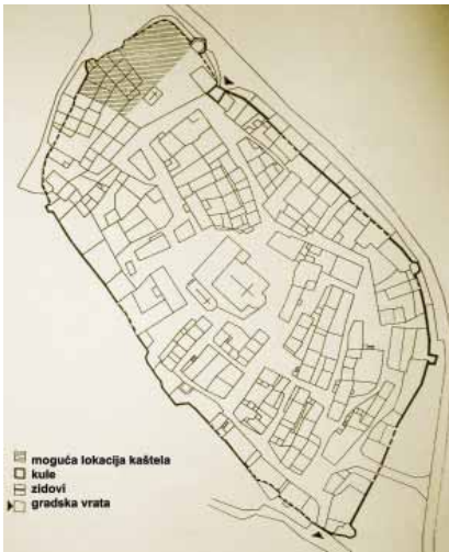
Sadašnji tlocrt Roča (prema K. Horvat-Levaj)

luotok stanovnici su napustili područje današnjega Rima i ponovno se preselili na brežuljak gdje su podigli novo i vjerojatno utvrđeno naselje.