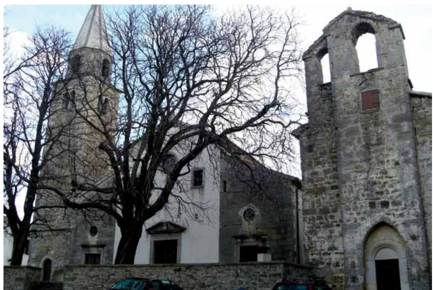
Dvojne crkve u središtu Roča

Crkve sa zvonikom iz 1676. sačinjavaju središnji sakralni kompleks. Starija je, ujedno i župna, posvećena sv. Bartolu. Izgrađena je prije 1492. kada joj je dograđeno gotičko poligonalno svetište s mrežastim svodom. Baroknu je obnovu doživjela 1755. kada je proširena bočnim brodovima i ukrašena novim pročeljem. Tada je negdašnji samostojeći zvonik spojen s crkvom, a prostor ispred crkve popločen i obzidan. U crkvi su lijepi barokni oltari, vrijedne slike i štukodekoracije. Sa zapadne je strane crkva Sv. Antuna Opata koja je, sudeći prema zidnom grafitu zvanom Ročki glagoljski abecedarij , izgrađena najkasnije 1200. godine kao jednobrodna romanička građevina pravokutnog tlocrta. U 14. ili 15. st. uz crkvu je nadograđeno gotičko poligonalno svetište, a ujedno je natkrivena kasnogotičkim mrežastim svodom. Obje su crkve u središtu trga koji je omeđen skladnim renesansnim, baroknim i klasicističkim zdanjima. Posebno se ističe renesansna kuća iz 1475., maniristička palača s portalom te grad-