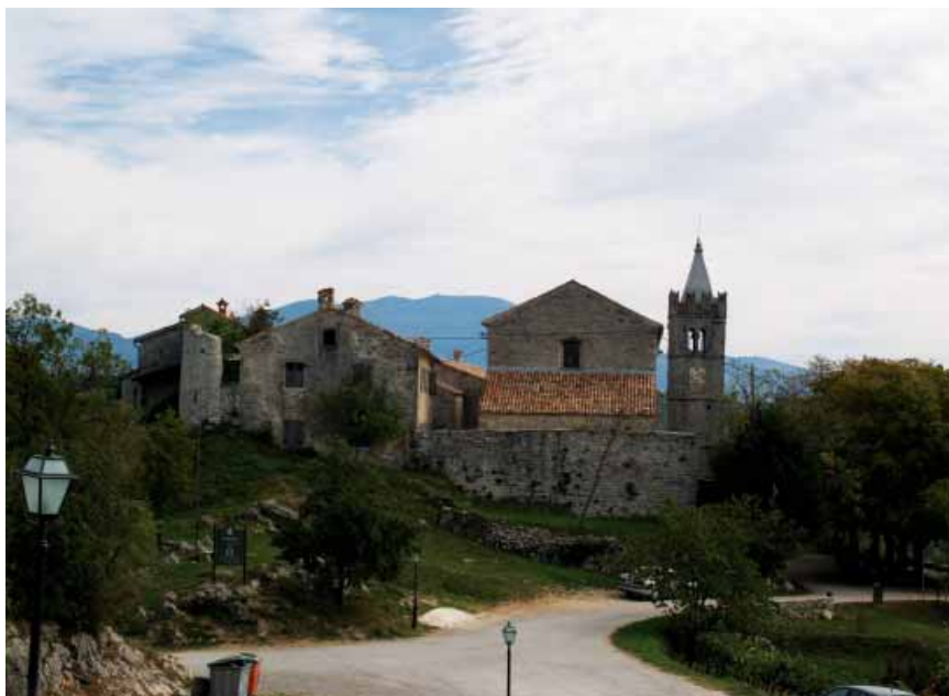
Ulaz u gradić Hum

su pronađeni tragovi iz 11. st. Tada je u sjeverozapadnom dijelu današnjega naselja izgrađen kaštel uz koji se u 12. st. uz dvije ulice formiralo manje utvrđeno podgrađe. Podignuto je na terenu koji se od kaštela blago spušta prema jugoistoku pa je izrazito izduženo.