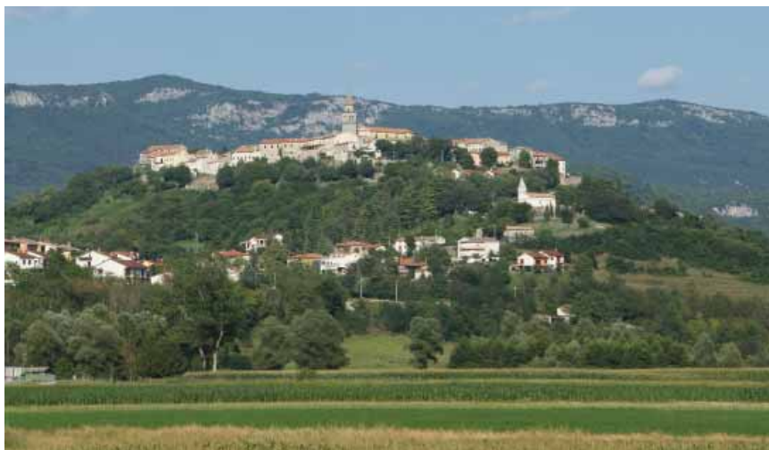
Utvrđeni stari Buzet na vrhu brda

Urbanistički se uzlet Buzeta nastavio i u 19. st. kada je na sjeverozapadnom dijelu bedema izgrađena velika klasicistička dvokrilna palača s naglašenom središnjom zonom s neorenesansnom kulom. Uređeno je šetalište na Loparu s nizom klasicističkih kuća i lapidarijem u jugozapadnoj kuli te šetalište Šotojorti ispod baroknih vrtova od Velih do Malih vrata. Među posljednjim javnim građevinama 1894. obnovljen je i zvonik uz župnu crkvu.