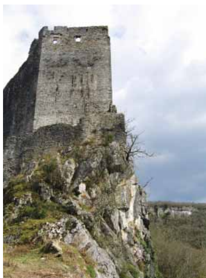
Branič-kula u Kostelu Petrapilosi

prolazom između gradske jezgre i vanjskoga obrambenog zida. Istočno od crkvice i gradske jezgre nalazi se veliko vanjsko dvorište koje je bilo sa sjeverne strane zatvoreno s nekoliko manjih građevina. U sjeveroistočnome su uglu dvorišta ostaci jedne velike zgrade nekad pokrivene dugačkim dvostrešnim krovom, a pokraj nje su u istočnome obrambenom zidu manja ulazna vrata.