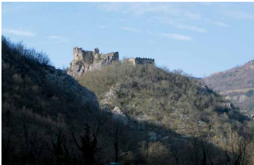
Golemi i dijelom obnovljeni Kostel Petrapilosa

se ostali puk služio crkvom Sv. Antuna Opata u dolini ispod kaštela. Posebna su vrijednost crkve Sv. Marije Magdalene vrijedni tragovi fresaka živih boja s profinjenim slikarskim detaljima iz druge polovine 15. st., koji ujedno svjedoče o materijalnom blagostanju plemićke obitelji Gravisi. Freske su bile razlomljene pa se nisu mogle restaurirati i sad se čuvaju u Zavičajnom muzeju u Buzetu. Ostaci se utvrde nalaze na vrhu kamenog brežuljka, a pristup je moguć samo sa zapadne strane. Utvrda se prilagodila konfiguraciji terena te je izdužena u pravcu istok-zapad. Cijelim kompleksom prevladava gradska jezgra izgrađena na hrptu brežuljka koju sa zapadne, sjeverne i južne strane okružuje vanjski pojas utvrda. Ulaz u Kostel nalazio se na zapadnoj strani, a odmah do ulaza bila je i zatvorena gradska jezgra, inače najbolje očuvana cjelina cijeloga kompleksa. Jezgra je izduženoga peterokutnog tlocrta, a u nju se ulazilo kroz manja vrata na istočnom dijelu zida koja su bila dodatno zaštićena manjim obrambenim zidom. Unutrašnje je dvorište te jezgre zauzimalo cijelu istočnu polovicu, a u zapadnoj je bila velika palača (palas) s četiri etaže. Katovi su bili povezani vanjskim stubištem i drvenim trijemovima.