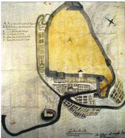
Tlocrt buzetske utvrde iz 1789. godine

zam što izaziva brojne trzavice između romanskoga gradskog stanovništva i Slavena čije su doseljavanje Franci i poticali. Stoga su Franci 804. sazvali sabor na rijeci Rižani kraj Kopra, tzv. Rižansku skupštinu (Rižanski placit), radi rješavanja sporova izazvanih nezadovoljstvom novom vlašću. To je ujedno bio i prvi spomen Buzeta.