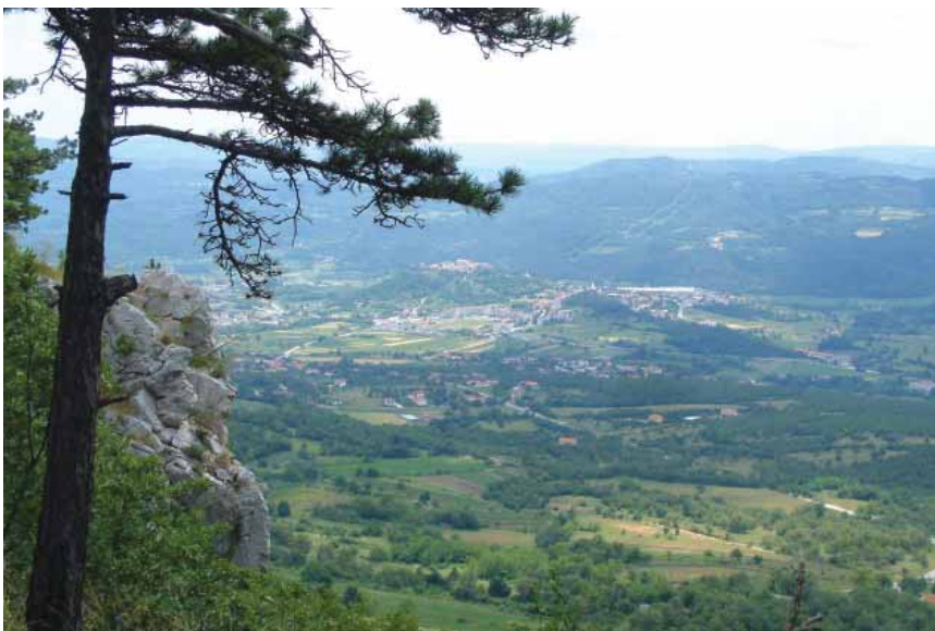
Plodna dolina i obrisi buzetske utvrde u daljini

Nakon što je Buzet teško stradao u Uskočkom ratu (1615.-1617.), mletač-