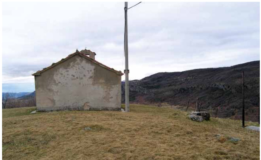
Crkva Sv. Tome Apostola u ruševinama Črnigrada

Oba su kaštela imala zajedničku povijest i istoga gospodara, ali je Beligrad koji je na višem položaju bio podređen Črnigradu. U dokumentima se prvi put spominju 1102. u ispravi gdje se ime na utvrda navode na hrvatskom jeziku ( Cernogradus et Bellogradus ) što svjedoči da je na području Roščine i onda stanovništvo bilo hrvatsko. Potom su gospodari kaštela postali akvilejski patrijarsi koji su ga prepustili njemačkom