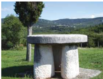
Jedno od spomen-obilježja u Aleji glagoljaša s Ročom u pozadini