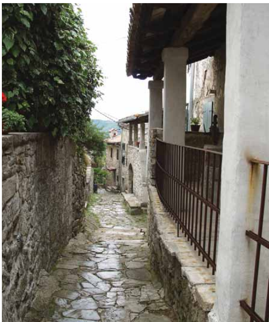
Kamena ulica u Humu