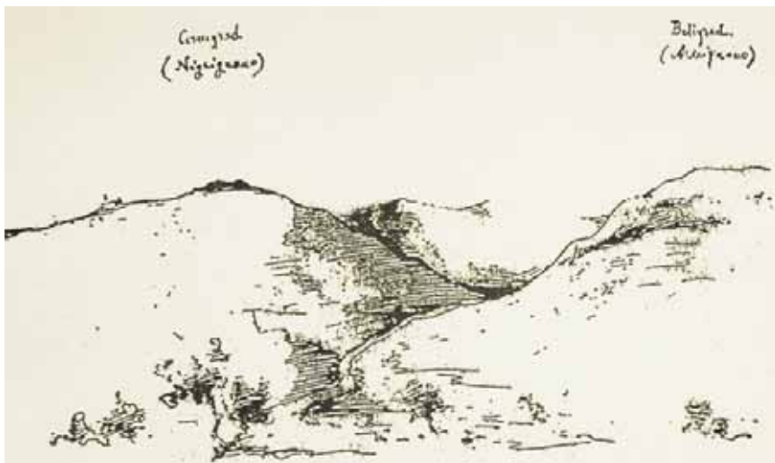
Stari crtež s položajem Črnigrada i Beligrada

Črnogradski je kaštel prema strukturi zidova izgrađen vjerojatno krajem 10. ili početkom 11. st. radi zaštite prometnice između Buzeta i Lupoglava odnosno jednog od prolaza koji je kroz klanac između Črnoga i Belog grada vodio iz središnje i sjeveroistočne Istre prema istočnom dijelu istarskog poluotoka i Kvarnera. Izgrađen je na mjestu prapovijesne gradine. Iako se skromni ostaci nalaze u gustom raslinju, na temelju jednog tlocrta De Franceschija s kraja 19. st. znamo da