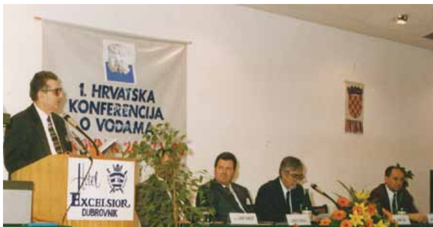
Obraćanje sudionicima Prve hrvatske konferencije o vodama

Svojim je očinskim odnosom, inženjerskom logikom, izradom planova obrane i napada te sudjelovanjem u akcijama kao ratni načelnik stožera brigade dao osobni doprinos, stavljajući čuvanje života svojih suboraca kao najveću svetinju. O svojim suborcima može reći sve najbolje. Radilo se uglavnom o gradskim dečkima