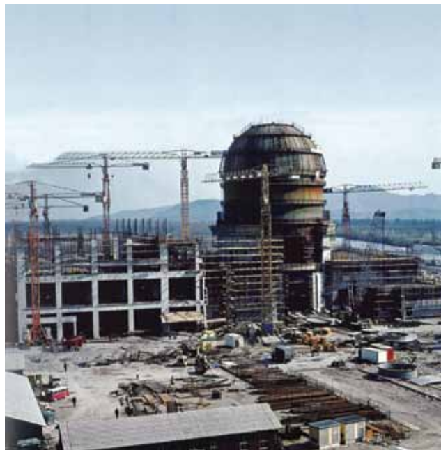
Gradilište NE Krško

vak studija. No zahvaljujući ondašnjemu hrvatskom ministarstvu znanosti ipak je dobio novu stipendiju koja mu je omogućila završetak studija. Taj nazgled mali, ali i životno važan događaj, najvjerojatnije ga je zauvijek vezao za Zagreb i Hrvatsku. Navodno su ga često zvali u Crnu Goru, nakon osamostaljenja i u Ministarstvo građevinarstva, ali je svaku takvu ponudu odbijao. Diplomirao je 26. ožujka 1959. i odmah