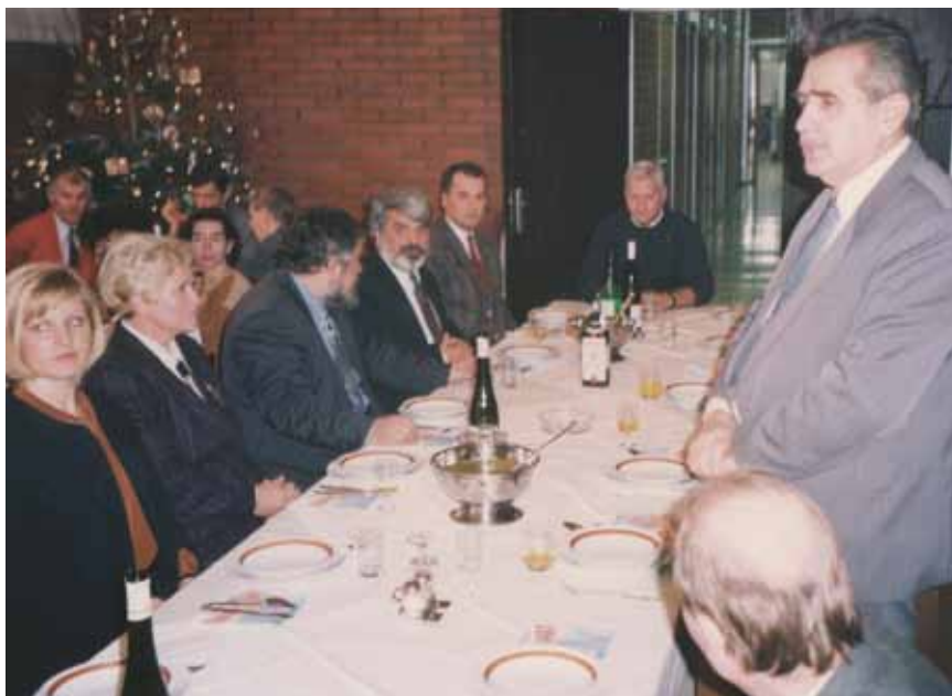
Iz Državne uprave za vode 1995.

Grada, a nadzirao je i gradnju glavnoga gradskog kolektora i uređaja za pročišćavanje u Kutini. Potom je bio uključen u ispitivanja kvalitete te je bio voditelj istraživanja vodotoka i mora. Kao zanimljivost valja spomenuti da je već imao pripremljen materijal za obranu doktorske radnje i da su ga na to poticali kolege i profesori. No ipak zbog daljnjih događaja, Domovinskog rata i brojnih obveza, to nikad učinio.