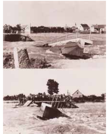
Velika poplava u Kotoribi 1965.

Nakon diplome vratio se u Međimurje i javio u Vodnu zajednicu čiji je bio stipendist, ali su mu rekli da im inženjeri ne trebaju. Bio je pronašao posao u Zadru, ali su ga ipak ubrzo pozvali u općinske službe Čakovca jer su bili preuzeli njegovu stipendiju. Tako se dogodilo da je postao službenik i nastavnik Građevinsko-tehničke škole, čak i razrednik prve generacije tehničara u Čakovcu.