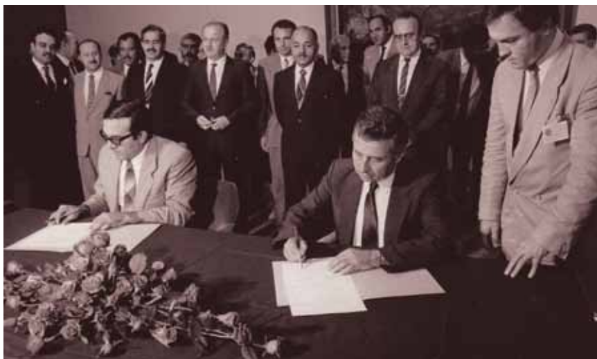
Potpisivanje ugovora za gradnju HE Bekhme

tvaranja Ingre u suvremenu kompaniju nakon osamostaljivanja Hrvatske kada je i postao predsjednik Uprave Ingre d.d.