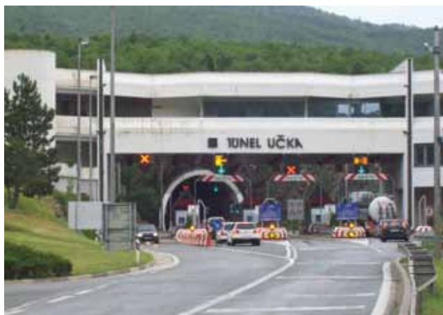
Zapadni portal tunele Učka

Ovo smo predstavljanje jednog od dobitnika nagrade za životno djelo zbog posebnih uvjeta, uzrokovanih bolešću i iznenadnom smrću, pisali s malom nelagodnom da će samozatajni dobitnik izbaciti mnogo toga kao nevažno ili pretenciozno. Sad kada ga više nema ovo što je napisano neka bude mala skromna posveta jednom velikom i časnom životu i djelu.