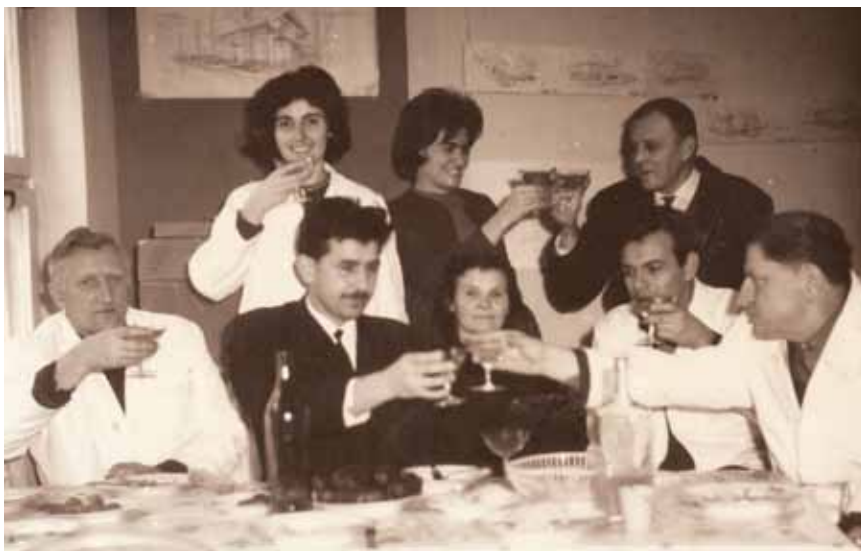
Proslava u Projektnom birou Pakrac