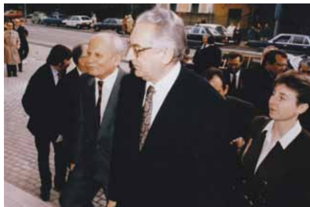
Dr. Franjo Tuđman i mađarski predsjednik Antal Göncz na otvaranju kazališta u Szolniku