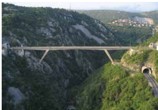
Most preko Rječine u Rijeci