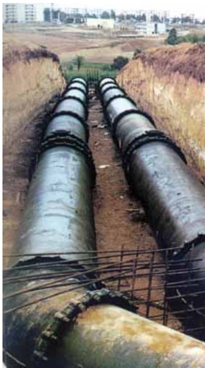
Gradnja vodoopskrbnog sustava grada Alžira