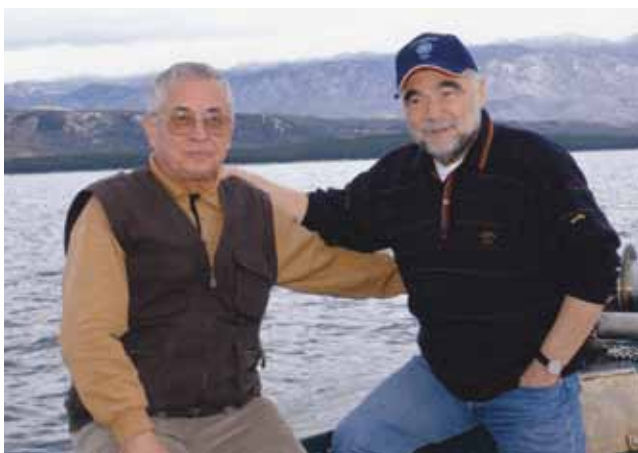
Na ribolovu sa Stipom Mesićem

Drugi je događaj bio povezan s dr. Franjom Tuđmanom, prvim predsjednikom samostalne Hrvatske, a zbio se nakon osamostaljenja Hrvatske i u doba zamjetne međunarodne izolacije. Naime Ingra je 1988. bila obnovila kazalište u mađarskom gradu Kapošvaru, a posao je dobila zahvaljujući prije toga izvedenoj obnovi i adaptaciji zgrade Hrvatskoga narodnog kazališta u Varaždinu. Dobro obavljen posao u Kapošvaru potaknuo je i obnovu kazališta Szigligeti u gradu Szolniku u središnjoj Mađarskoj. Za svečano je otvorenje mađarski predsjednik Antal Göncz (koji inače ima međimurske odnosno čakovečke korijene) pozvao dr. Franju Tuđmana kojemu je to bio prvi državnički posjet. Tada je predsjednik Göncz vrlo lijepo govorio o Međimurcima i Hrvatima. Dr. Režek bio je osobito ponosan što je kao diplomirani mostograditelj bez mostova uspijevao eto i u poslu i životu graditi mostove povjerenje i prijateljstva.