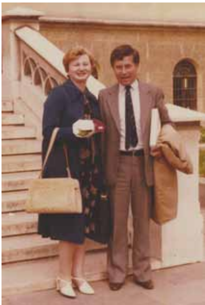
Fotografija sa suprugom nakon promocije

Ljubav prema građenju usadio mu je Viktor Filipič, građevinski obrtnik i poduzetnik, suprug majčine sestre koji je imao i određenih umjetničkih sklonosti. Često je boravio na njegovim gradilištima i poželio da se time u životu bavi jer mu se nije previše sviđalo obučarstvo kao obiteljsko obrtničko opredjeljenje. Inače taj je tetak bio u logoru, a poslije je odveden na rusko ratište. Stradao je negdje oko Volgograda, a za grob mu se ni sad ne zna.