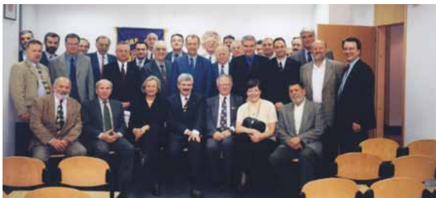
Zajednički snimak djelatnika Ingre

Na čelu je Ingre bio punih 16 godina, a posebno je zaslužan za uvođenje timske rada te vođenje projekata na marketinškoj i inženjerskoj razini. Bio je uključen i u sve složene poslove pre-