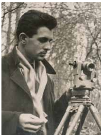
Za vrijeme rekonstrukcije ribnjaka u Pakračkoj Poljani

nje, ali i projektant idejnog i izvedbenog projekta rekonstrukcije jednog ribnjaka i regulacije dijela nasipa rijeke Ilove za Ribnjačarstvo u Pakračkoj Poljani gdje je također nadzirao izvođenje radova. Izradio je glavni projekt separacije i pranja granulata u Industriji građevnog materijala Kamen u Siraču, gdje je potom bio i direktor (1968.-1972.). To je poduzeće zahvaljujući bogatim nalazištima dolomitskog i vapnenačkog kamena (na padinama Psunja i iz izvorišta rijeke Pakre i Bijeje) proizvodilo sve vrste kamenih proizvoda, od ukrasnog do granulata za ceste. Poslovanje im je posebno uspješno nakon 1970. kada se njihova sirovina počela upotrebljavati u tvornici umjetnog gnojiva u Kutini. Valja reći da Kamen u Siraču i dalje postoji i da je to danas privatizirano dioničko društvo koje uz kamen proizvodi vapno, žbuke i stiropor.