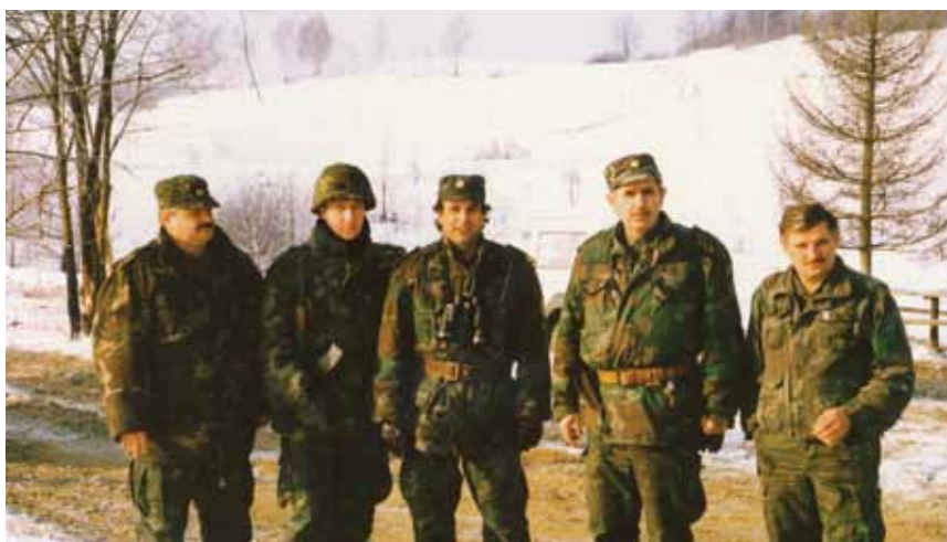
Na bojištu pokraj Generalskog Stola

pnoga radnog i društvenog života. Bio je i u kratkom pritvoru u Bjelovaru, ali i punih 17 mjeseci bez posla. Na sudu su sve optužbe odbačene, a poslije mu