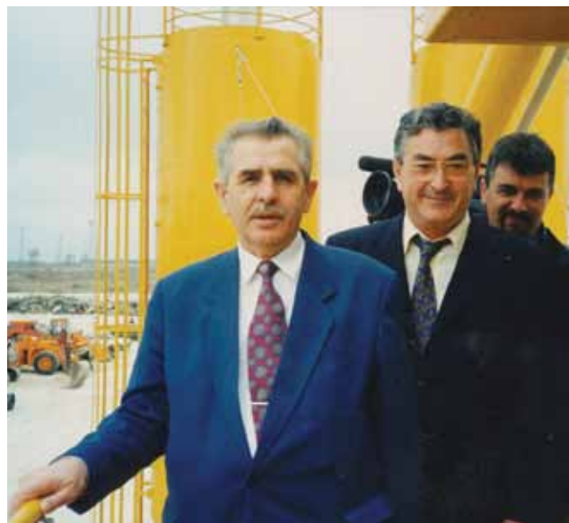
Posjet gradilištu u Pločama 1999. godine