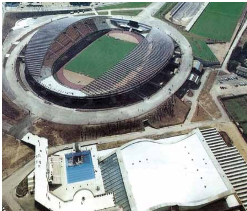
Stadion u Poljudu s kompleksom bazena

široim Hrvatske i Jugoslavije, ali i u inozemstvu, posebno u Alžiru i Iraku.