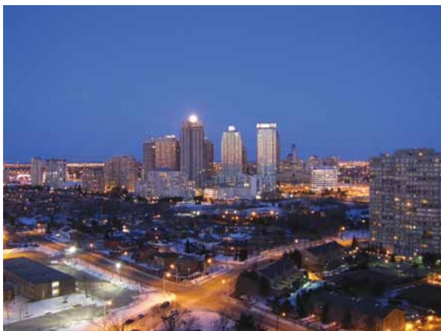
Panorama grada Missisauge

Mississauga je bivše predgrađe Toronta, a sada je treći grad u području Velikih jezera, manji od Chicaga i Toronta, ali veći od Detroita, Milwaukeeja ili Clevelanda