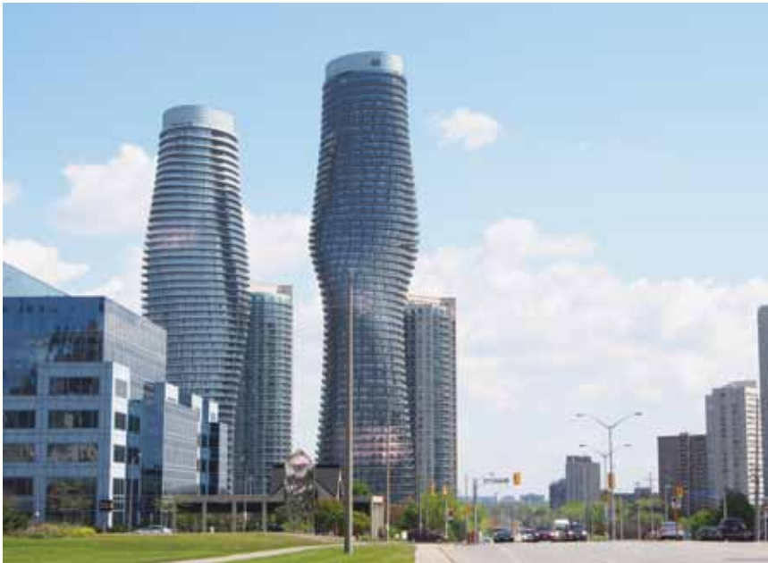
Jedna od najnovijih fotografija novih nebodera

prvi viši toranj ( Absolute World 4 ) biti završen u 2010. (u siječnju su bila izgrađena tek 22 kata), gradnja je drugog započela 2010. Prvi je i veći neboder u cijelosti završen krajem 2011. a manji toranj ( Absolute World 5 ) još nije u cijelosti završen jer traju radovi u interijeru. Vjeruje se da će sve biti posve završeno u kolovozu ove godine. Međutim, Absolute World 4 je već u cijelosti useljen, a dobrim dijelom i Absolute World 5 . S prodajom čini se nije bilo nikakvih problema, a mnogi su vlasnici skupih stanova i iz inozemstva, posebno iz Dubaia. Veći toranj ima 430 stambenih jedinica (za manji nismo uspjeli pronaći podatak), što znači da stanovi u prosjeku imaju više od 300 četvornih metara.