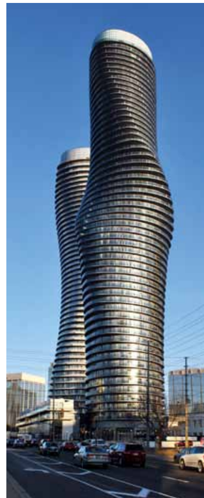
Neobični oblici novih nebodera

U projektiranje su još bili uključeni ECE Group za strojarsku i elektrotehničku opremu, Esqape Desingn za projekte interijera i NAK Desingn za krajobrazno uređenje. Glavni je izvođač bio Fernbrook Homes , a podizvođači Costa Eatmoring za iskope, Faga Group za zaštitu od podzemnih voda, Deep Foundations za temeljenje, dok je Perform Gruop isporučila oplatu, Gilbert Steel čelična ojačanja i armaturu, Innocom betone, a dizala Mayfair Electric i Thyssen Krupp . Iako se najprije planiralo da će gradnja trajati od 2007. do 2009., a potom da će