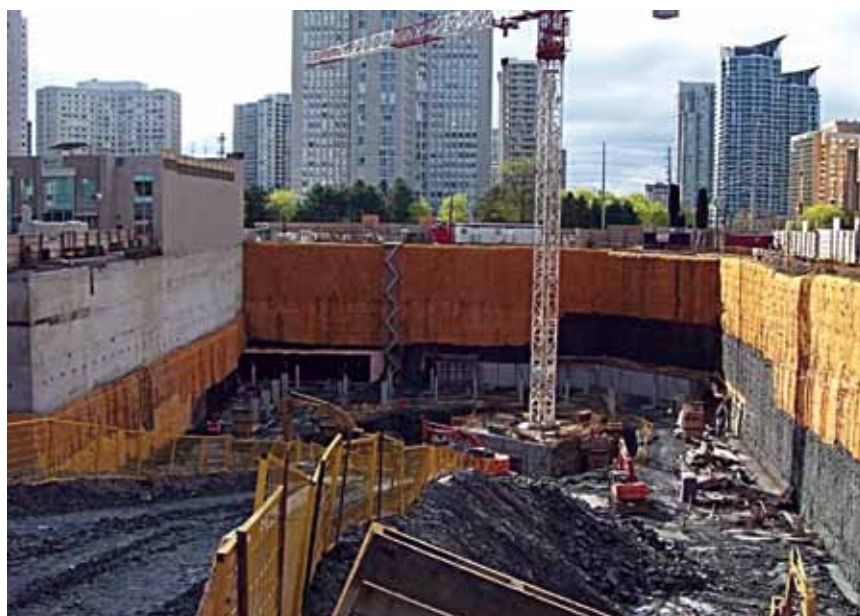
Početak građenja – radovi na iskopu

Valja reći da zakrivljene ili zarotirane građevine i nisu neka posebna novost u svijetu, a najpoznatija je takva zgrada Turning Torso ( Zakrivljeni torzo ) u Malmö, izgrađena 2006. prema projektu slavnog Santiaga Calatrave koja je sa