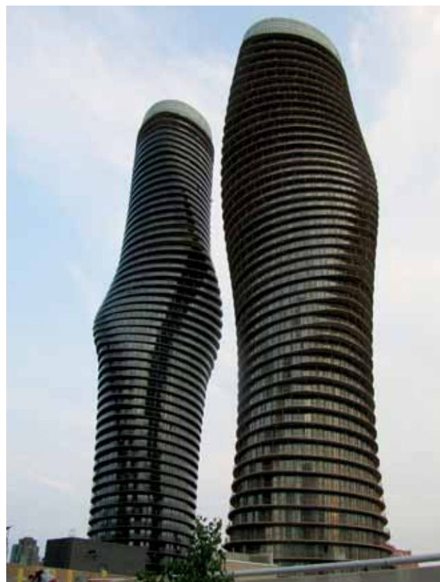
Snimak novih simbola Mississauga

od 40.000 m 2 , s tim što oba nebodera imaju po 6 podzemnih etaža za parkiranje, a površina je svake nadzemne etaže 2800 m 2 . Ipak viši je neboder do