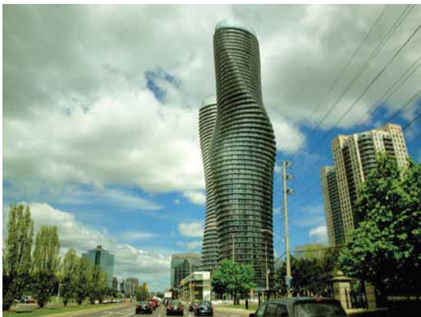
Novi izgled Hurontario Streeta u Mississaugi

Projektanti su svoje eliptične zarotirane nebodere objasnili činjenicom da je suvremena arhitektura stambene zgrade uvijek tretirala kao strojeve za stanovanje, pa da su stoga pokušali napraviti odmak te odgovoriti na pitanje može li suvremeno oblikovana zgrada prenijeti poruku i svojim stanicarima i ostalim gradskim stanovnicima. Tvrdi da je nagli razvoj negdašnjih gradskih predgrađa, poput Mississauga koja je u potrazi za svojim identitetom, prava prigoda