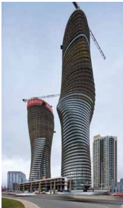
Napredovanje radova na oba nebodera