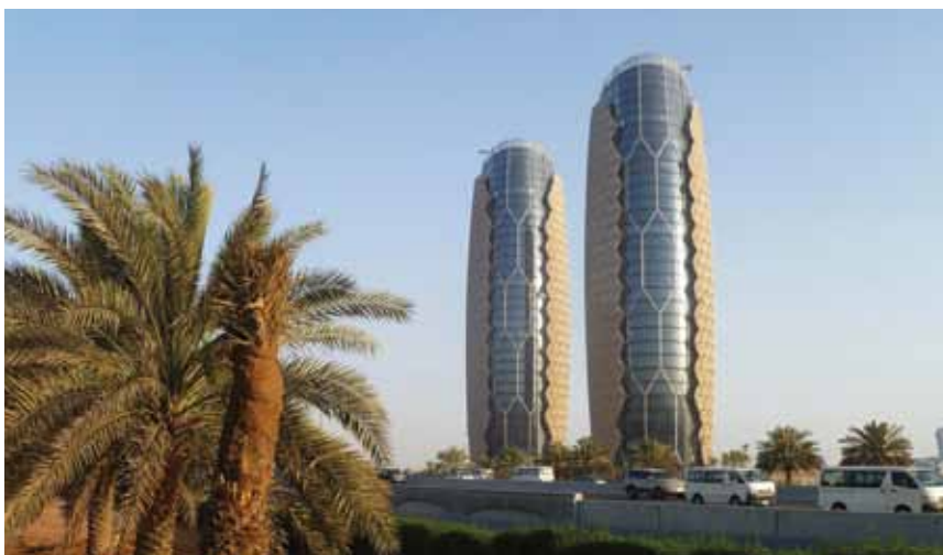
Neboder Al Bahar Towers u Abu Dabiju koji je nagrađen kao najinovativnija zgrada

Osim za najljepši neboder u Americi, dodijeljena je i nagrada na najljepšu visoku zgradu u Aziji i Australaziji (Australija, Novi Zeland, Nova Gvineja i sl.), a nagradu je dobio 135 m visoki neboder s 28 katova u Sydneyu u Australiji, nazvan Bligh Street 1 (po ulici u kojoj je 2011. izgrađen), a projektirao ga je arhitektonski biro Ingenhoven Architects iz Düsseldorfa u Njemačkoj. Za najljepši neboder izgrađen u protekloj godini u Europi proglašen je Palazzo Lombardia u Milanu, visok 161 m i s 40 katova, a zajednički su ga projektirali talijanski projektne uredi Paolo Caputo Partnership i Sistema Duemila Architettura e