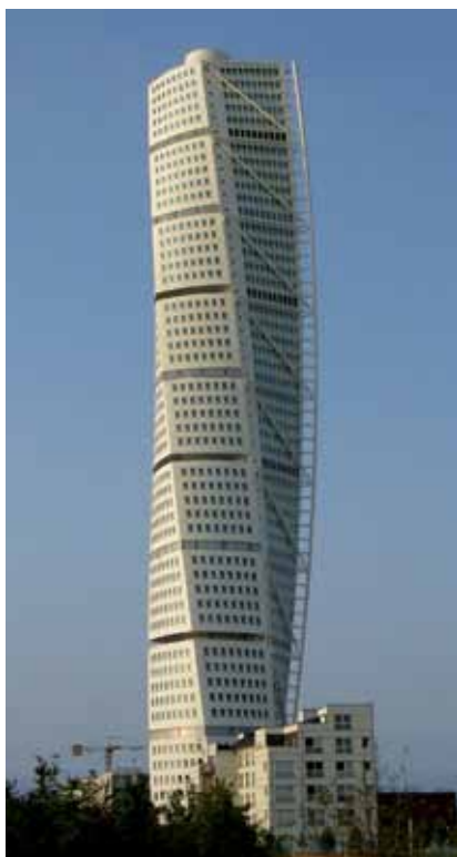
Neboder Turning Torso Santiaga Calatrave u Malmö

Da ima nešto u tim neobičnim zakrivljenim neboderima moglo se uočiti još