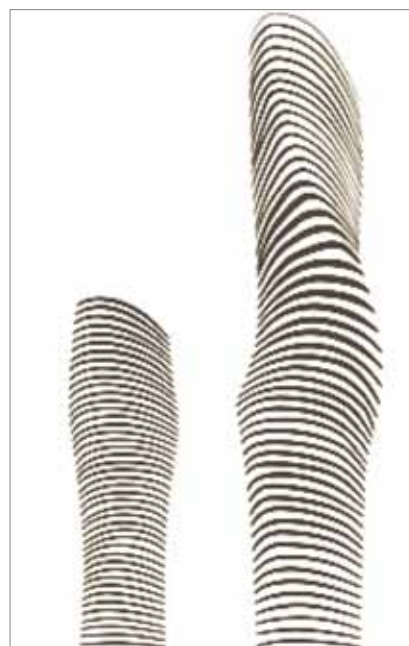
Preliminarni crtež nagrađenih nebodera Absolute Towers

Za najinovativniju visoku zgradu u svijetu u protekloj godini proglašen je Al Bahar Towers u Abu Dabiju u Ujedinjenim Arapskim Emiratima, visok 145 m i s 29 katova, koji je projektirao Aedas Architects Ltd , tvrtka nastala 2002. spajanjem LPT Architects iz Hong Konga i Abbey Holford Rowea iz Velike Britanije. Žiri je bio pod posebnim dojmom posebnoga pomičnog pročelja koje se zatvara i otvara zajedno s kretanjem Sunca. Proglašene su i dvije nagrade za životno djelo. Jednu je dobio Helmut Jahn iz Chicaga, poznat po projektima