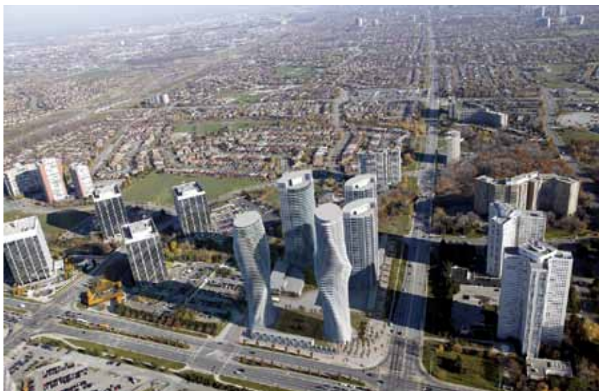
Prikaz svih nebodera Absolute Worlda na panorami grada