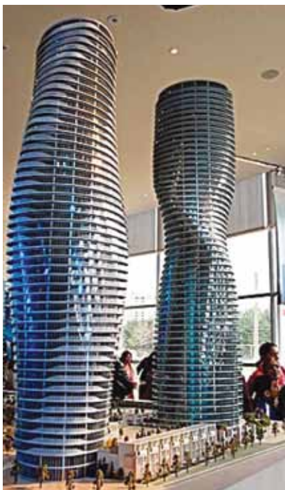
Detalj s izložbe na kojoj su prikazana izabrana rješenja

U Mississaugi je smješten jedan od najvećih dijelova Sveučilišta u Torontu, a tu je i sjedište mnogih svjetskih korporacija, ali i više od 18.000 tvrtki. Kroz grad prolazi i najveća kanadska autocesta 401 pa se grad zahvaljujući dobroj prometnoj povezanosti i blizini Toronta iznimno brzo razvija. Štoviše, prema napretku i kvaliteti života svrstan je na 11 mjesto među najpoželjnijim kanadskim gradovima.