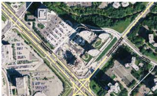
Plan dijela grada gdje se nalazi Absolute World i gdje su izgrađeni Absolute Towers

Ipak krajem studenoga 2006., na dodjeli redovitih godišnjih arhitektonskih nagrada Mississauga, ondašnji je i sadašnji gradonačelnik Hazel McCallion