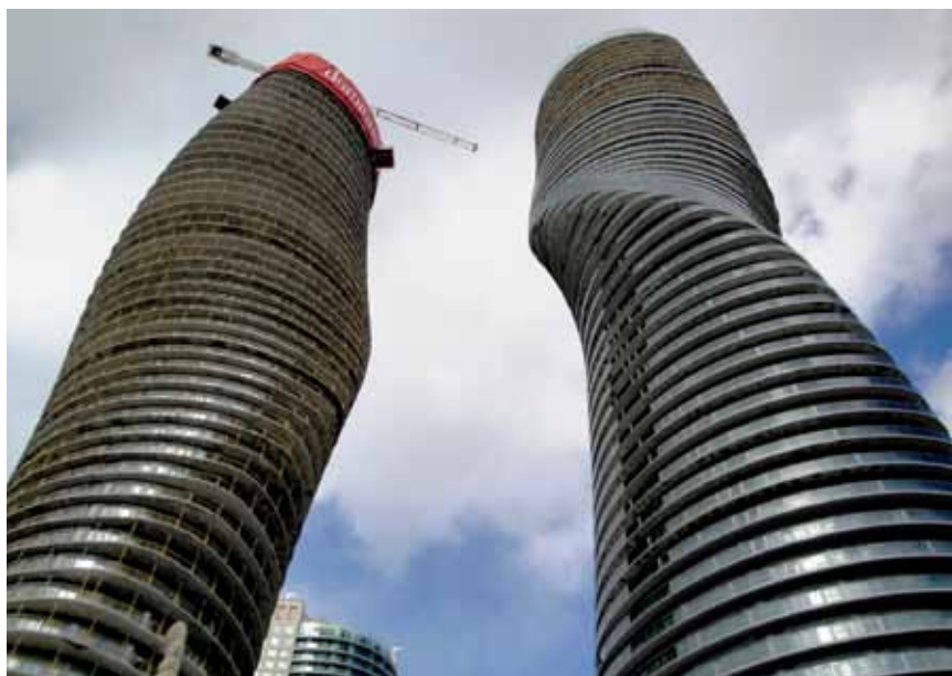
Završni radovi na konstrukciji