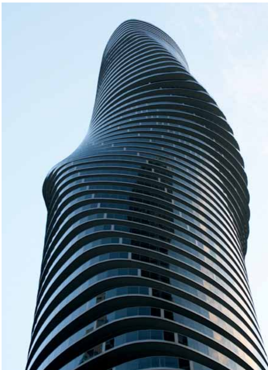
Stambeni neboder kao suvremena skulptura

Za kraj smo ostavili jednu pomalo šaljivu opasku. Naziv Marilyn Monroe , koji gotovo svi upotrebljavaju, nastao je spontano za oba nebodera, a uglavnom se odnosi na veći neboder ( Absolute World 4 ) za koji je i dobivena nagrada jer Council on the Tall Buildings and Urban Habitat ne dodjeljuje nagrade za nedovršene zgrade, a zna se da Absolute World 5 tek treba biti završen. Kako se zna da neboderi predstavljaju muškarca i ženu, bilo bi sasvim razumljivo da dvadesetak metara niži neboder predstavlja žensku osobu, a da viši predstavlja muškarca. No kada se spominje naziv Marilyn Monroe obično se misli na višu zgradu pa se čini da je jedna zanimljiva ideja pomalo feminizirana. Je li to na neki način pogreška projektanata, jer viša i vitkija zgrada zaista ima mnogo uočljivije "oblina" ili samo još jedna šala ponosnih stanovnika Mississauga, nije lako razumjeti. No to je ipak sasvim svejedno jer zahvaljujući dvjema atraktivnim zgradama za taj su kanadski grad čuli mnogi širom svijeta, čak i oni koji donedavno nisu ni znali da postoji. A sasvim će se sigurno spominjati i navoditi i u budućnosti.