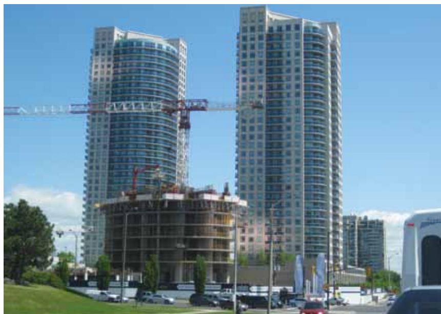
Prve nadzemne etaže nebodera Absolute World 4