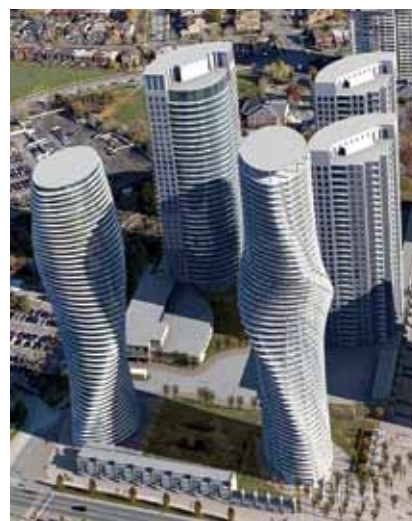
Prikaz svih nebodera rezidencijalno-stambenog kompleksa Absolute Worlda

objavio da će se za gradnju preostala dva nebodera raspisati međunarodni natječaj kako bi se na sjeveroistočnom križanju Burnhamthorpe Rooda i Hurontario Streeta razvio jedan prepoznatljiv orijentir i simbol mladoga grada u razvoju. Ujedno je istaknuo da je to prvi put u četrdeset godina da se u velikoj gradskoj regiji Toronta raspisuje međunarodni natječaj za arhitektonsko rješenje, nakon što je 1958. izabrano rješenje finskog arhitekta Vilja Revella za novu gradsku upravnu zgradu Toronta, a posebnost je u tome što natječaj raspisuju privatni investitori.