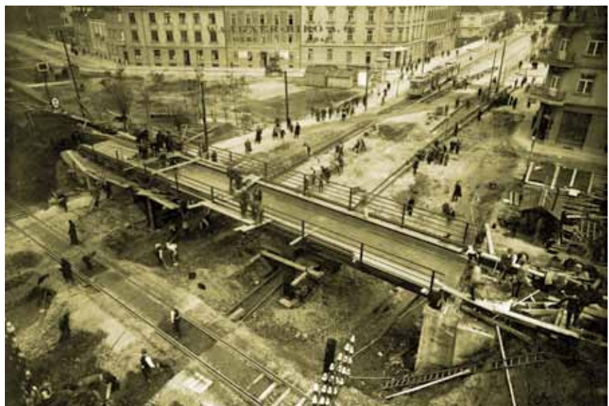
Gradnja nadvožnjaka preko Savske ceste u Zagrebu, Waagner-Biró A.G. Beč-Graz

Do 1918. pruga Zidani Most – Zagreb – Sisak imala je status glavne pruge drugog reda i prometno je najvećim dijelom bila vezana uz državnu magistralnu prugu Beč – Ljubljana – Trst. S obzirom na solidnu izvedbu, i to u građevnom smislu i u pogledu osiguranja, iskorištavanje je pruge u prvim desetljećima teklo bez većih poteškoća. Problemi su se osjećali jedino u prometu mostom preko rijeke Save kod Zagreba koji je postao preslab za prihvatanje svih vlakova Društva južnih željeznica i Mađarskih državnih željeznica (MÁV) koje su se zajednički koristile dionicom do Zaprešića za sve vlakove koji su kretali iz Zagreba. Posebno se to osjetilo 1913. nakon što je MÁV u promet uveo lokomotive,