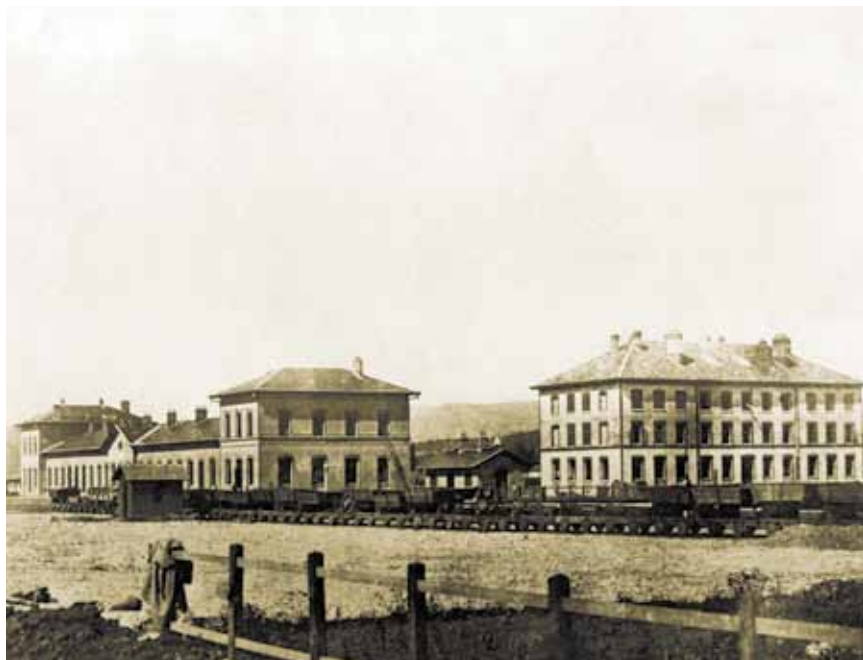
Zagreb Zapadni kolodvor s kolosiječne strane iz 1862.

Jednokolosiječna pruga s trasom između Zidanoga Mosta, Zagreba i Siska, odnosno do savske luke u Galdovu, bila je dugačka 127,58 km, a granicu između Slovenije i Hrvatske prelazila je na rijeci Sutli. Uzduž cijele pruge bilo je deset kolodvora, od kojih je pet bilo na slovenskom a pet na hrvatskom području. Na slovenskom su dijelu izgrađeni kolodvori Steinbrück (danas Zidani Most), Lichtenwald (danas Sevnica), Reichenburg (danas Brestanica), Videm Gurkfeld (danas Krško) i Rateče (danas Brežice), a na hrvatskom Zaprešić Brdovec (danas Zaprešić), Agram Südbahnhof (Zagreb Južni kolodvor, danas Zagreb Zapadni kolodvor), Gorica (danas Velika Gorica), Lekenik i Sissek (danas Sisak). Sve prijamne zgrade bile su građene tipski, s karakterističnim rubovima od crvene opeke oko pročelja, vrata i pro-