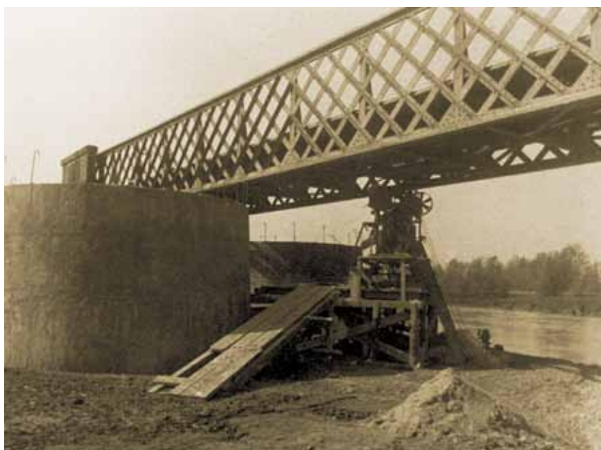
Most preko rijeke Krapine kod Zaprešića 1942.

Izgradnju je novog mosta preuzela Sekcija za izgradnju pruga iz Zagreba, a most je projektirala, izradila i ugradila Prva jugoslavenska tvornica vagona i strojeva Slavonki Brod , današnji Holding Đuro