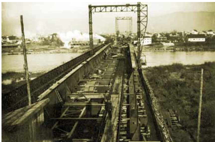
Gradnja novoga željezničkog mosta preko rijeke Save kod Zagreba 1937.–1939.

Zbog vlasničke promjene željezničkih pruga i podržavljenja od 1. siječnja 1924., ni gradnja novoga kolodvora ni bilo kakvi zahvati nisu bili ostvareni, a i od drugih planiranih ulaganja ostvaren je tek manji dio. Tako je 1920. bio izgrađen ranžirni kolodvor na Črnomercu, čime je teretni prijevoz u Zagreb Južnom kolodvoru odvojen od putničkog, a 1929. u promet su predani jednokolosiječni nadvožnjaci na Savskoj i Samoborskoj cesti. Oni su zamijenili željezničko-cestovne prijelaze u razini koji su znatno