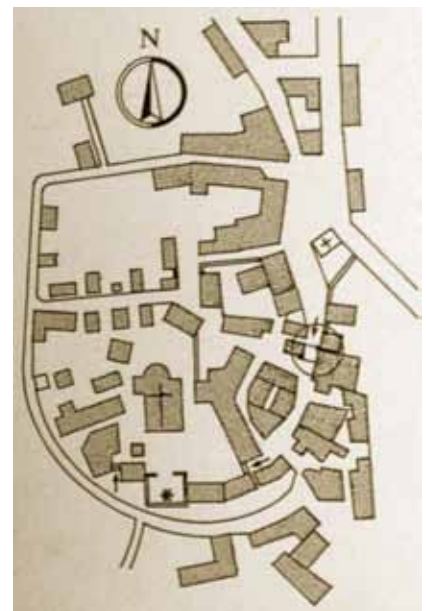
Tlocrt stare urbane jezgre Višnjana

Manje je, međutim, poznato da se Višnjana unatoč svojim antičkim korijenima razvio tek u srednjem vijeku kao manje utvrđeno naselje na brijegu s kojeg se otvara širok pogled na zapadnu Poreštinu. Upravo taj dominantan položaj i radialno-kružna urbana struktura nedvojbeno svjedoče da je i to naselje izgrađeno na mjestu prapovijesne histarske gradine i potom uključeno u sklop rimskoga porečkog agera. Vjerojatno je to naselje bilo u međuvremenu napušteno jer je urbani razvoj započeo tek u ranome srednjem vijeku. U dokumentima se prvi put spominje 1203. kada ga je porečki biskup ujedno i feudalni gospodar dao na uživanje Goričkim (Pazinskim) grofovima kao dio motovunskog feuda. S Motovunom je 1278. došao pod vlast Mletačke Republike, gdje je bio sve do njezine propasti 1797. godine. Administrativno je pripadao Motovunu sve do 1847. kada je postao samostalna općina.