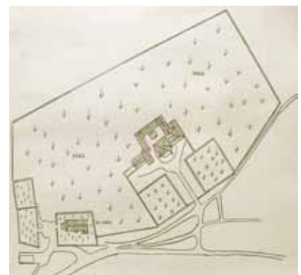
Tlocrt dvorca i parka Svetog Ivana od Šterne

U dokumentima se Sveti Ivan od Šterne prvi put spominje 1102. u već toliko puta isticanoj darovnici markgrofa Ulrika II. akvilejskoj crkvi kao selo Cisterna (Villa Cisterna). Vjerojatno je već u ranoj srednjem vijeku na tom mjestu postojala crkva sa selom kao feudalnim posjedom. Nakon što je 1420. Venecija osvojila Akvileju, Sveti Ivan postao je dijelom Mletačke Republike koja ga je davala u posjed raznim plemićkim obiteljima. Poput širega okolnog područja, Sveti Ivan od Šterne u ratovima i bolestima također je izgubio velik dio stanovništva, pa su ga mletačke vlasti u 16. st. naselile izbjeglicama pred Osmanlijama iz Dalmacije, Albanije i Crne Gore.