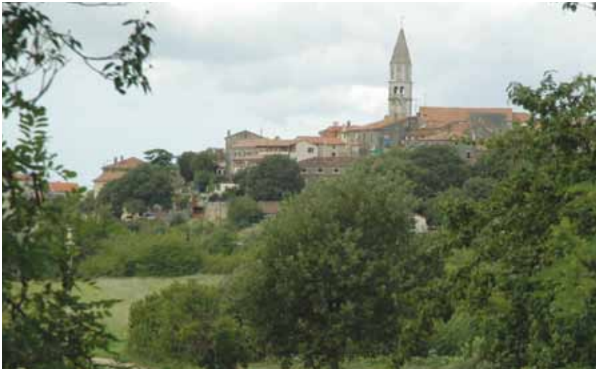
Stara gradska jezgra Višnjana (pogled s jugoistoka)

gnuta je početkom 17. st. gradska loža. Srušena je 1765. i na njezinom je mjestu podignuta barokna loža s pogledom na cijelu porečku obalu, od Umaga do Vrsara. Kvadratna je to građevina koja je s tri strane otvorena stupovima i pokrivena niskim pravokutnim piramidalnim krovom. S južne strane trg zatvara današnja općinska palača, na koju se naslanja dio negdašnjih fortifikacija sa sačuvanim unutrašnjim gradskim vratima, zvanim Vela ili Stara vrata (Porta Grande ili Porta Vecchia), ukrašena grbom mletačkoga lava koja su oblikom gotovo istovjetna onima u Gologorici.