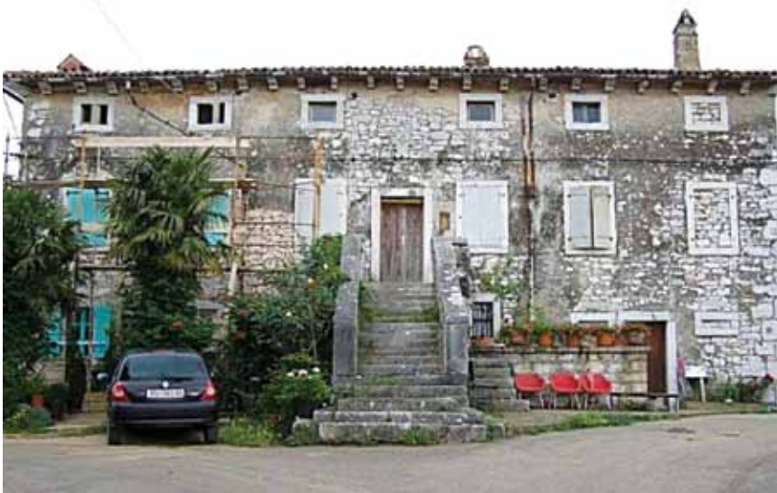
Dvokatnica u Gradini na mjestu negdašnjeg kaštela

U dokumentima se prvi put spominje kao središte feuda kojega je Acika zajedno s limskim ribnjacima darovala tršćanskom biskupu Adalgeru, a od 1186. posjed je u zakupu već spomenutoga pulskog plemića Girola. Njegovi su potomci držali utvrdu i posjed sve do izumiranja 1592., a potom ga je mletačka vlast dodijelila obitelji Capello. Ta je obitelj držala utvrdu sve do kraja 18. st. kada je novim gospodarom postala rovinjska plemićka obitelj Califfi. Oni su Gradinu držali u posjedu sve do 1848.