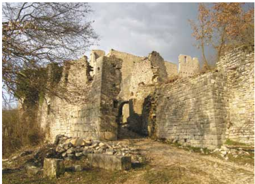
Glavni ulaz u utvrđeni Dvigrad

Sadašnji je oblik crkva dobila u doba romanike. Monumentalna trobrodna građevina pravokutnog tlocrta ima ravno začelje koje se sastoji od prije izgrađenih i prilagođenih dijelova. Apside su u tlocrtu polukružne, srednja je viša i veća, a južna pripada starijoj krstionici. Crkva je pretvorena u trobrodnu baziliku pa je znatno proširena i produljena. Srednji je brod neznatno uži od prijašnje predromaničke crkve, ali i gotovo dvostruko širi od pobočnih brodova koji su odijeljeni s pet pari četvrtastih zidanih stupova. Veći dio kamenih romaničkih ostataka pripada ciboriju koji je bio iznad oltarnog groba te ukrašen biljnim, geometrijskim i figurativnim motivima. Uzdužni su zidovi romaničke bazilike glatki i bez prozorskih otvora, pa je svjetlost ulazila kroz tri okrugla i četiri polukružna prozora na pročelju te kroz 12 visokih polukružnih prozora u povišenim zidovima srednjeg broda. Glavni je ulaz u baziliku bio s trga