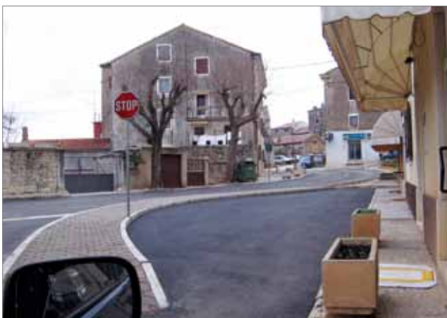
Detalj iz sjedišta Višnjana

Sljedeći je kaštel na širokom prostoru između Poreča i Pazina Sveti Ivan od Šterne (tal. San Giovanni della Cisterna ), smješten u središtu manjeg naselja, tri kilometra sjeverno od Baderne u općini Višnjan na lokalnoj cesti za Majkuse i Muntrilj, petstotinjak metara istočno od državne ceste Pula – Buje. Poput brojnih drugih istarskih kaštela ili naselja istog imena, prvi je dio imena nastao prema crkvi Sv. Ivana iz 14. st.,