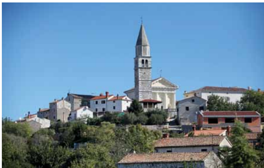
Crkva Sv. Kvirika i Julite u Višnjaju

i Julite iz 1833. koja zatvara trg sa sjeverne i zapadne strane. Ta jednobrodna i dugačka crkva, s velikom polukružnom apsidom i sakristijom te izrazitim klasicističkim pročeljem, monumentalnošću pomalo "kvari" rustičnu jednostavnost gradića. Pročelje je crkve pojačano kolonadom od četiri golema stupa koji pridržavaju trokutasti zabat sa stiliziranim Božjim Okom u čast zaštitnika crkve Sv. Kvirika i Julite. U crkvi je mnoštvo umjetničkih djela, a posebno se ističe glavni oltar sa svetohraništem i palom s likovima sv. Kvirika i Julite iz 17. st., slika Blažene Djevice Marije (rad poznatoga venecijanskog majstora Zorzi Venture iz 1598.) te stropne slikarije s prikazom mučenja Sv. Judite, starozavjetne mučenice.