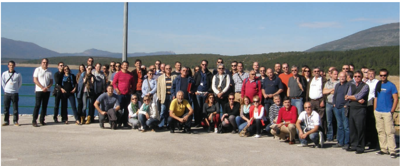
Sudionici Savjetovanja na brani Peruća