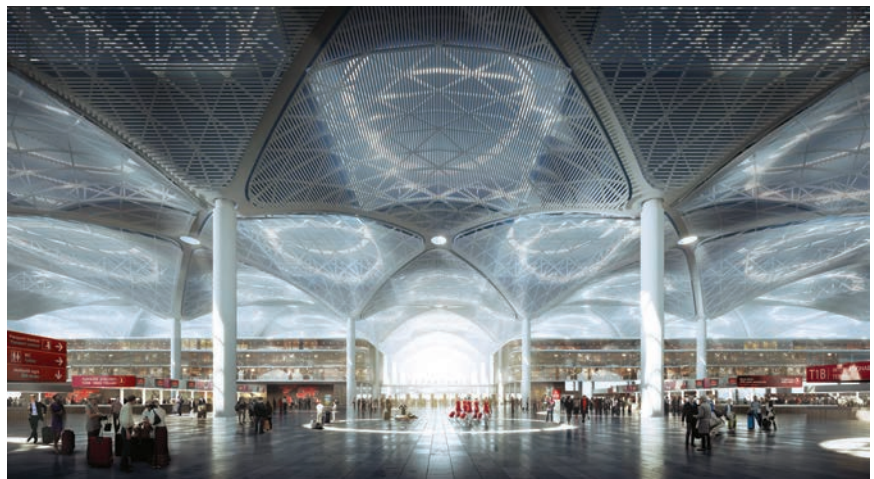
Unutrašnjost prvog terminala

Čini se da je gradnja toga golemog megaprojekta, koji će biti dvostruko veći od londonskog Heathrowa , svojevrsna prijetnja ne samo europskim već i zaljevskim avioprijevoznicima. Naime, osim divovskog aerodroma, Turska planira i golemu ekspanziju nacionalnog prijevoznika Turkish Airlinesa koji bi trebao postati jedna od najvećih svjetskih avionskih kompanija. Vjerojatno će to biti prigoda da Turkish Airlines udvostruči svoju flotu i da za 50 posto poveća broj odredišta na koje leti. Kompanija je već dvaput izabrana za najboljega europskog avioprijevoznika, a već je 2012. povećala promet putnika za 20 posto pa sada prevozi približno 45 milijuna putnika na godinu. Za daljnji im je rast