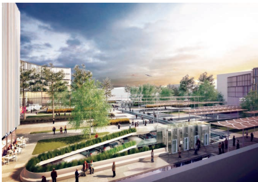
Detalj dijela vanjskih sadržaja nove zračne luke

Konzorcij je za izradu projekata izabrao tri svjetske poznate projektantske tvrtke – Nordic - Office of Architecture iz Norveške, Grimshaw iz SAD-a i Haptic Architects ,