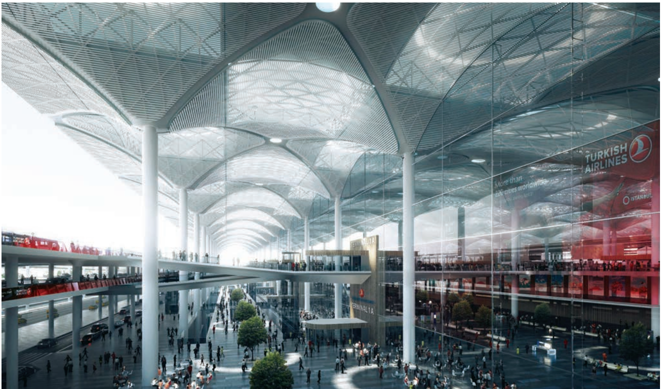
Prikaz ulaznog dijela terminala koji će se graditi u prvoj fazi

Osim goleme zračne luke planira se i ekspanzija Turkish Airlinesa kao nacionalnog prijevoznika koji treba biti jedna od najvećih svjetskih avionskih kompanija