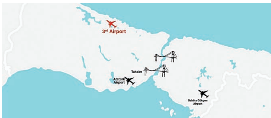
Položaj postojećih i buduće zračne luke u Istanbulu

Zapravo postojeća zračna luka u Istanbulu i nije toliko stara jer je temeljito renovirana 2002. kada je otvoren novi terminal za međunarodni promet s kapacitetom od 20 milijuna putnika na godinu. Uz njega je i terminal za domaći