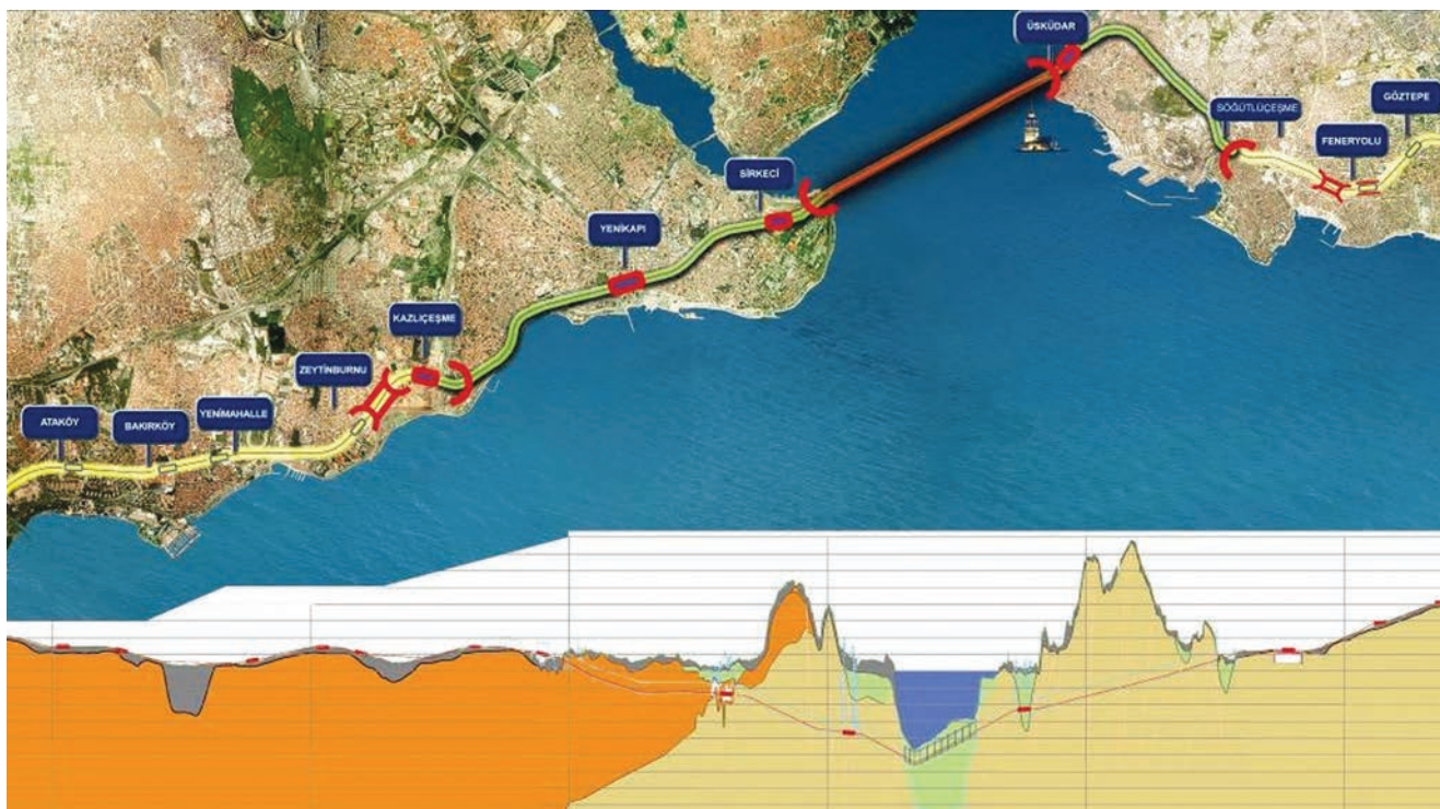
Tlocrtni i visinski prikaz trase gradske željeznice i tunela Marmaray

Taj je gospodarski uspon zasnovan na dugogodišnjem neprekidnom gospodarskom rastu priskrbio Turskoj naziv "europska Kina", pa je ta pretežno islamska zemlja, s nereligioznom, demokratskom i liberalnom ekonomijom postala i moguću uzor za mnoge zemlje Bliskog istoka i Afrike. Štoviše prije je nekoliko godina bivši američki savjetnik za sigurnost