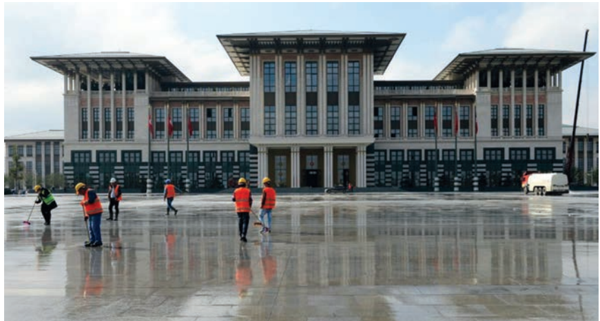
Nova predsjednička palača u Ankari

Nagli gospodarski uspon donio je i znatan politički utjecaj, posebno u Africi i na Bliskom istoku, i članstvo u gotovo svim otvorenim međunarodnim organizacijama. No donio je i velike razvojne i pomalo grandiozne građevinske projekte. Dovoljno je spomenuti prvi svjetski željeznički tunel između dvaju kontinenata, koji je ispod Bospora povezo Europu i Aziju. Otvorio ga je spominjani Erdoğan, ondašnji premijer, a od 28. kolovoza 2014. predsjednik Republike Turske. Tako je realiziran projekt koji su priželjkivali i sanjali neki od posljednjih osmanskih sultana. Zamislio ga je 1860. sultan Abdulmecit, a neuspješno 30 godina poslije pokušao realizirati njegov nasljednik Abdulhamid. Radovi su na tom megaprojektu, vrijednom četiri milijarde dolara, započeli 2004. godine, a tunel je dug 13,6 km i njegova se cijev nalazi 60 m ispod morske razine, pa se svuda ponosno ističe da je riječ o najdubljem tunelu na svijetu. Službeno je nazvan Marmaray , što je kombinacija naziva Mramornog mora i turske riječi "ray" koja znači željeznica. Gradila ga je japanska tvrtka Taisei uz pomoć turskih partnera i izvedba je trebala trajati samo četiri godine, ali se razvukla zbog brojnih arheoloških otkrića. Tunel je otvoren 2013.