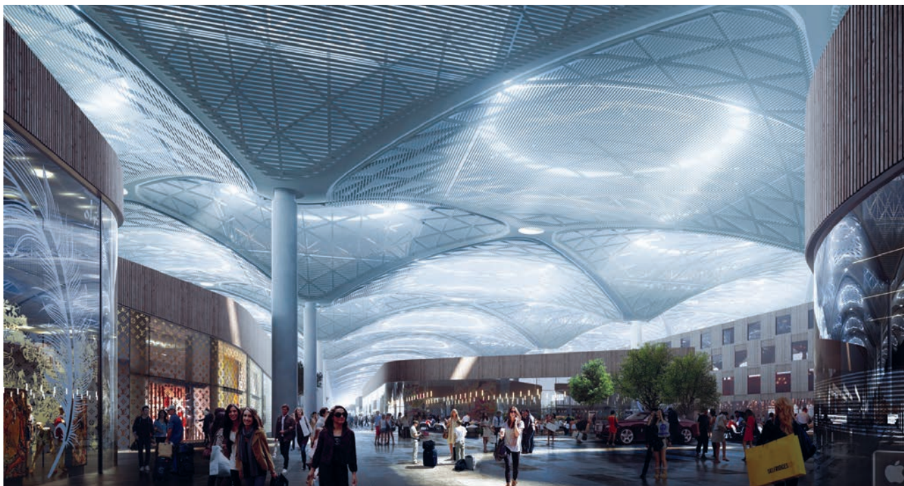
Prikaz rada terminala u punom pogonu

gotovo cijeli svijet, mnogi smatraju da je broj od 150 milijuna putnika zasigurno pretjeran i da će nova zračna luka teško moći prometom parirati najvećim američkim aerodromima. No tko zapravo uopće išta može reći i pretpostaviti kada je i dosadašnji porast avionskog prometa, baš kao i gospodarski uzlet koji ga je i uzrokovao i potaknuo, došao naglo i gotovo neočekivano.