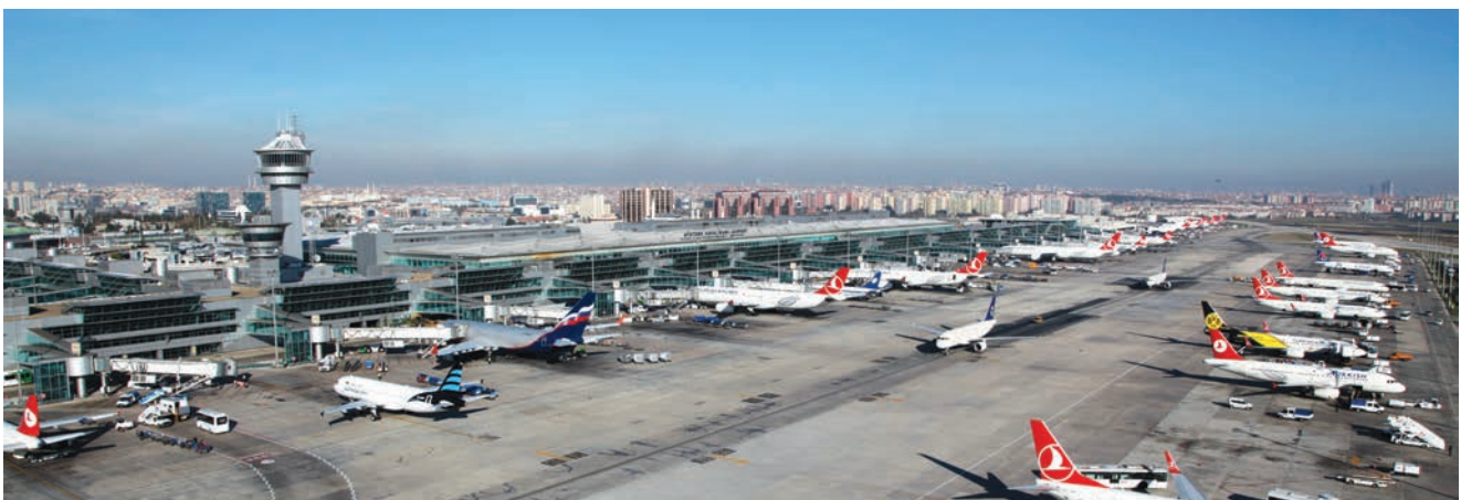
Zračna luka Atatürk u Istanbulu

I godinu dana poslije 29. listopada, na Dan Republike već je spominjani predsjednik Erdogan otvorio novu predsjedničku palaču čija je gradnja bila izazvala veliko protivljenje turske oporbe i zaštitnika okoliša. Riječ je o velebnoj zgradi bijele boje koja je odmah nazvana "bijela kuća". Nova je zgrada podignuta na rubu Ankare, na terenu koji je kupio prvi predsjednik i osnivač Republike Mustafa Kemal Atatürk, da bi na njemu izgradio farmu. Ta je nova predsjednička palača stajala 616 milijuna dolara, što znatno premašuje prijašnje najave od 350 milijuna. Mnogo je veća od Bijele kuće, Elizejske i Buckinghamске palače zajedno, a navodno ima više od tisuću soba i ukupnu površinu od 200.000 m 2 (prema nekim izvorima i 270.000 m 2 ). Protivnike te "sultanske palače" (kako je nazivaju) najviše ljuti