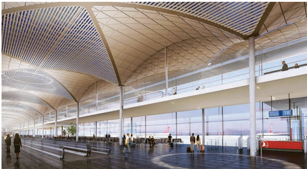
Detalj budućeg rada terminala

zemljište nalazi pokraj jezera Terkos iz kojeg se vodom opskrbljuje cijeli grad. Mnogi i ne vjeruju da će se ta golema investicija ikad isplatiti, ali ističu da će se za gradnju nove zračne luke oboriti dva i pol milijuna stabala i isušiti 70 % jezera. Ujedno je područje budućega najvećeg aerodroma na svijetu jedno od rijetkih područja europske Turske koje je još ostalo donekle netaknuto, pa je i utočiš-