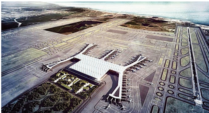
Pogled iz zraka na buduću zračnu luku

nike, teret i avionsko osoblje, ali i zgradu za državne službe, unutrašnje i vanjsko parkiralište s kapacitetom za gotovo 70.000 vozila, zrakoplovno-medicinski centar, prostorije za spasilačke službe, garaže, hotele, kongresne centre, elektrane i uređaje za pročišćavanje otpadnih voda i odlaganje otpada.