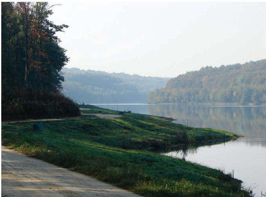
Jezero Lapovac pokraj Našica

Sustavnim i dugogodišnjim ombrome-trijskim i hidrološkim mjerenjima uo-čeno je da postojeća kanalska mreža ne može odvesti više od trećine velike vode. Stoga je prof. Bella 1930. godine izradio Projekt za obranu područja Ka-rašice i Vučice u Slavoniji od poplave pomoću retencije . Zapravo ponudio je dva moguća rješenja, nadogradnju po-stojeće kanalske mreže s proširivanjem i produbljivanjem postojećih kanala radi povećanja kapaciteta ili da se voda za velikih kiša negdje zadrži i poslije kon-trolirano ispušta u odvodne kanale. Kako bi kopanje kanala iziskivalo iskop