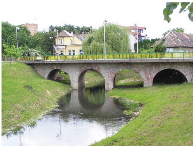
Most Malta preko Karašice u Valpovu