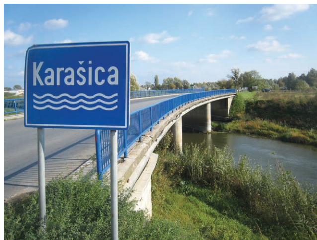
Natpis na mostu u Petrijevcima

nekom fusnotom da izbjegnem moguće zabune. Jer kada bi se takvo zbranje, inače potpuno neuobičajeno, primijenilo na već spominjani Mississippi i Missouri, onda bi to sa 7533 km bio uvjerljivo najduži vodotok na svijetu.