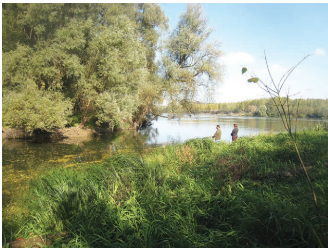
Ušće Gatskog kanala u Dravu

dakle tok Karašice s nastavkom Vučice do Drave ukupno dugi 150 km. Tom smo podatku i mi u često spominjanom negdašnjem članku povjerovali, računajući da se radi o hrvatskoj verziji američkih rijeka Mississippi-Missouri. Čak smo istaknuli da se po dužini radi o osmoj našoj rijeci, a četvrtoj po toku u Hrvatskoj. Tome i danas, primjerice, vjeruju engleska Wikipedija (ali i kineska), a ostale navode podatak iz naših enciklopedija i leksikona da je Karašica dugačka 91 km, i 93 km u nekim izvorima. No u podatak što ga navode engleska i kineska Wikipedija vrlo je teško ne vjerovati jer se nalazi u Strategiji upravljanja vodama (NN 91/08). Možda su njezini tvorcii jednostavno zbrojili dvije rijeke i iznijeli njihovu zajedničku dužinu, a onda su to ipak trebali objasniti