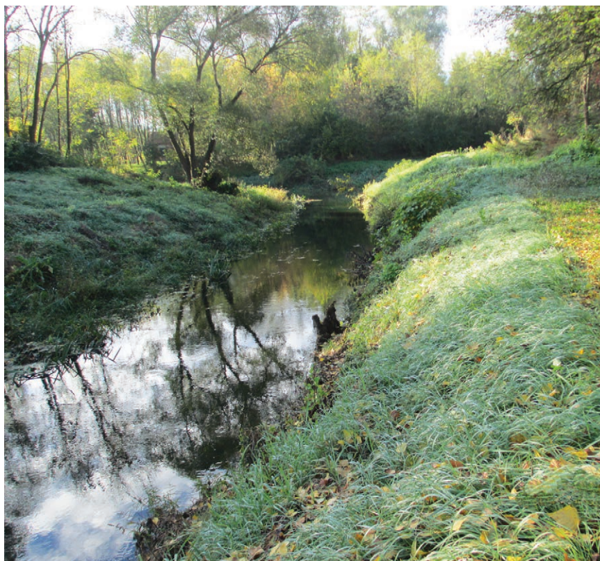
Karašica pedesetak metara prije ušća u Vučicu

Projektna dokumentacija. brojni internetski portali, zakoni i pravilnici