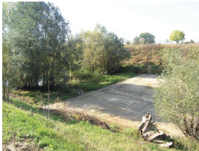
Prag u Gatskom kanalu

u mjestu Črnkovci, nekoliko kilometara uzvodno od Gata na državnoj cesti D34 Valpovo – Donji Miholjac. Karašica još nema vidljivih znakova zamuljivanja, iako slab protok pogoduje bujnoj vegetaciji. Na jugoistočnom su rubu Črnkovaca golema postrojenja negdašnje kudeljare koja je sada u stečaju, a nekad je bila jedan od najvećih riječnih zagađivača. Potom smo obišli cijeli Gatski kanal, od početka pokraj staroga armiranobetonskog mosta u Gatuu pa sve do ušća u Dravu. Za našeg je posjeta Karašica imala mali vodostaj pa stoga preko vodnog praga nije ništa otjecalo u Dravu. Uočili smo ribara u čamcu okruženog labudovima, a na ušću u Dravu i nekoliko ribiča.