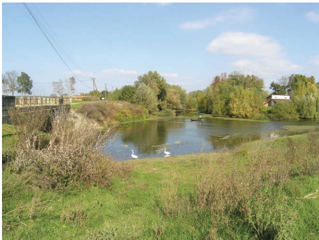
Početak Gatskog kanala