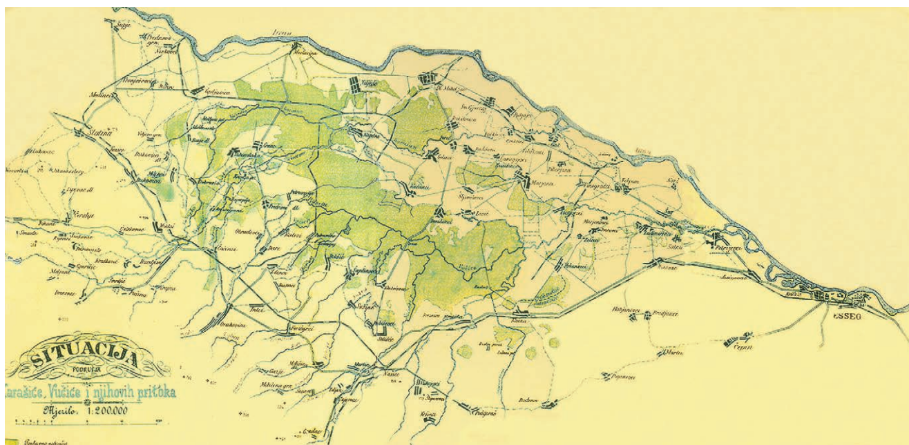
Prikaz sliva Karašice i Vučice prije melioracijskih zahvata