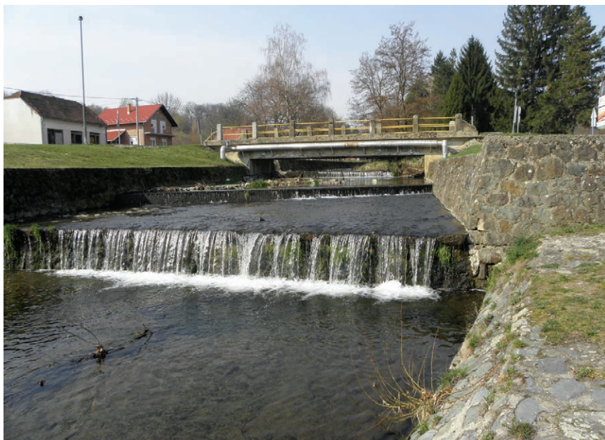
Vočinska rijeka u Vočinu

Malog Medveđaka. Inače se Vojlovica, od sutoka rječice Krajne sjeverno od Rajina Polja nadomak Crnca, u petnaestak kilo-