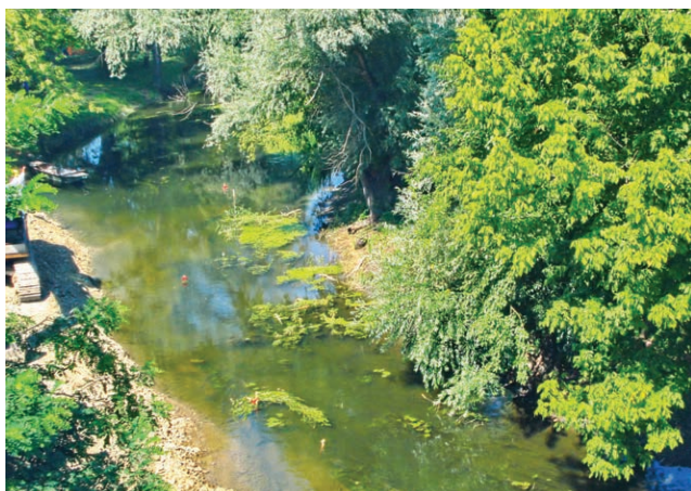
Karašica na dijelu toka kroz Valpovo

Vučica izvire na sjevernim obroncima središnjeg dijela Papuka, dijelom i Krndije. O njezinu toku, kao i za Karašicu, osnovne smo podatke uglavnom crpili iz izvještaja što ga je 1898. u Osijeku "kao manuskriptni izvještaj k regulacionom projektu tiskan", objavio Franjo Kreutzer, "ravnajući inženir predradnja". On je 1896. po nalogu "Kraljevske županijske oblasti u Osijeku" proputovao "poplavno područje Karašice i Vučice pri velikoj vodi" i potom izradio projekt regulacije, baš kao i prije toga sliva Vuke. Njegovim smo se podacima poslužili jer