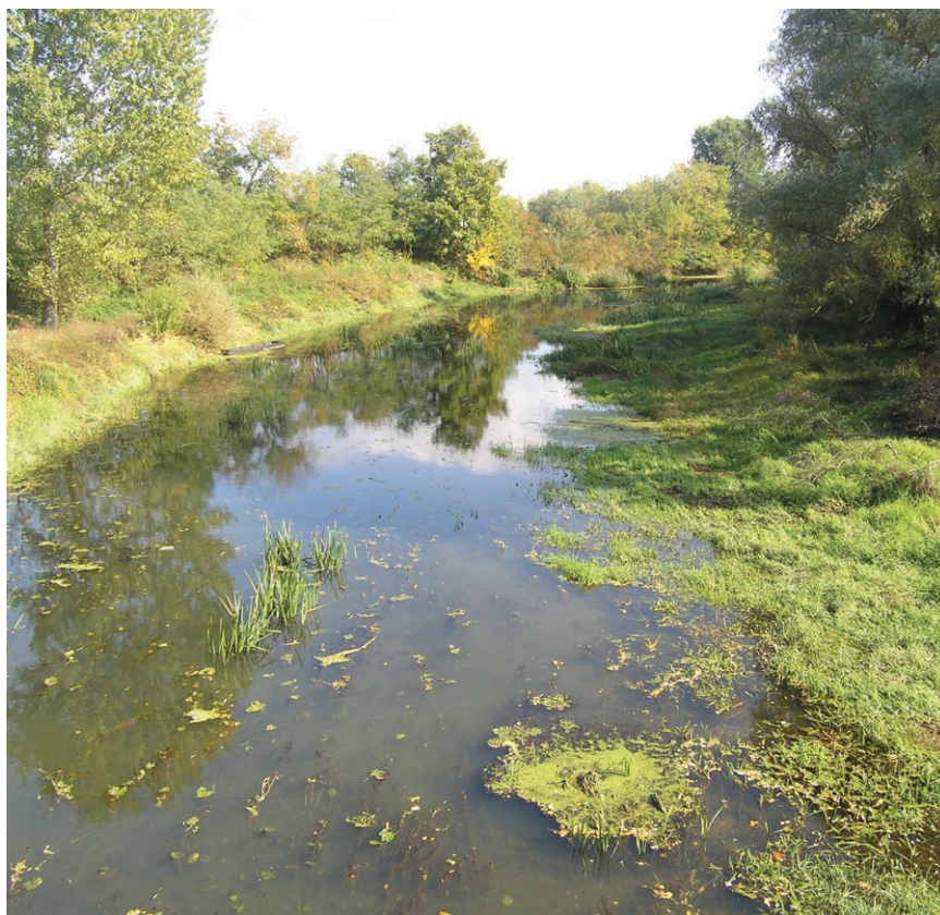
Karašica prije mosta u Črnkovicima