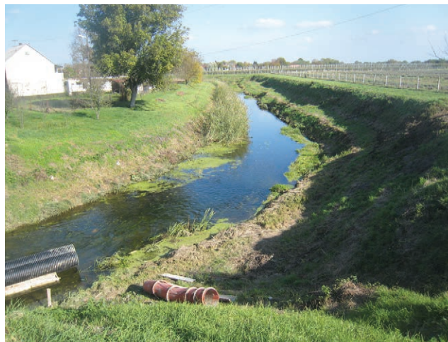
Karašica prije ulaska u Belišće