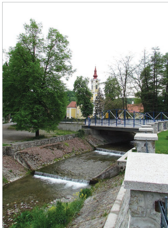
Regulirano korito Orahovačke rijeke odnosno Vučice u Orahovici