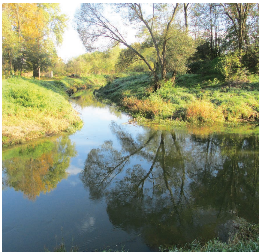
Ušće Karašice u Vučicu u Metlincima pokraj Ladimirevaca