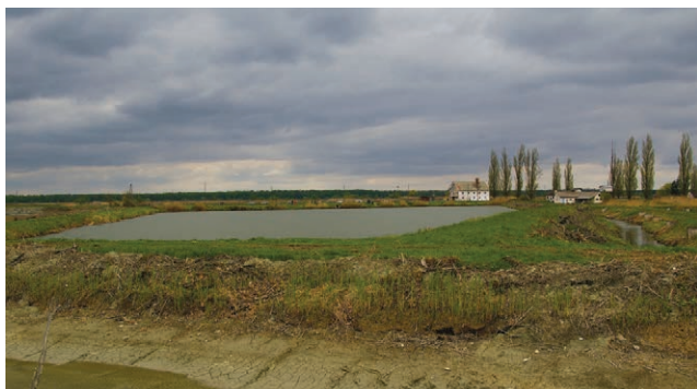
Detalj ribnjaka Grudnjak kroz koji protječe rijeka Vučica