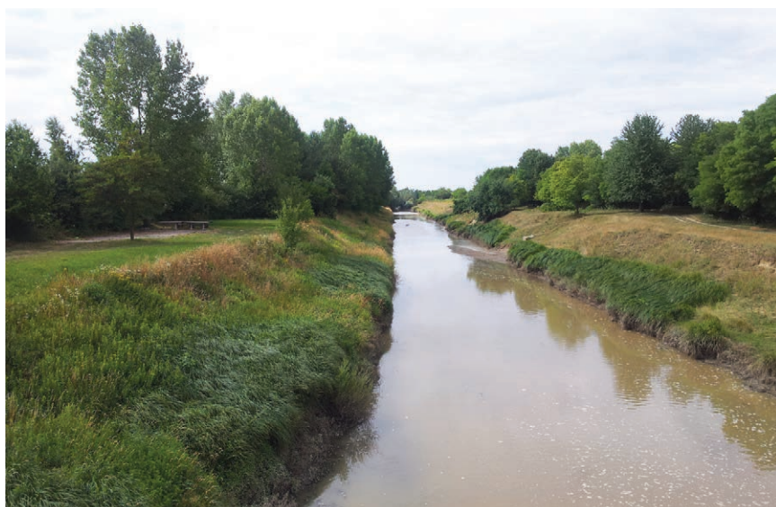
Kanal Vojlovica-Vočinska-Drava pokraj Čađavice

Svi su ti radovi znatno smanjili opasnost od poplava, ali je nisu potpuno otklonili. Stoga je Zadruga odlučila da se od Kapelne do Drave kod Donjeg Vijeleva izgradi odušni ili odteretni (često