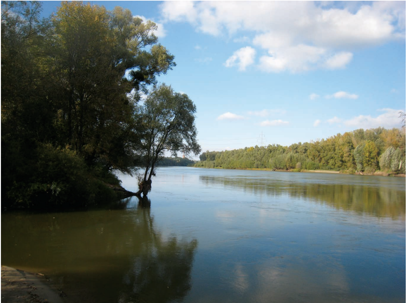
Ušće zajedničkog toka Karašice i Vučice u Dravu

ce do Vučice (gdje u VGI-u za mali sliv Karašice i Vučice inače vide njezin za-vršetak). Zbrojio je tok Karašice od ušća u Vučicu do spoja Branjinske i Voćinske rijeke (64,75 km), Donje Voćinske (16 km), Voćinske rijeke (36 km) i Djedovice (11,7 km) te tako dobio 128,45 km, što je vrlo blisko Kreutzerovu podatku koji je Karašici pribrojio i dio od Vučice do Drave. I za Vučicu je zajedno s Radlovačkom rijekom (11,1 km) izračunao ukupan tok od 89,08 km (nedostaje još koji kilometar najdužega gorskog potoka).