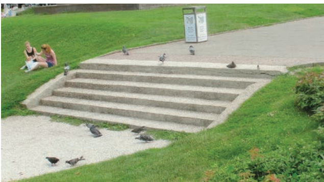
Silazak u park na Tomislavovu trgu – ni traga rukohvatu

Naš povremeni suradnik ali stalni čitatelj, inače umirovljenik od 85 godina, kao poticaj za raspravu piše o mukama starijih osoba na stubištima bez rukohvata, ali i o teškoćama koje nove generacije imaju u vezi s dimenzijama gazišta.