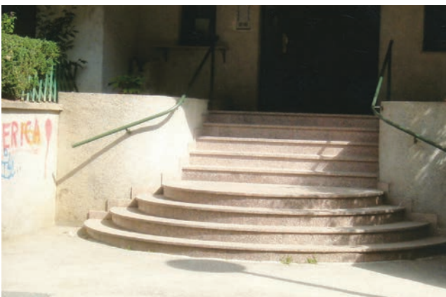
Skromni, ali svrhoviti rukohvati