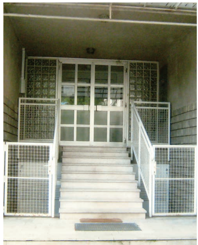
Ulaz u jednu stambenu zgradu u Zagrebu – primjer kako rukohvati mogu biti i dekorativni