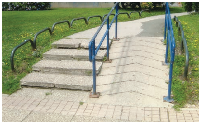
Detalj s južne strane pothodnika – stubište, rampa, ali i rukohvat