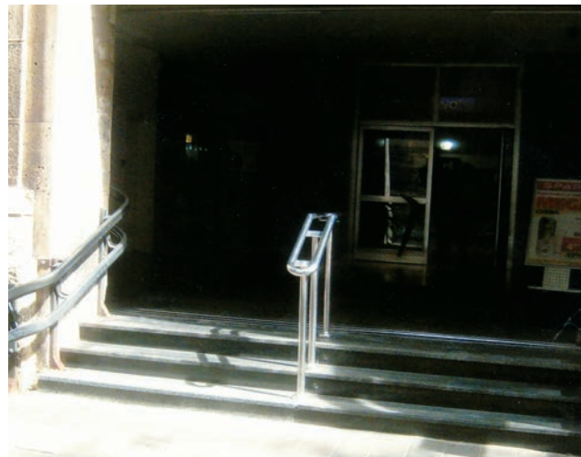
Ulaz u Glavnu poštu u Zagrebu – samo tri stube, ali i obostrani rukohvat

Hodajući po našoj "metropoli" svjedoci smo nedostatka rukohvata na prilazima javnih zgrada do prizemlja ili na ulazima u denivelirane parkove i slične javne sadržaje. Korištenje stubišta, posebice pri silascima, može izazvati i latentan strah kod korisnika jer eventualni pad