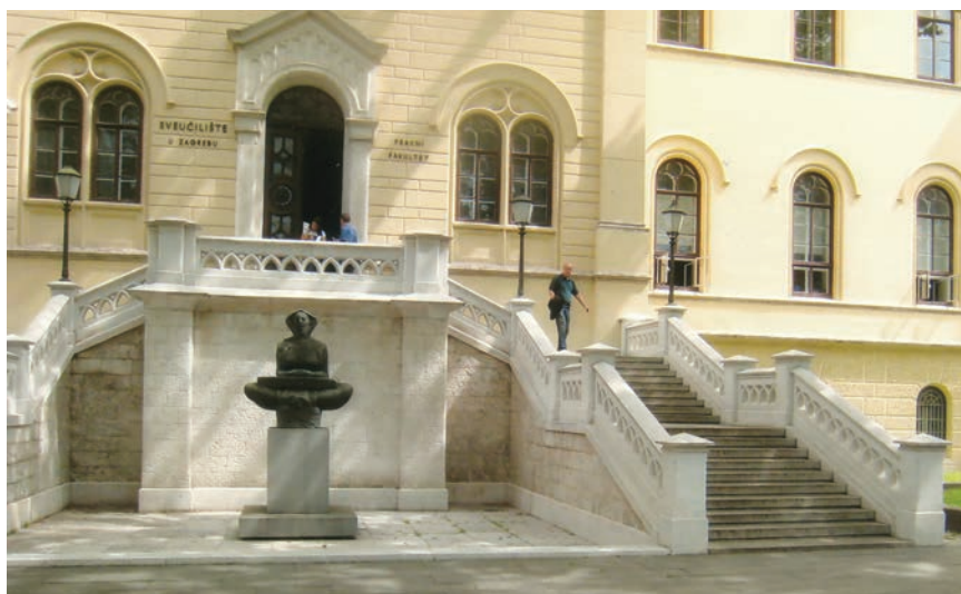
Reprezentativan ulaz s kamenim rukohvatima u rektorat Sveučilišta u Zagrebu

Svima je znana Gradska štedionica (danas Zagrebačka banka ) na Jelačićevu trgu koja je uz stotu obljetnicu renovirana, ali i dalje nema rukohvat na ulaznom stubištu. Mnogo je korisnika te banke u trećoj životnoj dobi pa se samo može zamisliti kako se uspijevaju popeći ili sići sa štapom ili s torbom na kotačima (za plac). Srećom za umirovljenike, susjedna Hrvatska poštanska banka ima ulaz u razizemlju. "Šećer na kraju" Meštrovićeva je "okruglica" na Trgu žrtava fašizma s prilazima i ulazima na prvi izložbeni kat. Upravo me je nedavna uspješna izložba fotografija ponukala da sve ovo napišem jer je penjanje do prvog kata preko dva stubišta bez rukohvata bio pravi "hod po mukama". Dizala dakako nema, a posebice je opasan bio silazak jer smo se prijatelj i ja morali međusobno pridržavati u strahu da se obojica ne sunovratimo. Ne želim razglabati o tome tko je zapravo odgovoran za ugradnju rukohvata i kolika je u tome uloga arhitekata ili nas građe-