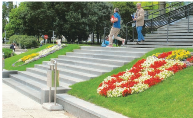
Ulaz u Gradsku skupštinu u Zagrebu – stubište bez rukohvata

Svima je znana Gradska štedionica (danas Zagrebačka banka ) na Jelačićevu trgu koja je uz stotu obljetnicu renovirana, ali i dalje nema rukohvat na ulaznom stubištu. Mnogo je korisnika te banke u trećoj životnoj dobi pa se samo može zamisliti kako se uspijevaju popeći ili sići sa štapom ili s torbom na kotačima (za plac). Srećom za umirovljenike, susjedna Hrvatska poštanska banka ima ulaz u razizemlju. "Šećer na kraju" Meštrovićeva je "okruglica" na Trgu žrtava fašizma s prilazima i ulazima na prvi izložbeni kat. Upravo me je nedavna uspješna izložba fotografija ponukala da sve ovo napišem jer je penjanje do prvog kata preko dva stubišta bez rukohvata bio pravi "hod po mukama". Dizala dakako nema, a posebice je opasan bio silazak jer smo se prijatelj i ja morali međusobno pridržavati u strahu da se obojica ne sunovratimo. Ne želim razglabati o tome tko je zapravo odgovoran za ugradnju rukohvata i kolika je u tome uloga arhitekata ili nas građe-