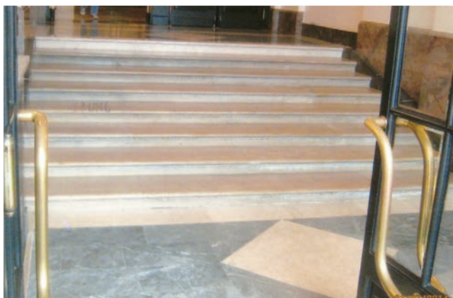
Stubište na ulazu u Zagrebačku banku na Jelačićevu trgu – bez rukohvata

Na kraju savjetujem svima iz naše struke da prelistaju knjigu slavnog Ernsta Neuferta Elementi arhitektonskog projektiranja , od stranice 135 nadalje te da se ponovno podsjetite na ono što su davno učili. Naime stari normativi za stubi-