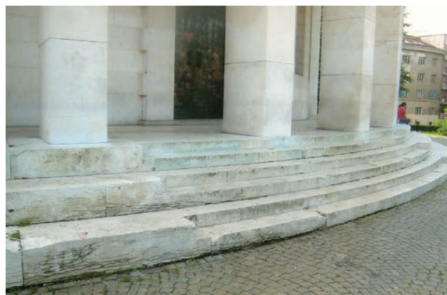
Glavni ulaz u Meštrovićev paviljon u Zagrebu – nigdje rukohvata