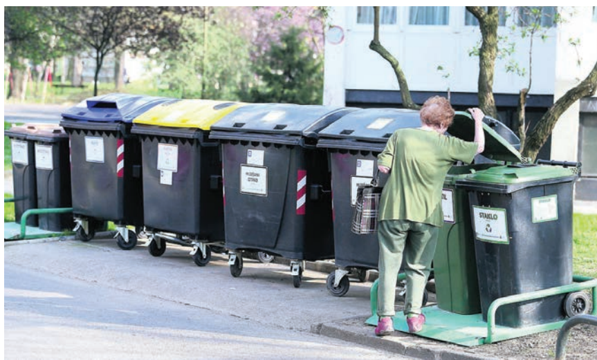
Kontejneri za odvajanje otpada u gradskim sredinama

U praksi to znači da će građani imati mogućnost besplatnog odlaganja raznih vrsta otpada, poput otpadnog papira, drva, metala, stakla, plastike, tekstila, glomaznog otpada, elektroničkog otpada (primjerice hladnjaka i perilica), otpadnih guma, akumulatora i baterije, ali problematičnog otpada (boja, lakova i sredstva za čišćenje), građevnog otpada te zelenog otpada nastalog kod radova u vrtu. Otpad se dalje obrađuje na ekološki prihvatljiv način jer se nakon ispravnog