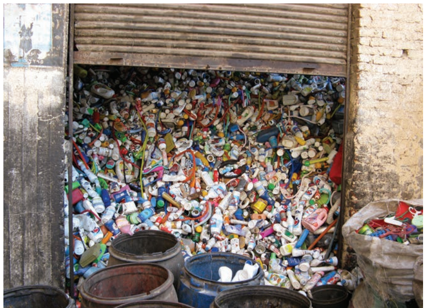
Način nepikladnog odlaganja plastične ambalaže

Smatra se da količina komunalnog otpada ovisi o stupnju urbanizacije, životnom standardu građana te o dobrim i lošim navikama potrošača