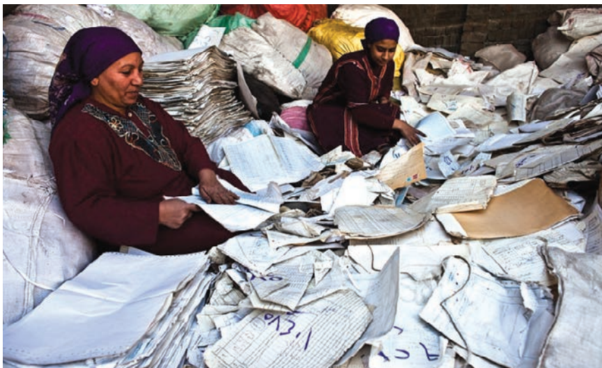
Ručno se sortiranje papira još uvijek obavlja u nekim dijelovima svijeta

(smanjenje veće od 99 %), a potrošnja je električne energije 2750 kWh (manja je za 40 %). Papir se može reciklirati do sedam puta jer se svaki put smanjuje i veličina vlakana.