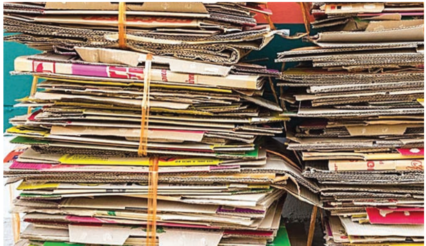
Odvojeno prikupljeni karton

Gotovo 70 % tehnologije ugrađene u spalionicu služi za obradu emisija ispuštenih plinova i stoji približno 50 % ukupne vrijednosti. Glavne su značajke postupka spaljivanja otpada nepogodnog za reci-