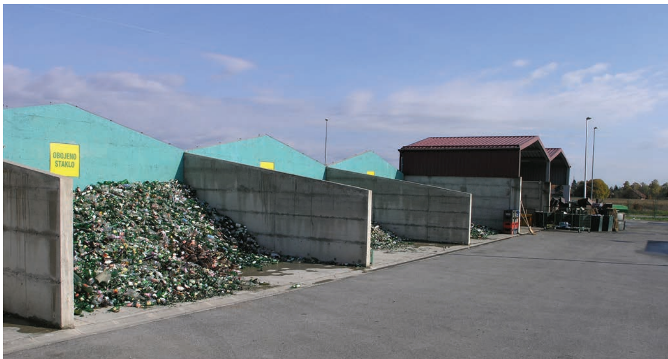
Reciklažno dvorište u Karlovcu

sredstva za nabavu spremnika, komunalne opreme, vozila i uređenje reciklažnih dvorišta. Reciklažno je dvorište nadzirani ograđeni prostor namijenjen odvojenom prikupljanju i privremenom skladištenju manjih količina posebnih vrsta otpada. Prema spomenutom Zakonu, svaka jedinica lokalne samouprave s manje od 1500 stanovnika mora osigurati barem mobilnu jedinicu, zapravo kamion s prikolicom u kojoj se nalaze razni spremnici za odvojeno skupljanje otpada. Gradovi i općine s više stanovnika moraju osigurati barem jedno reciklažno dvorište, dok ih oni s više od 100.000 moraju osigurati čak četiri, a grad Zagreb barem jedno reciklažno dvorište u svakoj gradskoj četvrti, što zapravo znači 17 reciklažnih dvorišta.