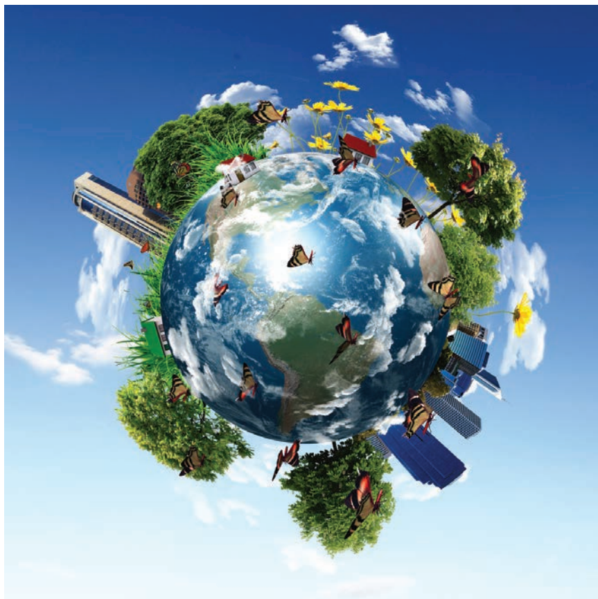
Logotip jedne od akcija "otpadom do energije"

Poslovni dnevnik, Novi list i internetski portali