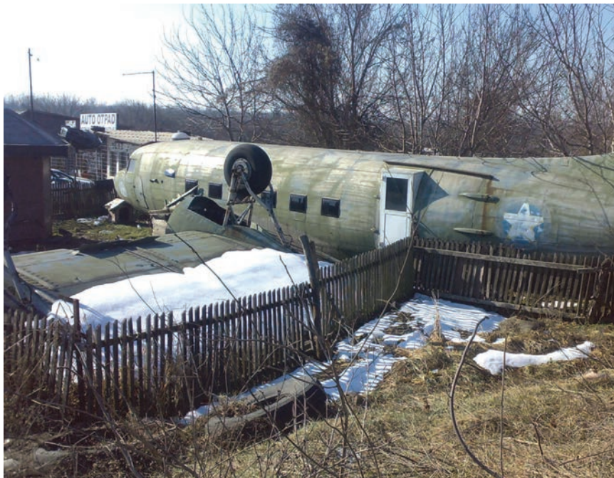
Primjer neprimjerenog odlagališta glomaznog otpada

Pitanje je kako proizvodne tvrtke raspo- lažu biorazgradivim otpadom, posebno što često stvaraju velike količine biološ- kog otpada koji bi se mogao reciklirati. Takav se otpad, koji se naziva i bioma- sa, može izravno iskoristiti kao gorivo ili neizravno kao bioplina za proizvodnju topline i električne energije. To shvaća sve više komunalnih i industrijskih po- duzeća koji uz primjene odgovarajuće tehnologije ostvaruju i ekonomsku do- bit.