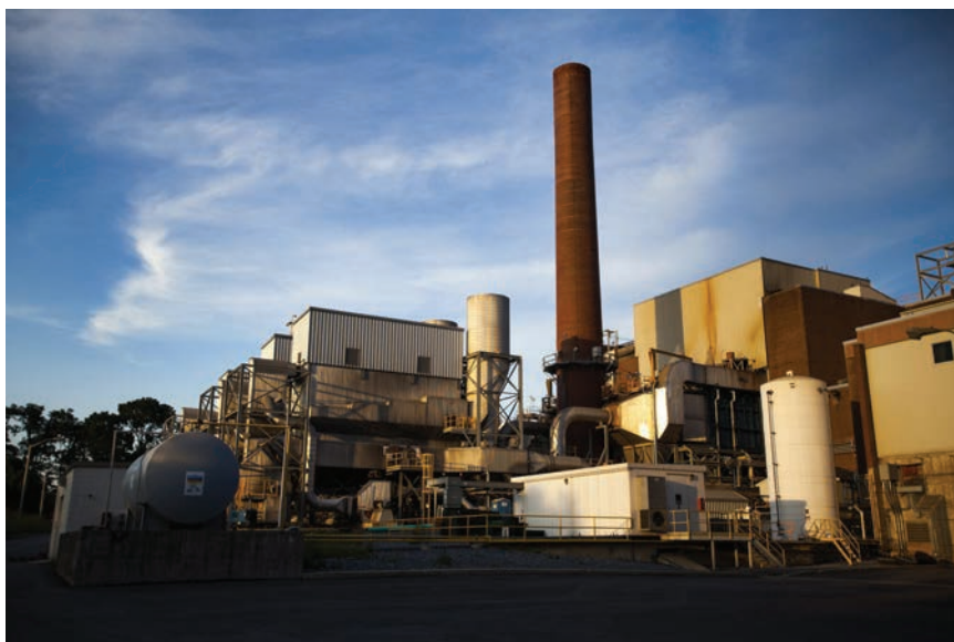
Spalionica otpada u Harrisburgu, SAD

Kako svjetsko stanovništvo nastavlja rasti, povećava se i potražnju za hra- nom, a uz povećanu je potrošnju po- trebno i više energije. To postavlja pi-