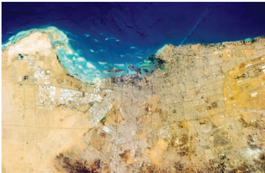
Grad i luka Džeda iz zraka ( Kingdom Tower gradi se sjevernije odnosno desno)

lometar. Naime točna je visina najstrože čuvana tajna, baš kao što je to bio slučaj i za Burj Khalifa (828 m s antenom), sadašnjim najvišim neboderom na svijetu koji je 2010. izgrađen u Dubaiu. Točan bi podatak mogao navodno nekoga potaknuti da ga pokuša nadmašiti. Da strahovi nisu neutemeljeni dokazuje i najava još jednog nebodera, 1050 m visokog Azerbajdžan tornja na umjetnim Khazar otocima na Kaspijskom jezeru, 25 km južno od Bakua. Tamo bi gradnja trebala početi 2015. i završiti 2019., baš kada i neboder u Džedi. Valja dodati kako je najprije bilo objavljeno da će Kingdom Tower (kako ga posvuda nazivaju) biti visok točno jednu milju (1609,344 m), ali se od tog odustalo, navodno zbog loših karakteristika temeljnog tla.