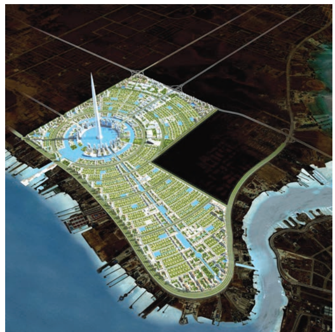
Prikaz budućega izgleda Kingdom Towera i Kingdom Cityja

novi gradić planiran na čak 23 četvorna kilometra i da je trebao stajati više od 100 milijardi dolara.