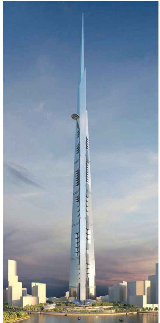
Prikaz izgleda u budućem okruženju

Konstrukcija svakoga velikog nebodera ne smije biti prekruta, ali ni previše fleksibilna zbog stabilnosti i mučnine koju izaziva kod onih koji u njoj borave