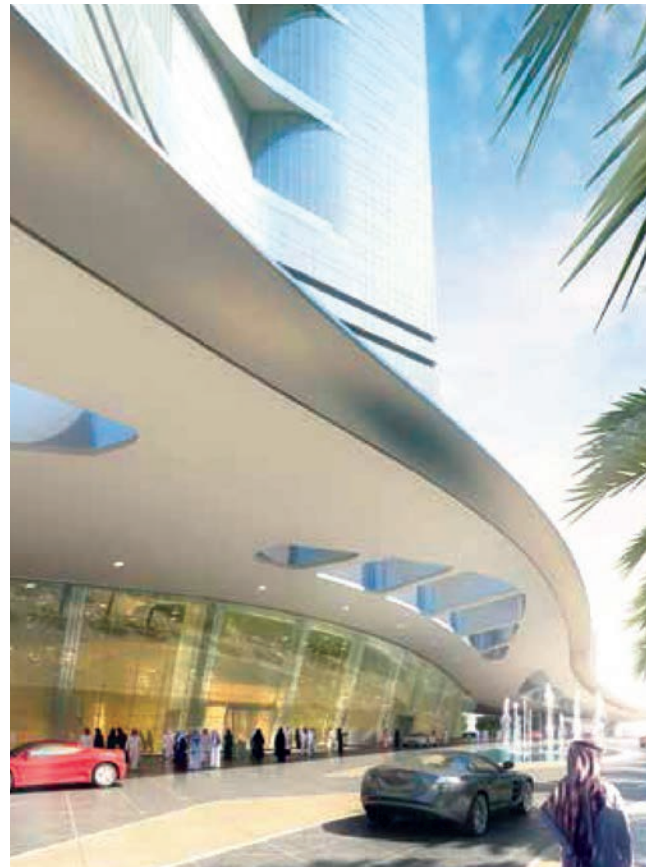
Prikaz budućega glavnog ulaza

područja. Smatraju da je Kingdom Tower samo simbol oholosti i da je golemo financijska sredstva bilo bolje uložiti u obrazovanje arapskih zemalja koje je na vrlo niskoj razini. Neki ekonomisti čak tvrde da su veliki novi neboderi loš ekonomski pokazatelj. Najdalje je u tome 1999. otišao Andrew Lawrence, voditelj istraživanja Deutsche Bank , koji je stvorio i poseban "neboder indeks", doduše u početku kao šalu, ali je uspješno ilustrirao da su mnoge od najviših svjetskih građevina izgrađene na pragu financijske propasti.