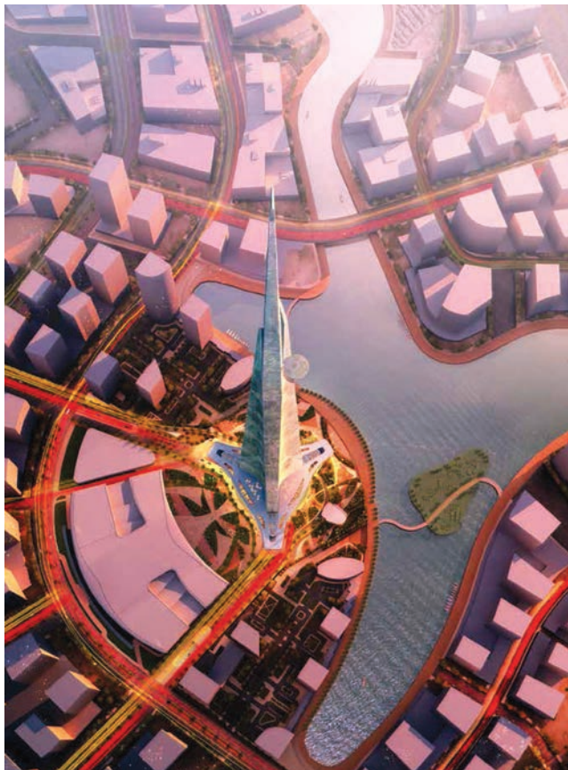
Prikaz izgleda Kingdom Towera iz zraka u predvečerje