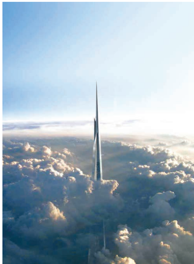
Mogući položaj Kingdom Towera u odnosu na oblake

jima, imati tri posebne postaje za liftove jer ni jedan zbog težine kabela neće ići do vrha. Navodno će ukupna vožnja do vrha trajati 12 minuta.