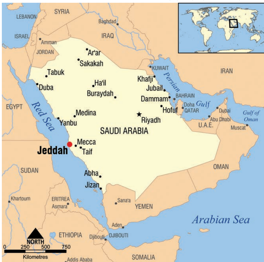
Položaj Džede na karti Saudijske Arabije

svijetu (312 m), a toranj je Nacionalne komercijalne banke najviša zgrada u Saudijskoj Arabiji. Međutim u Džedi se upravo gradi Toranj kraljevstva (arap. Burdž al-Mamlaka , engl. Kingdom Tower ) čija je najavljena visina jedan ki-