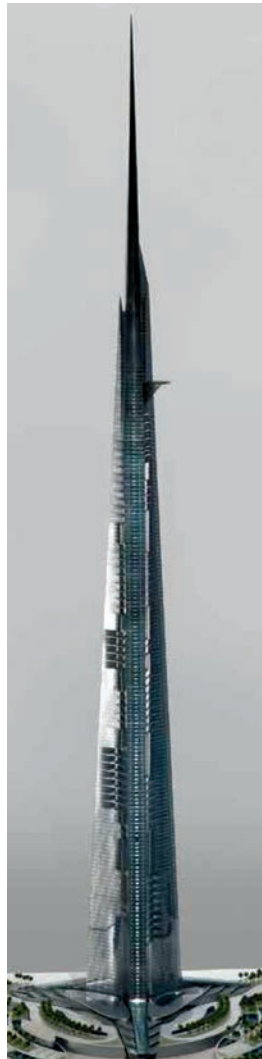
Cjelovit prikaz budućeg izgleda