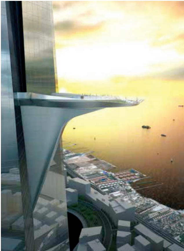
Prikaz izgleda vidikovca