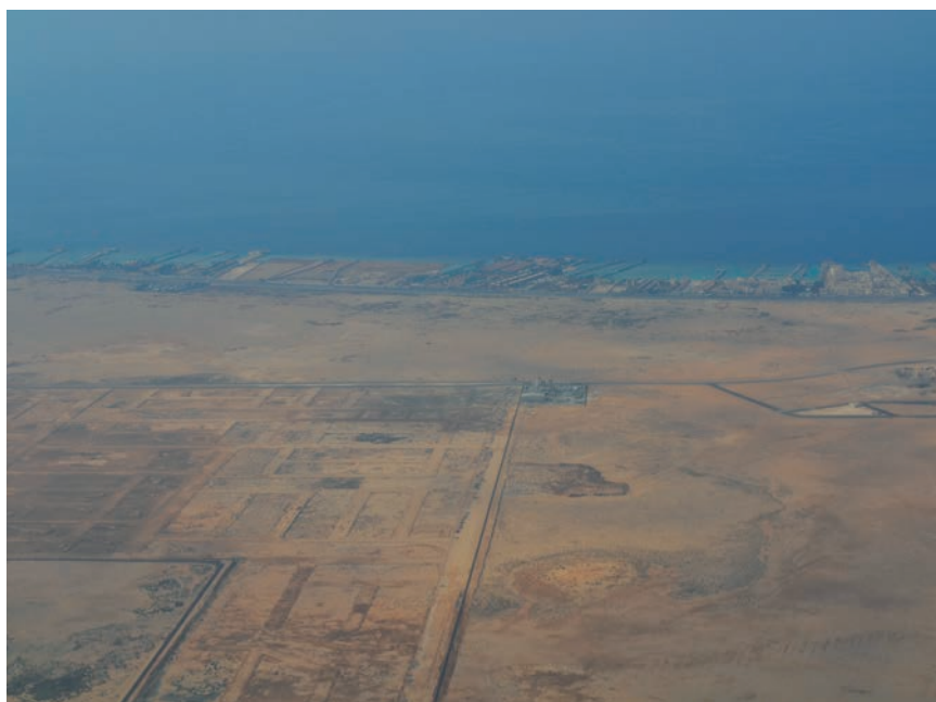
Približna lokacija Kingdom Towera