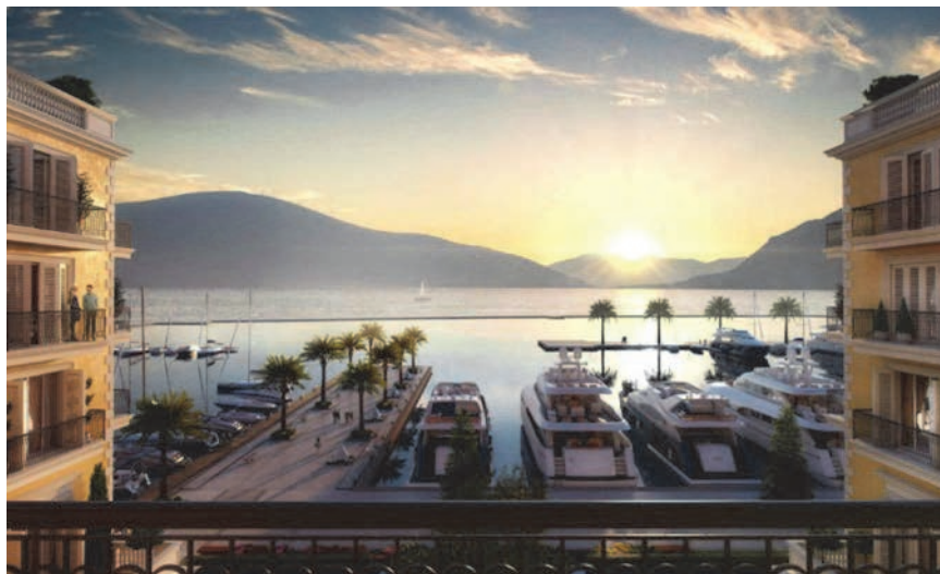
Pogled prema moru s terase luksuznog hotela

Naselje Porto Montenegro, u odnosu na broj stanovnika i jahti u marini, te zahtjevanu sigurnost u količinama i pritiscima vode, nije se moglo opskrbljivati iz vodovodnog sustava grada Tivta. Kao konačno, sigurno i pouzdano rješenje projekta vodoopskrbe naselja bila je predviđena vodoopskrba iz Regionalnoga vodovodnog sustava Crnogorskog primorja, koji su financirale Svjetska banka i EBRD (Europska banka za obnovu i razvoj).