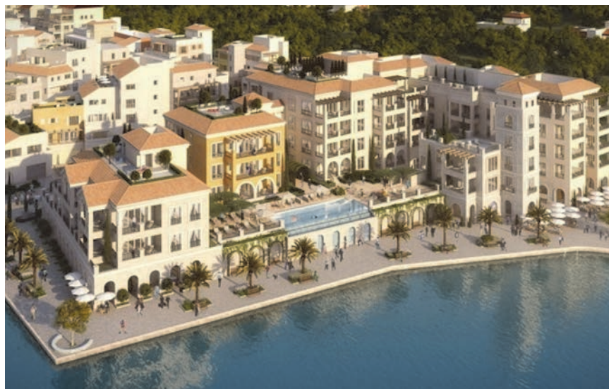
Pogled iz zraka na budući stambeni kompleks Ksenija

Investitor projekta Peter Munk sklopio je ugovor s jednim od najpoznatijih svjetskih lanaca hotela Four seasons koji je u