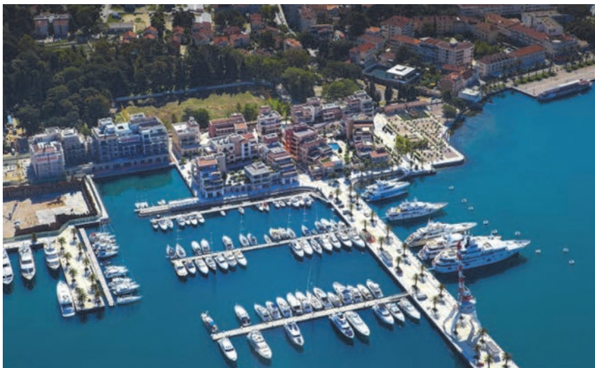
Sadašnji najčešći izgled marine