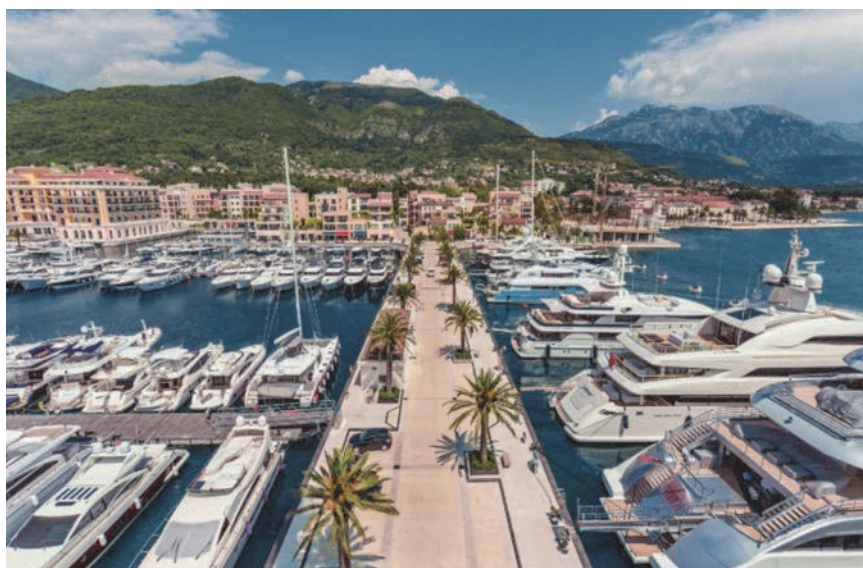
Prikaz budućeg izgleda marine

Marina je dakle izgrađena u bokokotorskom zaljevu na mjestu gdje se nekada nalazilo vojno brodogradilište Arsenal u Tivtu. Na prostoru srednjovjekovnih ljetnikovaca i imanja u vlasništvu kotorskih plemićkih obitelji, ratna mornarica Austro-Ugarske Monarhije krajem je 19. stoljeća izgradila vojno-remontno brodogradilište, što je zapravo prvi pokušaj industrijalizacije na cijelom području Boke kotorske. Remontno je brodogradilište djelovalo više od stoljeća. U tom relativno dugom razdoblju izgrađeni su