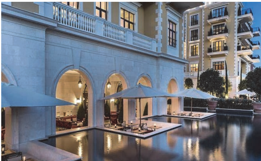
"Vodeni vrt" u hotelu Regent

područje grada Tivta. Sustav se sastoji od kolektora koji se pruža od Donje Lastve do Solila, gdje se priključuje na kanalizacijski sustav Kotor Trašte, odakle se otpadne vode podmorskim ispustom odvođe u zaljev Trašte, izvan bokokotorskog zaljeva. Na kolektor se izravno priključuju mreže naselja koja se visinski nalaze iznad kolektora, preko crpnih stanica Donja Lastva, Seljanovo, Kalimanj, Račica i Gradiošnica koja su visinski ispod kolektora. Prema glavnom projektu za otpadne vode Crnogorskog primorja na području Trašte, planirana je gradnja uređaja za pročišćavanje do 2018. godine. Razvoj Porto Montenegro pridonijet će povećanju stanovništva, pa je nužno mnogo detaljnije razraditi potrebu gradnje zajedničkog uređaja za pročišćavanje Kotora i Tivta.