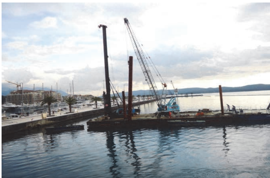
Pobijanje pilota za ugradnju velikih betonskih blokova

Specijalizirana plovila u akvatoriju sjeverno od tog mola prema uvali Seljanovo, trenutačno postavljaju velike utege za privezivanje jahti u tom dijelu Porto Montenegro. Ukupno se postavlja po pet velikih betonskih utega čija težina varira između 75, 90 i 110 tona. Radnici najprije na dno moraju postavljati kalupe u koje se onda s površine, preko crpki i cijevi ulijeva brzovezujući beton, pa se blokovi-sidra izlijevaju na unaprijed određeno mjesto. Rok je za završetak svih radova 15. lipnja 2015., a građevinari imaju zadatak da u tom roku u morsko dno ugrade 192 velika betonska pilota na koja će se oslanjati nova obala od predgotovljenih betonskih elemenata, svaki težine od gotovo 100 tona. Ukupno će se ugraditi 6815 m pilota, 9500 m 3 betona i 1000 t armature.