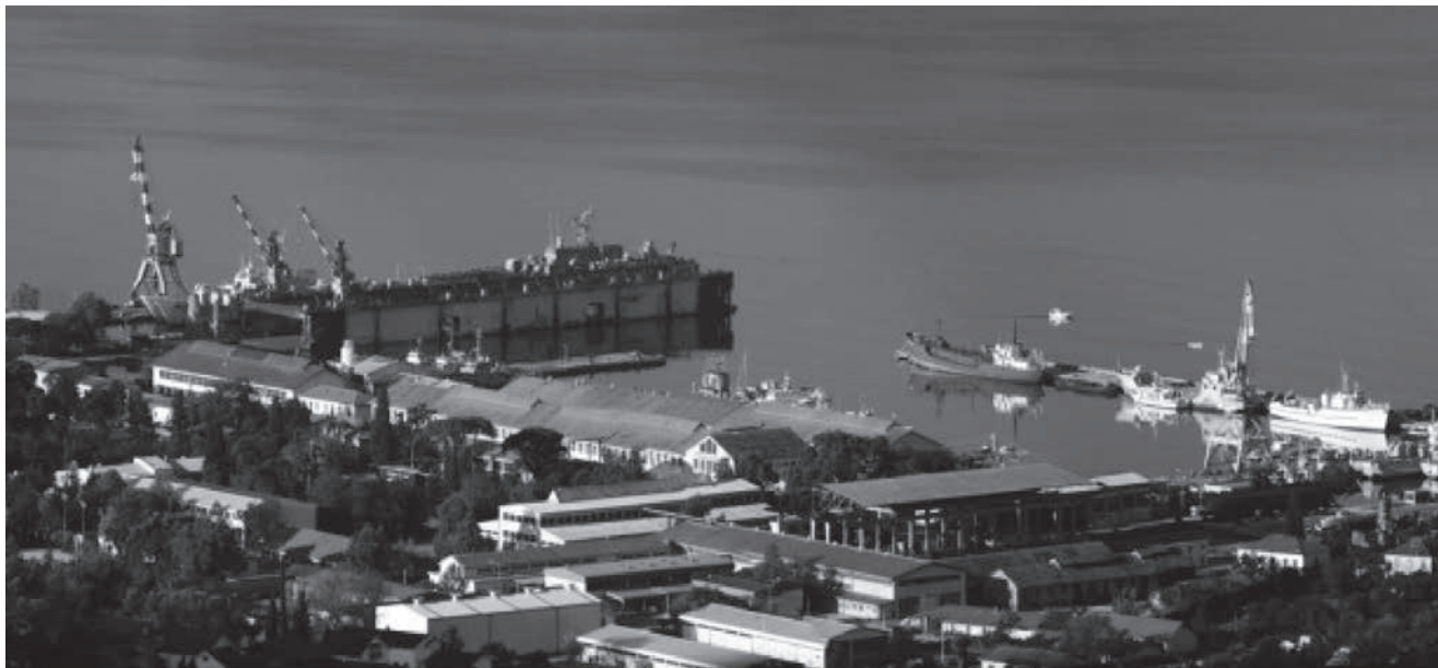
Arsenal – negdašnje vojno brodogradilište na čijem se mjestu gradi Porto Montenegro

hodno dostavila povoljan administrativno-pravni i fiskalni okvir te usvojila odgovarajuće prostorno-plansko rješenje novoga nautičkog kompleksa.