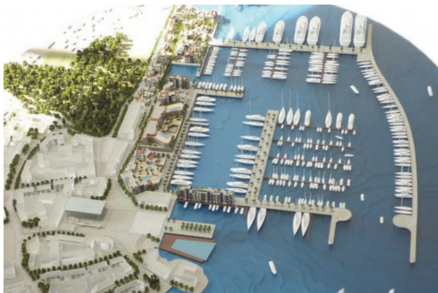
Pogled iz zraka na buduću marinu sa svim vezovima

37 vezova za brodove te kategorije, kao i 23 veza za nešto manje jahte. Druga je faza gradnje marine tijekom izvođenja i planiranja investicijskog programa podijeljena u dva dijela: sekcija "A" i sekcija "B". Ukupno je u prvoj i drugoj fazi izgrađeno 458 vezova. Planirana je vrijednost investicije u drugoj fazi 27,45 milijuna eura. Radovi su sekcije "A" započeli su u prosincu 2013., a završeni u listopadu 2014. Ukupna bruto izgrađena površina novih molova iznosi 14.492 m. Radovi u sekciji "B", odnosno izgradnja stambeno-poslovnog kompleksa Ksenija trajati će do ljeta 2015.