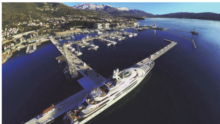
Pogled iz zraka na jugoistočni dio marine namijenjen megajahtama

Boravak u naselju i marini Porto Montenegro zabavan je i opuštajući, uz mnoštvo sadržaja, restorana, trgovina i modnih brendova. Događaji poput 24 sata elegancije , James Bond zabave u povodu predstavljanja luksuznog Mishara nakita, likovne izložbe Od futurizma do suvremene umjetnosti , prezentacija prve prestižne Mercedes Benz jahte Silver Arrows Marine , koncerti, modne i umjetničke predstave samo su neki od povoda da Porto Montenegro bude mjesto okupljanja članova europske jahtaške zajednice i mnogobrojnih turista.